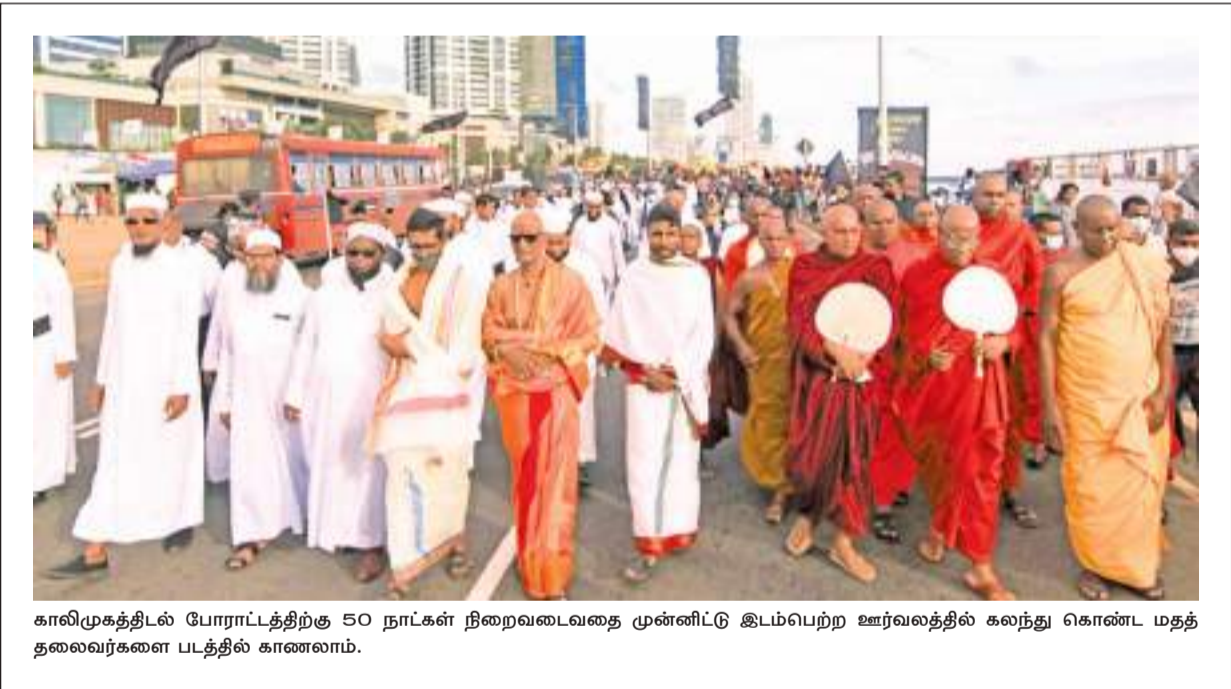
காலிமுகத்தில் போராட்டத்திற்கு 50 நாட்கள் நிறைவடைவதை முன்னிட்டு இடம்பெற்ற ஊர்வலத்தில் கலந்து கொண்ட மதத் தலைவர்களை படத்தில் காணலாம்.