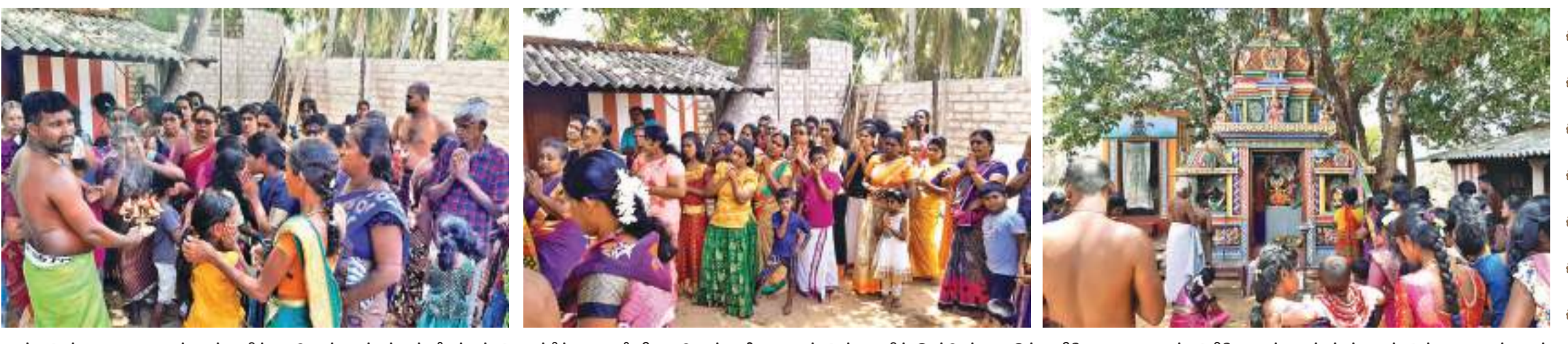
உட்பு ஆண்டிமுனை நாவல் மரத்தடியில் குடிசைகளுக்கு கன்னியம்மன் ஆலயத்தில் வைகாசி விசாக பெளர்ணமி பூஜைகள் அண்மையில் இடம்பெற்றன. இங்கு விவேக பூஜைகளும் அபிஷேகமும் நடத்தப்பட்டதுடன் அன்னதானமும் வழங்கப்பட்டது.

பண்டிட் ஸ்ரீ ராம் சர்மா ஆச்சார்யா தமிழில்: ஸ்ரீ ஸக்தி சுமணன்