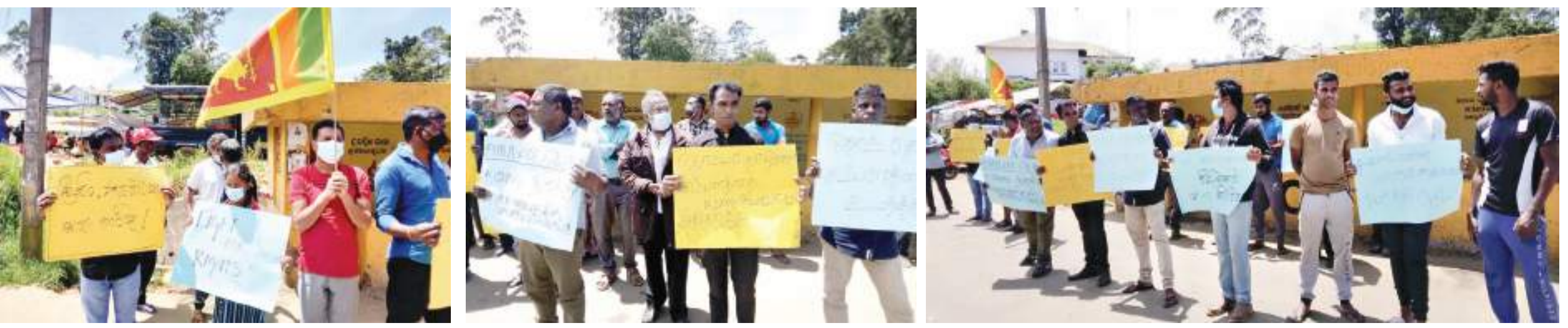
நுவரெலியா கந்தப்பனை நகரில் நேற்று முன்தினம் (28) சனிக்கிழமை இளைஞர் யுவதிகள் ஆர்ப்பாட்டத்தில் ஈடுபடுவதைக் காணலாம்.

அறைகளுள் சேதமடைந்துள்ளன. வனத்துறையினர் விரைந்து வந்து காட்டு யானையை விரட்டும் பணியில் ஈடுபட்டனர். எவ்வாறாயினும், இப்பிரச்சனைக்கு நிரந்தர தீர்வு காண அதிகாரிகள் நடவடிக்கை எடுக்க வேண்டும் என அவர்கள் கோரிக்கை விடுத்துள்ளனர்.