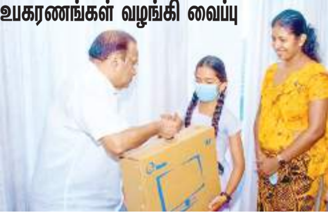
(ஹாவிஎல் விசேட நிருபர்)

பதுளை, மொனாராகலை மாவட்டங்களிலுள்ள பின்தங்கிய பாடசாலைகளுக்கு கணினி உபகரணங்கள் வழங்கி வைப்பு