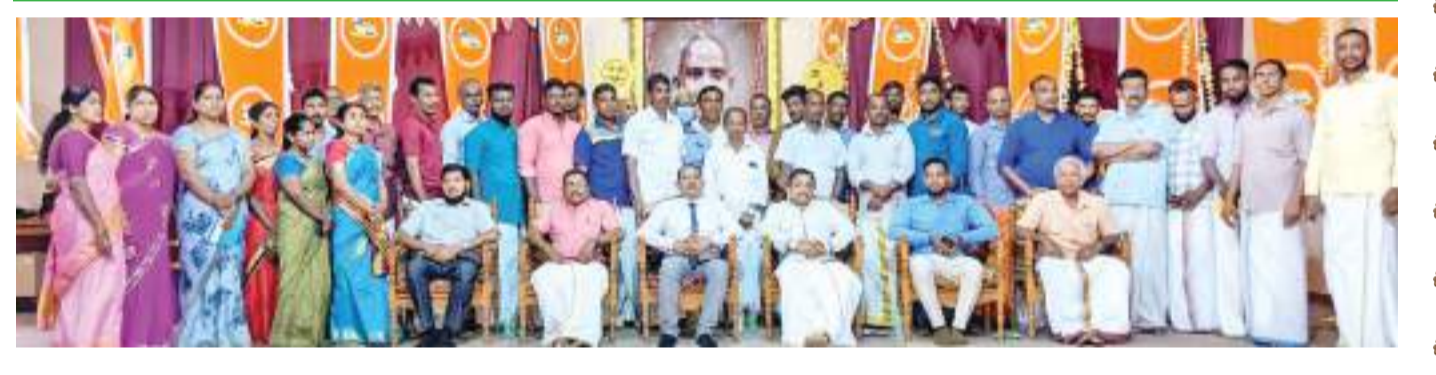
(காரைக்கால் குறாப் திருபுரம்)