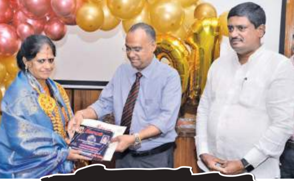
தினகரனின் 91 ஆவது ஆண்டு விழாவில் சிறந்த சமூக சேவையாற்றுகின்றவருக்கு வழங்கப்பட்டது.

மணமகன் வீட்டைவிட்டுப் புறப்படும் முன் வாஸல் இரு சமங்கலிப் பெண்கள் ஆரத்தி எடுப்பார்கள். மாப்பிள்ளையோடு தோழி (மாப்பிள்ளையின் திருமணமான பெண் தோழியைவைத் திருமணச் சடங்கில்