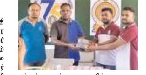
கல்முனை மத்திய தினகரன் நிகழ்வு

கல்முனை அல் பஹ்ரியா மகாவித்தியாலய ஆரம்பப் பிரிவு பகுதியில் மின்சார இணைப்பு இன்றி மாணவர்களும், ஆசிரியர்களும் பல்வேறு அசௌகரியங்களை மேற்கொண்டு வந்தனர். இது விடமாக பாடசாலை அதிபர், ஆசிரியர்கள், பழைய மாணவர் சங்கம் மற்றும் பாடசாலை அபிவிருத்தி சங்கம் விடுத்த வேண்டுகோளை ஏற்று Peral Champion 2k03 (பாடசாலையில் கல்வி கற்று 2003ம் வருடம் O/L புரட்சி எழுதிய) மாணவர்கள் மேற்படி மின் இணைப்பு வசதி களைச் செய்வதற்குரிய சுமார் 0.75 மில்லியன் நிதி உதவியினை வழங்கி வைத்தனர். மேற்படி நிதியுதவிகளை பொருட்கள் வழங்கும் நிகழ்வு பாடசாலை அதிபர் எம்.