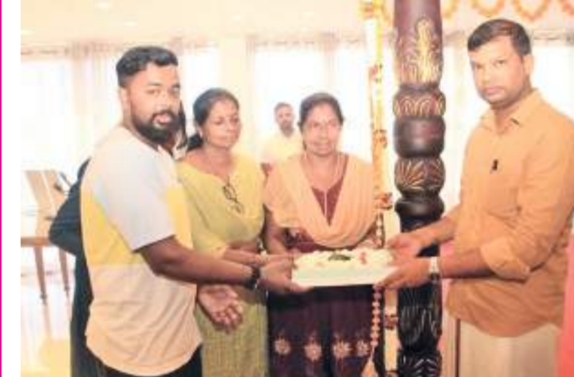
கொழும்பு செட்டியார் தெருவில் அமைந்திருக்கும் பிரபல தங்க நகை மாளிகையான பழமுத்து முத்துக்கருப்பன்