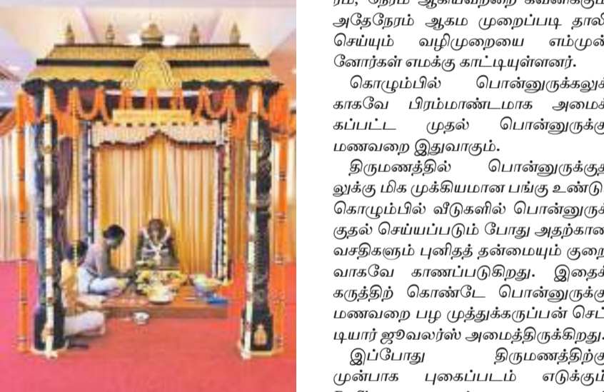
தங்க நகைமாளிகையில் சப நேரத்தில் ஆரம்பித்து வைக்கப்பட்டது. தாலியை செய்யும் போது சரியான நாள், நட்சத்திரம், நேரம் ஆகியவற்றை கவனிக்கும் அதேநேரம் ஆகம் முறைப்படி தாலி செய்யும் வழிமுறையை எம்முன் நோர்கள் எமக்கு காட்டியுள்ளனர்.