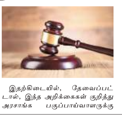
இதற்கிடையில், தேவைப்பட்டால், இந்த அறிக்கைகள் குறித்து அரசாங்கப் பகுப்பாய்வாளருக்கு