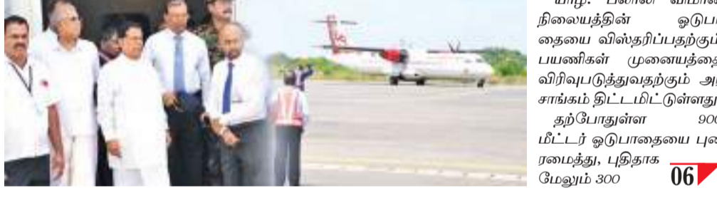
யாழ்ப்பாண பலாலி விமான நிலையத்தின் ஓடுபாதையை விஸ்தரிப்பதற்கும் பயணிகள் முனையத்தை விரிவுபடுத்துவதற்கும் அரசாங்கம் திட்டமிட்டுள்ளது. தற்போதுள்ள 900 மீட்டர் ஓடுபாதையை புனரமைத்து, புதிதாக மேலும் 300 06