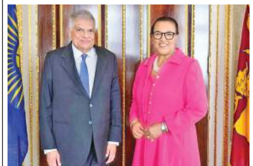
பிரிட்டனுக்கான விஜயத்தின் போது ஜனாதிபதி ரணில் விக்கிரமசிங்க, பொதுநலவாய நாடுகளின் செயலாளர் நாயகம் பெட்ரீசியா ஸ்கொட்ஸ்டை சந்தித்து பேச்சு நடத்தினார். பொதுநலவாய நாடுகளின் டிஜிட்டல் மயமாக்கல் வேலைத்திட்டங்கள் தொடர்பில் கலந்துரையாடிய ஜனாதிபதி, காலநிலை மாற்றத்தை எதிர்கொள்வதற்கான அரசாங்கத்தின் மூலோபாயங்கள் மற்றும் முயற்சிகளுக்கும் பொதுநலவாய நாடுகளின் ஒத்துழைப்பை பெறுவது குறித்தும் கலந்துரையாடினார்.