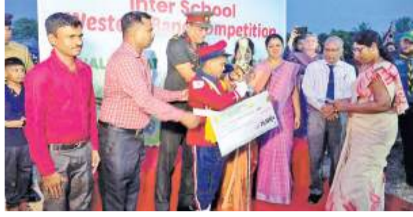
(மட்டக்களப்பு சுழற்சி நிருபர்)

பேண்ட் வாத்தியத்தினை ஊக்குவிக்க மட்டக்களப்பு கல்வி வலயத்தினால் ஏற்பாடு செய்யப்பட்ட பாடசாலைகளுக்கு இடையிலான பேண்ட் வாத்திய போட்டி, மட்டக்களப்பு வெபர் மைதானத்தில் இடம்பெற்றது. இவ் பேண்ட் வாத்திய போட்டியில் 21 பாடசாலைகள் பங்கு பற்றியமை குறிப்பிடத்தக்கது. அதில் மட்டக்களப்பு கல்வி வலயத்தில் மண்முனை வடக்கில் முதலாம் இடத்தை சிரேஷ்ட மற்றும் வலய மட்டக்களப்பு கல்வி வலயத்திலும் மட்டக்களப்பு புனித மிக்கல் கல்லூரி பெற்றுக் கொண்டதோடு, மட்டக்களப்பு புனித சிலிவியா பெண்கள் தேசிய பாடசாலை இரண்டாவது இடத்தையும், மட்டக்களப்பு மகாஜனா கல்லூரி மூன்றாவது இடத்தையும் பெற்றுக் கொண்டமை குறிப்பிடத்தக்கது. பேண்ட் வாத்திய அணிகளை