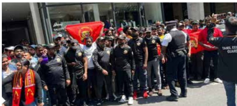
ட்டம் லண்டன் ஜோர்ஜ் ஸ்ட்ரீட்டில் நடைபெற்றது.

நேற்று முன்தினம் திங்கட்கிழமை லண்டன் சென்று இரங்கிய இலங்கை ஜனாதிபதி ரணில் விக்கிரமசிங்கவை 'ஈழத் தமிழர்களுக்கு எதிரான இனப்படுகொலையாளி' என விமர்சித்து, அவருக்கு எதிராக இரண்டு ஆர்ப்பாட்டங்கள் புலம்பெயர் தமிழர்களால் முன்னெடுக்கப்பட்டன. முதலாவது ஆர்ப்பாட்டம் லண்டன்பார்க் லேன் ஹோட்டல் முன்றலில் நடந்தது. அப்போது எடுக்கப்பட்ட படம் இது. மற்றைய ஆர்ப்பாட்டம் லண்டன் ஜோர்ஜ் ஸ்ட்ரீட்டில் நடைபெற்றது.