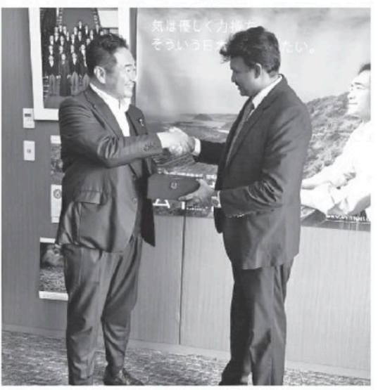
இவங்கையில் கிழக்கு மாசானத்தில் அமைந்துள்ள உலகத் தரம் வாய்ந்த உலாவல் இடங்களில் ஒன்றான அருகம்பே கடற்கரையை ஊக்குவிக்க கடற்கரை அதிகாரிகள் தேவையான நடவடிக்கை மேற்கொள்ள வேண்டும் என்ற கோரிக்கையையும்