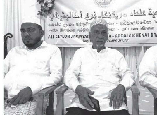
மேற்கொண்டு உயர்தரப் பரீட்சை எழுதும் வரையான காலப்பகுதி வரைக்கும் பிழையான செயற்பாடுகளிலும் பழக்கவழக்கங்களிலும் ஈடுபடாமல் தமது எதிர்காலத்தை வளமானதாக ஆக்கிக்கொள்ள வேண்டுமென கருத்துரைகள் வழங்கப்பட்டன.

இங்கு மாணவர்கள் சாதாரண தரப் பரீட்சை எழுதிவிட்டு பெறுபேறுகள் வரும்வரையான காலப்பகுதியிலும் உயர்தரக் கல்வியை