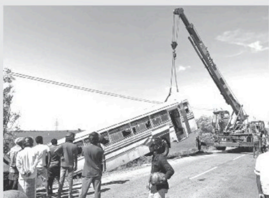
தப்பியோடியுள்ளதாகவும் அவரை கைது செய்ய மேலதிக விசாரணை நடவடிக்கைகளை மேற்கொண்டுள்ளதாகவும் சம்மாந்துறை பொலிஸார் தெரிவித்தனர்.

கதிர்காமத்தில் இருந்து யாத்திரிகர்களை ஏற்றிக்கொண்டு அம்பாறை வழியூடாக மட்டக்களப்புக்குச் சென்று கொண்டிருந்த தனியார் போக்குவரத்து பஸ் ஒன்று புதன்கிழமை(21) அதிகாலை 03 மணியளவில் சம்மாந்துறை வங்காளாடிப்பு பிரதேசத்தில் வீதியை விட்டு விடவி விபத்துக்குள்ளாகியுள்ளது.