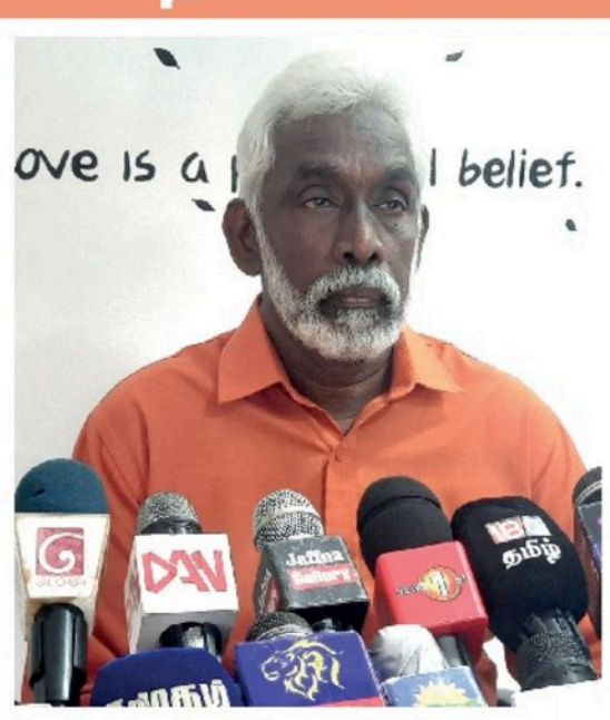
இலங்கையில் உருவாக்கப்படுகின்ற பெரும்பாலான சட்டங்கள் ஆட்சியில் உள்ளவர்களுக்காகவே உருவாக்கப்படுவதை கடந்த கால வரலாறுகள் எடுத்துக்காட்டுகின்றன.