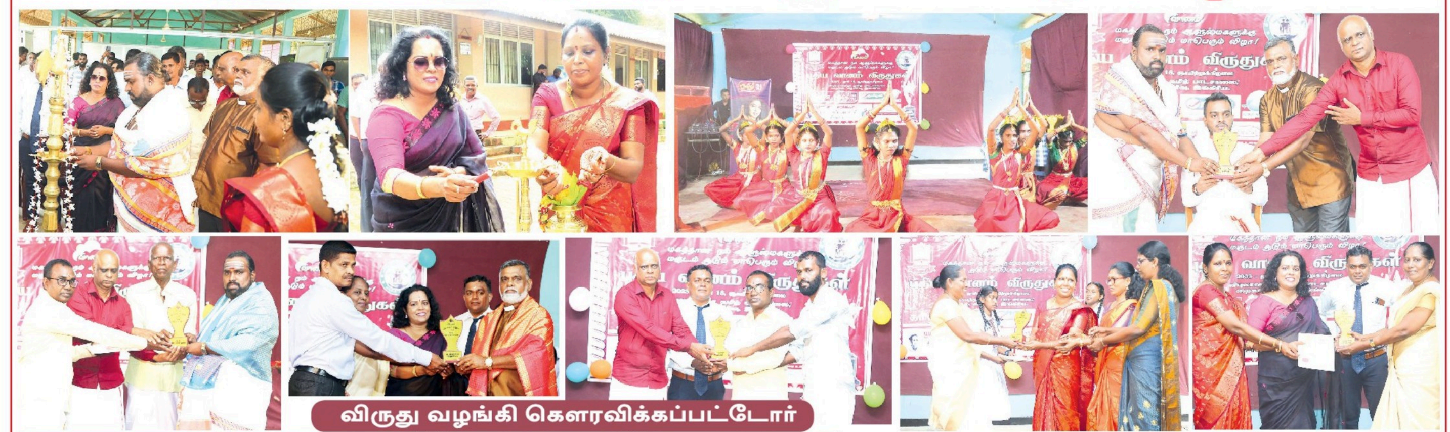
விருது வழங்கி கௌரவிக்கப்பட்டோர்