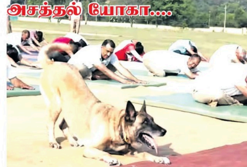
செய்தல் யோகா.... ஒவ்வொரு ஆண்டும் ஜூன் திசைச் சர்வதேச யோகா தினமாக கொண்டாடப்படுகிறது. இதனை முன்னிட்டு நேற்று ஜம்மு - காஷ்மீரின் உதம்பூரி லுள்ள மைதானமொன்றில் பொதுமக்கள் சிலர் யோகாவில் ஈடுபட்டனர். இதில் பங்கேற்றிருந்த நாய் ஒன்றும் மனிதர்களை போல, விதவிதமாக யோகா செய்து அசத்தியுள்ளது.