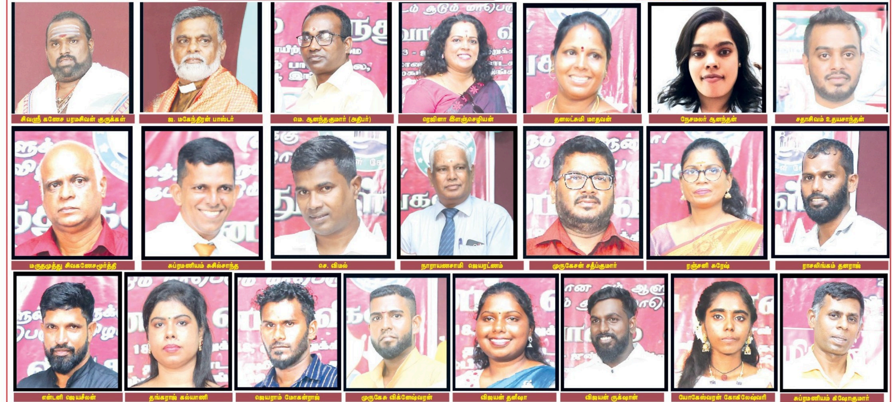
புதிய வானம் வலைக்காட்சியின் மாபெரும் விருது வழங்கும் விழா களுத்துறை, இங்கிரிய, நைகம், கீழ்ப்பிரிவு விபுலானந்தா தமிழ் வித்தியாலயத்தில் மிகவும் சிறப்பாக நடைபெற்றது. இந்நிகழ்வில், ஆன்மீகவாதிகள், கல்வியாளர்கள், சமூக தன்னார்வர்கள், கலை, இலக்கிய ஆர்வலர்கள் மற்றும் கலைஞர்கள் உள்ளிட்டோருக்கு இந்த ஆண்டுக்கான புதிய வானம் விருது வழங்கி கௌரவிக்கப்பட்டது. 'தமிழன்' நாளிதழின் ஊடக அஞ்சலணியில் இடம்பெற்ற இந்நிகழ்வுக்கு பூமணி அம்மா அறக்கட்டளை, சர்வதேச தமிழ் வானொலி பிரான்ஸ், மலையக தேன்மொழி மக்கள் சேவை, அகவலத்தை கணபதி அறநெறிப் பாடசாலை உள்ளிட்ட அமைப்புகள் அனுசரணை வழங்கியிருந்தன. நிகழ்வில் சமய குருமார்கள், சமூக செயற்பாட்டாளர்கள், ஆசிரியர்கள் உள்ளிட்ட பலர் கலந்துகொண்டனர். புதியவழி: சுபரமணியம் கிஷோகுமார்