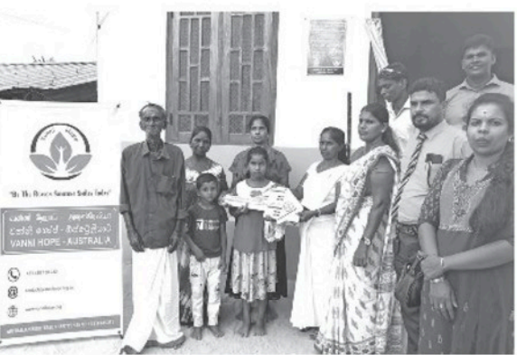
சிங்கள மக்களுக்கும் கல்வி, சுகாதாரம், வாழ்வாதாரம் உள்ளிட்ட அடிப்படை வசதிகளை எதுவித வேறுபாடுகளின்றி சேவை செய்து வருகின்றமை குறிப்பிடத்தக்கதாகும்.

தன்னார்வ தொண்டு நிறுவனமாக செயற்பட்டுவரும் வன்னிஹோப் நிறுவனம் வடக்கு, கிழக்கு மற்றும் மலையகம் உள்ளிட்ட பல பகுதிகளிலும் தமிழ், முஸ்லிம் மற்றும்