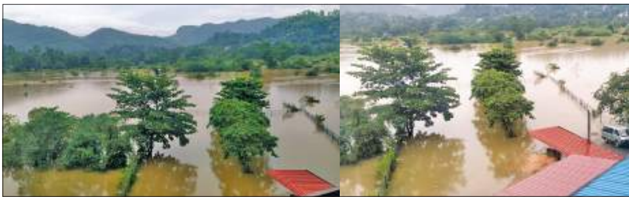
இரத்தினபுரி நகரை அண்மித்த தாழ்நில பகுதிகளில் வெள்ளம் ஏற்பட்டுள்ளதை படத்தில் காணலாம்.