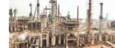
பொருள் சுத்திகரிப்பு நிலையம் 70 நாட்களுக்குப் பின்னர் மீள ஆரம்பிக்கும் முயற்சிகள் நேற்று முன்தினம் (30) முன்னெடுக்கப்பட்டிருந்தது.

சப்புக்கல்சந்த எரிபொருள் சுத்திகரிப்பு நிலையத்திலுள்ள கொதிகலன்களிலுள்ள (பொய்லர்) 'டர்போ' ஃபேன் 'குழாய்கள் வெடித்ததன் காரணமாக எரிபொருள் சுத்திகரிப்பு பணிகளை ஆரம்பிப்பதில் காலதாமதம் ஏற்பட்டுள்ளதாக சப்புக்கல்சந்த எரிபொருள் சுத்திகரிப்பு நிலையத்தின் உயர் அதிகாரியொருவர் தெரிவித்தார். கடந்த மார்ச் 20 ஆம் திகதியன்று மூடப்பட்டிருந்த சப்புக்கல்சந்த எரி