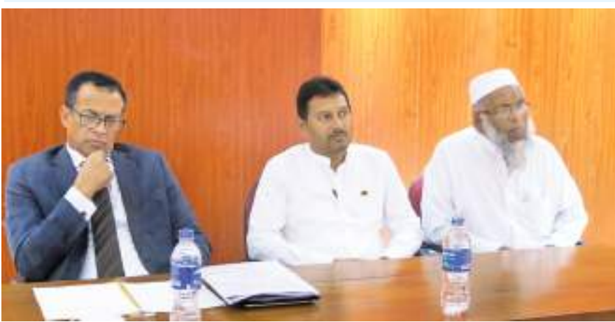
மாவத்தகம் தினகரன் நிருபர்