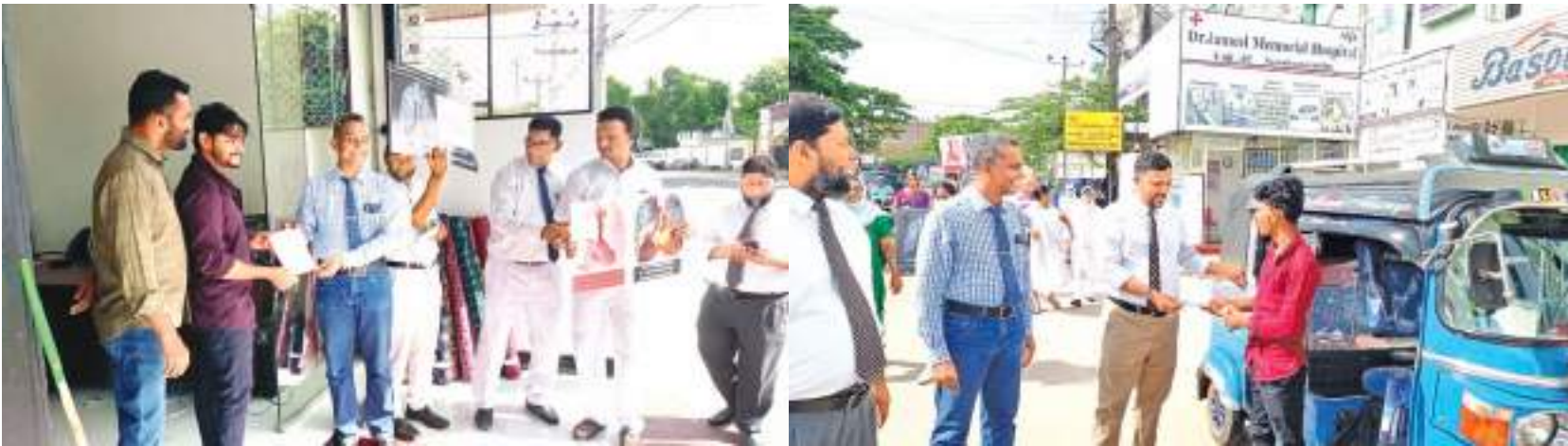
பாண்டிச்சேரி தினகரன் நிருபர்

உலக புகைப்பொருள் எதிர்ப்பு தினத்தை நினைவு கூரும் வகையில், கல்முனை பிராந்தியத்திற்கான பிரதான நிகழ்வு சாய்ந்தமருது பிரதேச வைத்தியசாலையில் செவ்வாய்க்கிழமை (31) இடம்பெற்றது. சாய்ந்தமருது பிரதேச வைத்தியசாலையின் மாவட்ட வைத்திய அதிகாரி