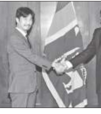
குறிப்பாக கோவிட்-19 உலகளாவிய தொற்றுநோயின் உச்சகட்டத்தின் போது ஜப்பான் அரசாங்கம் வழங்கிய தாராளமான உதவி மற்றும் ஆதரவைப் பாராட்டிய வெளிநாட்டு அலுவல்கள் அமைச்சர்

இலங்கை எதிர்கொள்ளும் தற்போதைய பொருளாதார சவால்களை வெற்றிகொள்வதில் இருதரப்பு ஈடுபாடுகள், உள்நாட்டு அபிவிருத்திகள் மற்றும் சர்வதேச சமூகத்தின் உதவிகள் தொடர்பான விடயங்கள் குறித்து கலந்துரையாடுவதற்காக ஜப்பான் பிரதித் தூதுவர் கச்சிகோட்டாரோ வெளிநாட்டு அலுவல்கள் அமைச்சர் பேராசிரியர் ஜி.எஸ். பிரிஸை அண்மையில் சந்தித்தார்.