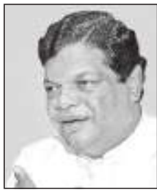
என தமிழ்நாட்டு முதலமைச்சர் கூறியுள்ளது தொடர்பாக எழுப்பப்பட்ட கேள்விக்குப் பதிலளித்த அமைச்சர், ஒவ்வொரு மாநில தலைமைகளிடையே மாறுபட்ட நிலைப்பாடுகள் உள்ளன. வடக்கு முதலமைச்சராக இருந்த விக்கேஷ்வுவரன் உலகுக்கு பல்வேறு கருத்துக்களை கூறியிருந்தார். அவை அரசின் நிலைப்பாட்டாக கருதப்படாது. அவை அவரின் கருத்து மாதிரிமே. இந்திய பிரதமர் நரேந்திர மோடி இது தொடர்பில் எந்த கருத்தும் தெரிவிக்கவில்லை. அரசின் நிலைப்பாட்டில் எந்த மாற்றமும் ஏற்படுவதாகவோ ஏற்படலாம் என்ற சமிக்ஞையே கூட முன்னவைக்கப்படவில்லை என்றார்.

கச்சதீவு தொடர்பில் இந்திய அரசின் நிலைப்பாட்டில் எந்த மாற்றமும் ஏற்படவில்லை. இந்திய பிரதமர் அனுதொடர்பில் எந்த கருத்தும் தெரிவிக்கவில்லை என அமைச்சரவை பேச்சாளரும் ஊடகத்துறை அமைச்சருமான பந்துல குணவர்தன தெரிவித்தார். தமிழ்நாட்டு முதலமைச்சரின் கருத்து இந்திய அரசின் நிலைப்பாட்டில் எவ்வளவு ஒருகாலத்தில் வடக்கு முதலமைச்சராக இருந்த சி.வி.விக்கேஷ்வுவரன் இவ்வாறான கருத்துக்களை உலகுக்கு முன்னவைத்ததாகவும் அமைச்சர் தெரிவித்தார்.