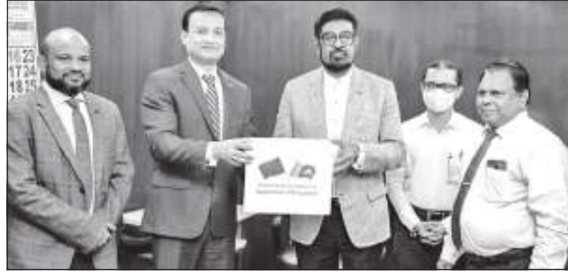
யடைவதாகவும், வரலாற்று ரீதியாக இருநாடுகளுக்கும் இடையிலுள்ள தொடர்பின் அடிப்படையில் உதவுவ

இந்த இக்கட்டான நேரத்தில் இலங்கைக்கு உதவுவதற்கு கிடைத்த தது குறித்து பங்களாதேஷ் மகிழ்ச்சி