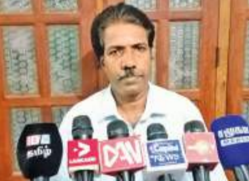
நாட்டுக் கடன் திட்டங்களினால் நாடு இன்று பாரிய பொருளாதார பின்னடைவை எதிர்நோக்கியுள்ளது. சர்வதேச நாணய நிதியம் மற்றும் உலக வங்கியிடம் கடன் கேட்க வேண்டுமானால் பல்வேறு நிபந்தனைகள் விதித்துள்ளனர். ஆனால் சீனாவிடம் நிபந்தனை இல்லாமல்