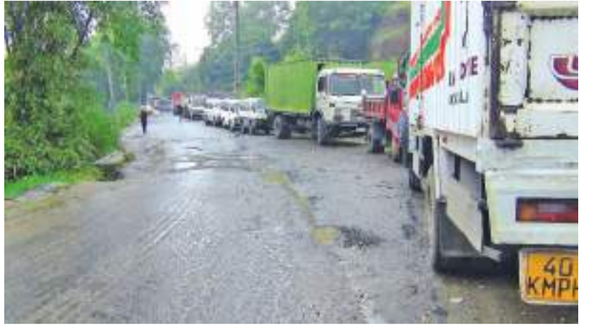
நோர்லூட் பகுதியில் சாரதிகள் ஊலுக்காக நாளுக்கு நாட்கள் வரிசையில் காத்திருப்பதை காணலாம்.

கப்பட்டுள்ள மகப்பேற்று வைத்தியசாலை கட்டடத்தில் கர்ப்பிணி தாய்மார்களுக்கு சிகிச்சை அளிப்பதும் நிறுத்தப்பட்டுள்ளது. மாறாக மாத்தளை பரிசோதனைகள் மாதிரி இடம்பெறுவதுடன் இக்கட்டத்தின் பின்னரே பெறுகின்றனர். கிராம சேவகர், சமுத்திர உத்தியோகஸ்தர் காரியாலயங்களாக மாறியுள்ளன. இதனால் தோட்டத்தில் கர்ப்பிணித் தாய்மார்கள் பாரிய அளவில் போக்குவரத்துக்கு, பண விரயம் செய்து மாவட்ட மற்றும் பிரதேச வைத்தியசாலை நாயே தமது வைத்திய சேவையை பெற்றுக் கொள்ள வேண்டியுள்ளதாக அவர் தெரிவித்தார். இது தொடர்பில் சம்பந்தப்பட்டவர்கள் விரைவில் கவனம் எடுக்குமாறு கோட்டு கேட்டுக் கொள்ளப்படுகிறது. ஆரமேல்