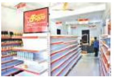
பல சதொச விற்பனை நிலையங்கள் பொருட்கள் இல்லாது வெறிச்சோடிக் காணப்படுகின்றன. தங்களுக்கு சதொச தலைமைக் களஞ்சியசாலைகளை விட்டு நடை நாட்களாக பொருள்

மட்டக்களப்பு உட்பட கிழக்கு மாகாணத்திலுள்ள சதொச விற்பனை நிலையங்கள் பொருட்கள் இன்றி வெறிச்சோடிக் கிடக்கின்றன இதனால் அந்நிலையத்தை நாடி பொருட்கள் வாங்க வரும் மக்கள் ஏமாற்றத்துடன் திரும்பிச் செல்வதைக் காண முடி கின்றது. சதொச விற்பனை நிலையங்களில் கடந்த சில நாட்களாக கையிருப்பில் உள்ள பொருட்கள் விற்பனை தீர்ந்து கொண்டிருக்கின்றன. இப்பொழுது