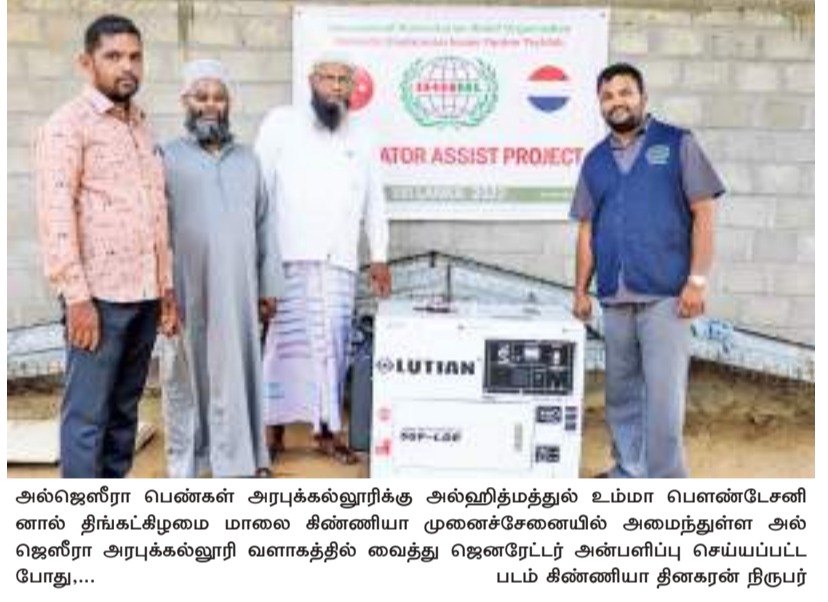
அல்ஜெனீரா பணிகள் அரபுக்கல்லூரிக்கு அல்ஹித்மத்துல் உம்மா பௌண்டேசனினால் தீங்கட்கிழமை மாலை கிண்ணியா முனைச்சேனையில் அமைந்துள்ள அல்ஜெனீரா அரபுக்கல்லூரி வளாகத்தில் வைத்து ஜெனரேட்டர் அன்ஸிப்பு செய்யப்பட்ட போது....

டுள்ள நிலையில், கிழக்கு மாகாண மக்களும் அதே நிலைமையை எதிர்நோக்கியுள்ளனர். இவ்வாறான நிலையில், அனைத்து நிறுவனங்களும் அத்தியாவசிய சேவைகளுக்கு மத்தியம் தமது நிதி ஒதுக்கீட்டை மிகச் சிக்கனமாக பயன்படுத்த வேண்டும் என்ற ஆலோசனையையும் அவர் வழங்கியுள்ளார். தங்களது திணைக்களத்திலும், திணைக்களத்தின் கீழுள்ள நிறுவனங்களிலும் நடைபெறும் சிறப்பு நிகழ்வுகளை ஏற்பாடு செய்தல், நிகழ்வுகளுக்கான அழைப்பிதழ்களை அச்சிடுதல், அத்தியாவசிய மற்ற உத்தியோகபூர்வ போக்குவரத்து நடவடிக்கைகள், இதுவரை ஆரம்பிக்கப்படாத அத்தியாவசிய மற்ற திட்டங்கள் மற்றும் கட்டுமானப் பணிகளை நடைமுறைப்படுத்துவதை இடைநிறுத்தாமலும் அறிவுறுத்தியுள்ளார்.