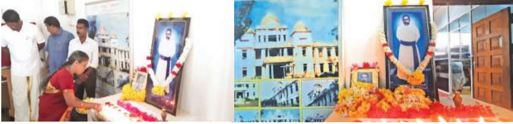
பருத்தித்துறை, யாழ்.விசேட, கோப்பாய் நிருபர்கள்

யாழ்ப்பாணம் பொதுசன நூலகம் தீயூட்டி எரிக்கப்பட்டு 41 ஆண்டு நினைவேந்தல் நேற்றைய தினம் புதன்கிழமை அனுஷ்டிக்கப்பட்டது. யாழ் மாநகர சபையின் ஏற்பாட்டில் நேற்று காலை 9.30 மணியளவில்