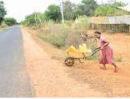
அமைக்கப்பட்டிருக்கும் குழாய் கிணறுகள் பழுதடைந்த நிலையில் காணப்படுவதாகவும் அவற்றைப் புனரமைத்து தருமாறும் கோரிக்கை விடுத்துள்ளனர்.

முல்லைத்தீவு புதுக்குடியிருப்பு பிரதேசத்துக்குட்பட்ட மந்துவில் மற்றும் மல்லிகைத்தீவு ஆகிய கிராமங்களில் குடிநீர் பெற்றுக்கொள்வதில் பெரும் சிரமங்களை எதிர்கொள்வதாக பிரதேச மக்கள் தெரிவித்துள்ளனர். முல்லைத்தீவு மாவட்டத்தின் புதுக்குடியிருப்பு பிரதேச செயலகத்துக்குட்பட்ட மந்துவில் மற்றும் மல்லிகைத்தீவு ஆகிய பகுதிகளில் குடிநீர் பெற்றுக்கொள்வதில் தாங்கள் பெரும் சிரமங்களை எதிர்கொள்வதாக பிரதேச மக்கள் தெரிவித்துள்ளனர். இப்பிரதேசத்தில் காணப்படுகின்ற கிணறுகளில் அதிகமானவை ஆழங்குடிய கிணறுகளாகவும் கூடுதலான கிணறுகள் நீர் வற்றியும் காணப்படுகின்றன. இந்நிலையில் சுத்தமான குடிநீரைப் பெற்றுக்கொள்வதில் பெரும் சிரமங்களை எதிர்கொள்வதாக சுட்டிக்காட்டியுள்ளனர். இதேபோன்று கரைநறைப்பற்ற பிரதேச செயலகத்துக்குட்பட்ட கேப்பாப் பாலு மிலக் குடியிருப்பு ஆகிய பகுதிகளிலும் குடிநீர் பற்றாக்குறை காணப்படுவதாகவும் தெரிவிக்கின்றனர். குறிப்பாக இப்பிரதேசத்தில் அமைக்கப்பட்டிருக்கும் குழாய் கிணறுகள் பழுதடைந்த நிலையில் காணப்படுவதாகவும் அவற்றைப் புனரமைத்து தருமாறும் கோரிக்கை விடுத்துள்ளனர்.