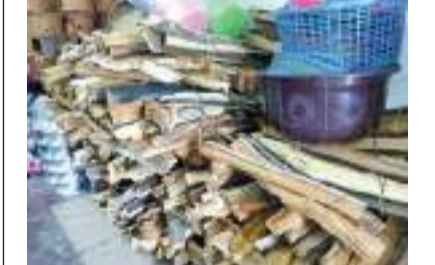
அக்குறண குறாப் நிருபர்

எரிவாயு தட்டுப்பாடு காரணமாக கண்டி உட்பட பிரதான நகரங்கள் பலவற்றிலுள்ள சுயர் மார்க்கட்டு கடைகளில் கூட தற்போது விறகுக் கட்டுக்கள் விற்பனைக்கு வைக்கப்பட்டுள்ளன. மடவளை நகரிலுள்ள ஒரு சுயர் மார்க்கட்டு கடைமில் அவ்வாறு விற்பனைக்கு வைத்துள்ள விறகுக் கட்டுக்களை மேலே காணலாம்.