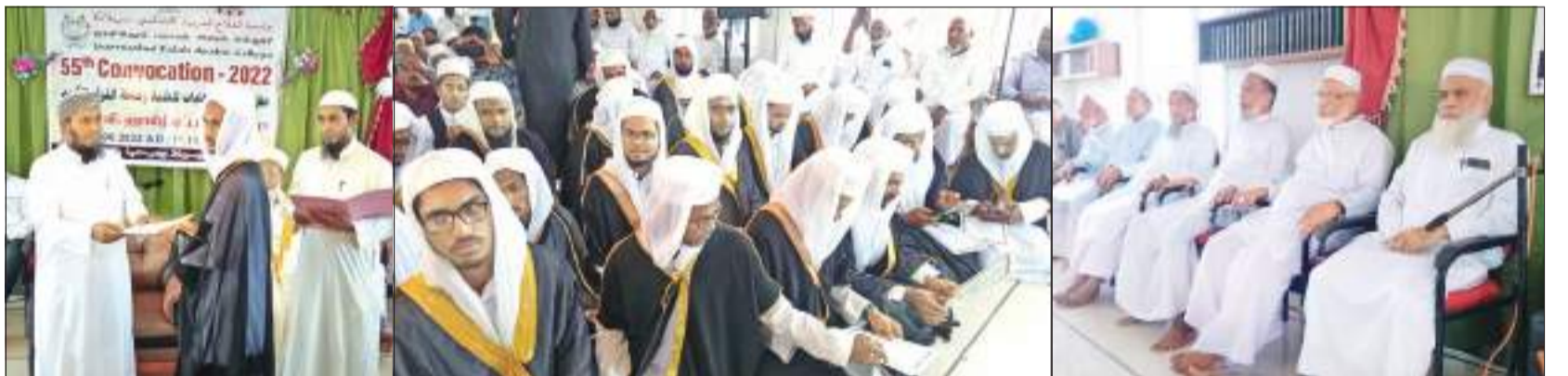
காத்தான்குடி ஜாமிஅத்துல் பலாஹ் அரபுக் கல்லூரியின் 55 ஆவது பட்டமளிப்பு விழா (12) ஞாயிற்றுக்கிழமை கல்லூரியின் புதிய காத்தான்குடி வளாகத்திலுள்ள பள்ளிவாசம் மண்டபத்தில் நடைபெற்ற போது. பட்டமளிப்பு விழாவில் 2020ஆம் ஆண்டு கற்கையை முடித்த 13 மெளலவிமாருமும் 2021ஆம் ஆண்டு கற்கையை முடித்த 19 பேருமாக 32 மெளலவிமாருக்கு இதன் போது பலாஹி பட்டம் வழங்கப்பட்டதுடன் சான்றிதழும் வழங்கப்பட்டன.