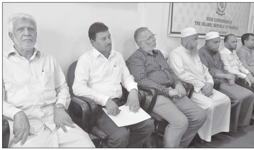
மாவத்தகம் தினகரன் நிருபர்

பாகிஸ்தான் உயர்ஸ்தானிகரத்தினால் கண்டி கட்டுக்கலை ஜும்ஆ பள்ளிவாசலில் புதிதாக அமைக்கப்பட்ட கணனி தொழில்நுட்ப ஆய்வு கூடம் திறந்து வைத்தல், தையல் பயிற்சி நிலையம் திறந்து வைத்தல், பாடசாலைப் பிள்ளைகளுக்கு கற்றல் உபகரணங்கள், விளையாட்டு உபகரணங்கள் வழங்குதல் மற்றும் பொருளாதார நெருக்கடியான நிலைமையைக் கருத்திற் கொண்டு உலருணவுப் பொதிகள் வழங்கும் நிகழ்வு கண்டி கட்டுக்கலை ஜும்ஆ பள்ளிவாசலில் ஏற்பாட்டில் பள்ளிவாசலுக்கு சபைத் தலைவரும் பாகிஸ்தான்