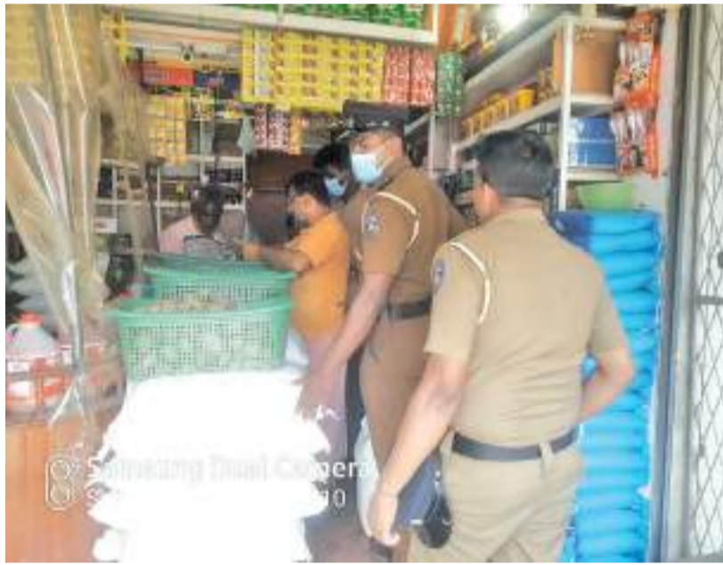
குறிப்பாக வெள்ளை நாகு 220 /-, சிவப்புபச்சை 210 /-, சம்பா 230/-, வெள்ளப்பச்சை 220 /-, விற்பனை செய்யப்படும் அரிசாங்கத்தினால் விலை நிர்ணயிக்கப்பட்டுள்ளது. எனினும் நிர்ணய விலையை விட

மன்னார் நகர் பகுதியிலுள்ள வர்த்தக நிலையங்களில் நிர்ணயிக்கப்பட்ட விலைக்கு அதிகமாக அரிசி விற்பனையில் ஈடுபட்ட வியாபாரிகளுக்கு எதிராக வழக்கு பதிவு செய்யப்பட்டுள்ளது. மன்னார் நகர்வோர் பாதுகாப்பு அதிகார சபை மற்றும் பொலிஸார் இணைந்து முன்னெடுத்த விசேட சுற்றிவளைப்பு நடவடிக்கையின் போதே இதுதொடர்பில் தெரியவந்துள்ளது. அதற்கமைய இவர்களுக்கு எதிராக சட்ட நடவடிக்கை மேற்கொள்ளப்பட்டுள்ளது. நிர்ணய விலை காட்சிப் படுத்தப்படாமல், அதிக விலையில் விற்பனை, நிர்ணயிக்கப்பட்ட விலைக்கு அதிகமாக அரிசி விற்பனை, பதுக்கி வைத்தமை போன்ற குற்றச்சாட்டுகளில் ஈடுபட்டமை தொடர்பில் இவர்களுக்கு எதிராக வழக்கு பதிவு செய்யப்பட்டுள்ளது.