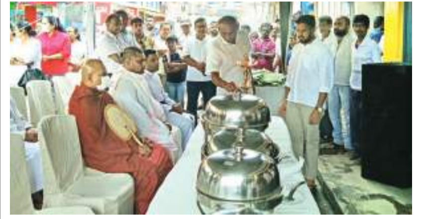
மல்கெலியா தினகரன் நிருபர்

மல்கெலியா நகரிலுள்ள பிரபல வர்த்தகர்கள் நேற்று மதியம் மரவள்ளி கிழங்கு சமைத்து தானம் வழங்கினர். இவ்வைப்பத்தில் மல்கெலியா கமரான விகாரை அறிவணக்கத்துக்குரிய தேரர் மற்றும் மல்கெலியா சண்முக நாதர் ஆலய குருக்கள் சென் ஜோசப் தேவாலயத்