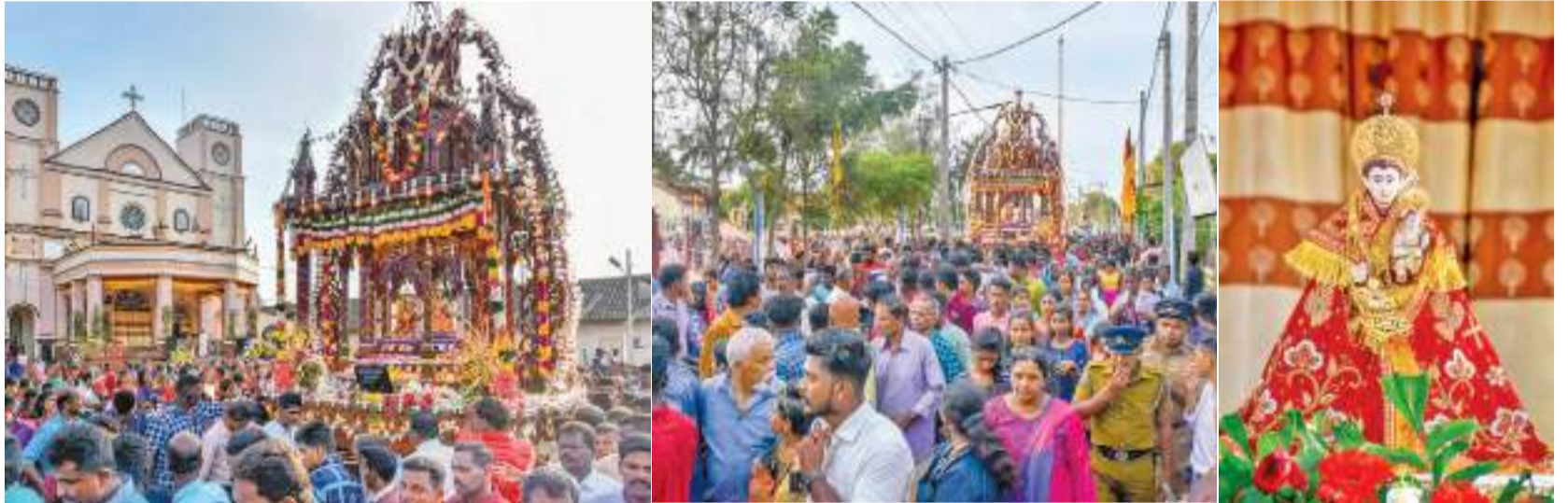
யாழ். பாசையூர் புனித அந்தோனியார் ஆலயப் பெருவிழா நேற்று முன்தினம் திங்கட்கிழமை வெகுவிரைவே நடைபெற்றது. இப்பெருவிழாவில் பதுவைப் புனிதரான அந்தோனியார் தேரின் ஏறி வீதி உலா வந்து பக்தர்களுக்கு ஆசி வழங்கினார். இந்திகழ்வில் பல லாயிரக்கணக்கான பக்தர்கள் அந்தோனியாரைத் தரிசிக்க வருகை தந்திருந்தனர்.