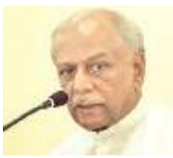
சன்னாகம் தபால் நிலையம் மற்றும் தபால் மாஅதிபரிள் உத்தியோகபூர்வ வாசஸ்தலத்தின் நிர்மாணப் பணிகள் நிறைவு பெறவில்லையென எதிர்ப்பு அளித்தார். தினேஷ் குணவர்தன தெரிவித்தார்.

யாழ். சன்னாகம் தபால் நிலையம் மற்றும் தபால் மாஅதிபருக்கான உத்தியோகபூர்வ வாசஸ்தலம் என்பவற்றின் நிர்மாணப் பணிகள் நிறைவு செய்ய தற்கால அனைத்து நடவடிக்கைகளும் எடுக்கப்பட்டுமென பொதுநிர்வாக, உள்நாட்டிலுவல்கள், மாகாண சபைகள் மற்றும் உள்ளூராட்சி அமைச்சர் தினேஷ் குணவர்தன நேற்று (21) பாராளுமன்றத்தில் தெரிவித்தார். தமிழ்த் தேசிய கூட்டமைப்பு பாராளுமன்ற உறுப்பினர் தர்மலிங்கம் சித்தார்த்தன், அமைச்சரிடம் கேட்ட கேள்விக்கு பதிலளிக்கையிலேயே அமைச்சர் தினேஷ் குணவர்தன தெரிவித்தார்.