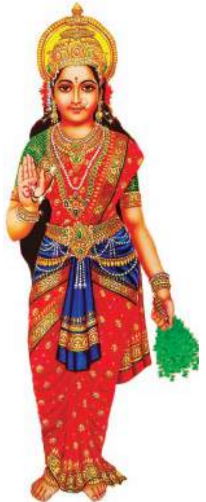
மக்களால் திருக்குளிர்ந்தி பாடி திருக்கதவு அடைக்கப்படுகின்றது. இந்த வேளையில் தேவியின் அற்புதங்களைப் பூசை ஆராதனைகளையும் தொகுத்து நோக்கும் போது பக்தர்களின் உள்ளம் பக்திப் பரவசத்தில் மூழ்குகின்றது.