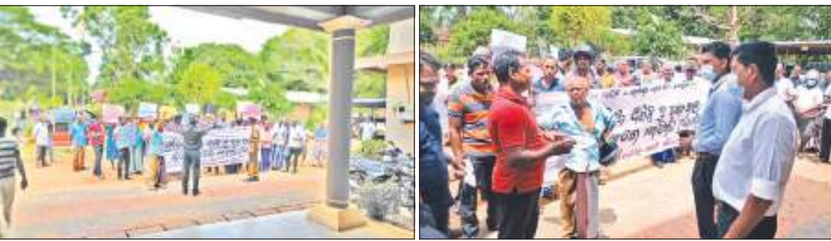
தம்பலகாமம் குறாப் நிருபர்

திருகோணமலை மாவட்டம், கோமரங்கடவெல பிரதேச செயலகத்துக்கு முன்பாக காணி கவிரிப்பதை நிறுத்தி சொந்த காணிகளை பெற்றுத் தருமாறு நேற்று (22) ஆர்ப்பாட்டம் ஒன்று இடம் பெற்றது. யுத்த காலத்தின் போது தங்களுடைய விவசாய காணிகளை இழந்த நிலையில் உள்ள போது தற்போது