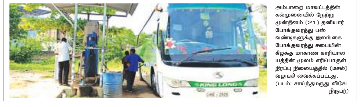
அம்பாறை மாவட்டத்தின் கல்முனையில் நேற்று முன்தினம் (21) தனியார் போக்குவரத்து பஸ் வண்டிகளுக்கு இலங்கை போக்குவரத்து சபையின் கீழ்க் மாகாண காரியாலயத்தின் மூலம் ஏரிப்பாருள் நிரப்பு நிலையத்தில் (ஊஸ்) வழங்கி வைக்கப்பட்டது.