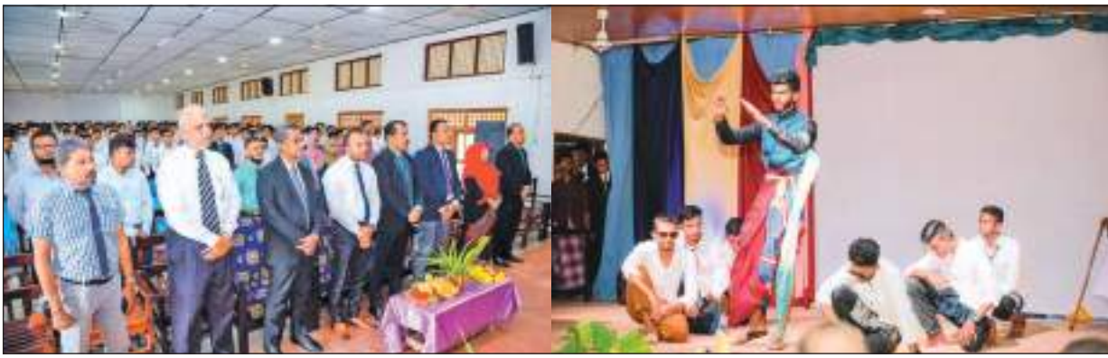
கல்முனை சாஹிரா தேசிய பாடசாலையின் 2021ஆம் ஆண்டு சாதாரண து மாணவர்களின் ஓ.எல். தின விழாவும் 'சாகரப்' நூல் வெளியீடும் கல்முனை சாஹிரா தேசிய பாடசாலையின் எம்.எஸ். காரியப்பர் மண்டபத்தில் வெகு சிறப்பாக இடம்பெற்ற போது..