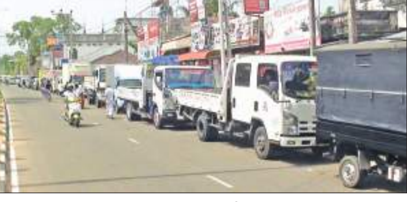
மட்டக்களப்பு குறாப் நிருபர்

மட்டக்களப்பு மாவட்டத்தில் சுமார் 15 நாட்களுக்குப் பின்னர் நேற்று டீசல் விநியோகிக்கப்பட்டது. தாளங்கூடா ஐ.ஓ.சீ மற்றும் ஆரையம்பதி சிபெற்கோ ஆகிய