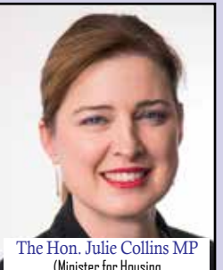
The Hon. Julie Collins MP (Minister for Housing Minister for Homelessness Minister for Small Business)