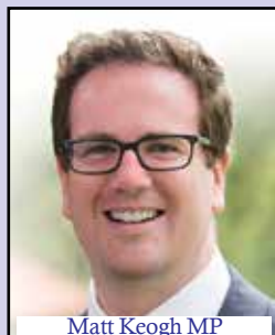
Matt Keogh MP Minister for Veterans' Affairs Minister for Defence Personnel