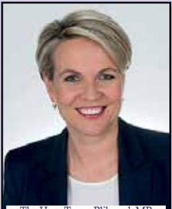
The Hon. Tanya Plibersek MP (Minister for the Environment and Water)