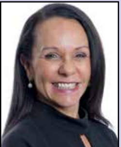
The Hon. Linda Burney MP (Minister for Indigenous Australians)