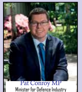
Pat Conroy MP Minister for Defence Industry Minister for International Development and the Pacific