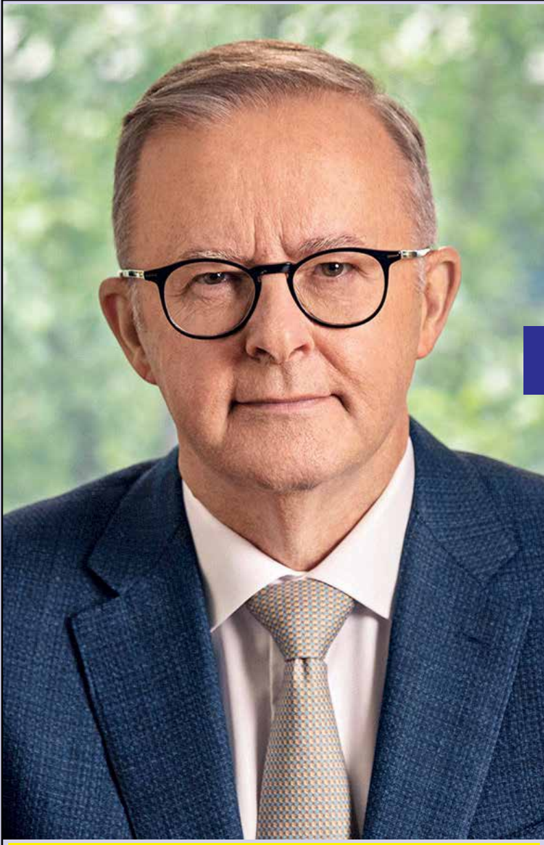
The Hon. Anthony Albanese MP (Prime Minister)