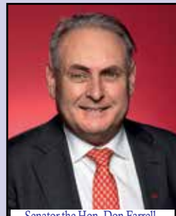
Senator the Hon. Don Farrell (Minister for Trade and Tourism Special Minister of State)