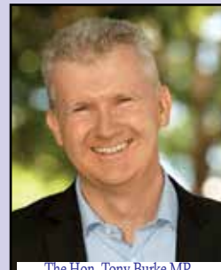
The Hon. Tony Burke MP (Minister for Employment and Work- place Relations, Minister for the Arts)