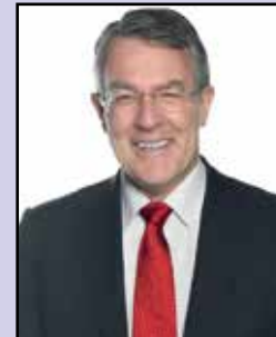
The Hon. Mark Dreyfus QC MP (Attorney-General, Cabinet Secretary)