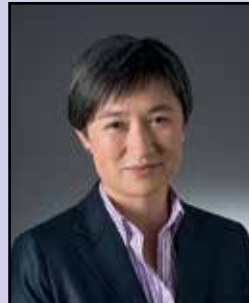
Senator the Hon. Penny Wong (Minister for Foreign Affairs)