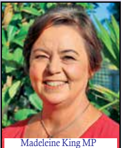
Madeleine King MP Minister for Resources Minister for Northern Australia