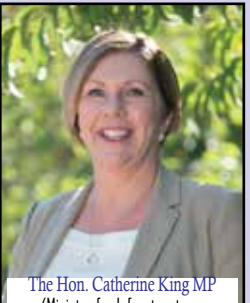
The Hon. Catherine King MP (Minister for Infrastructure, Transport, Regional Development and Local Government)