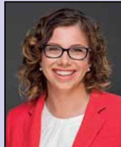
The Hon. Amanda Rishworth MP (Minister for Social Services)