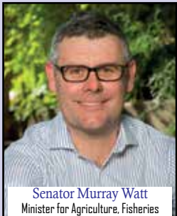
Senator Murray Watt Minister for Agriculture, Fisheries and Forestry Minister for Emergency Management