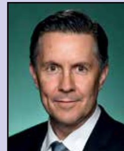
The Hon. Mark Butler MP (Minister for Health and Aged Care)