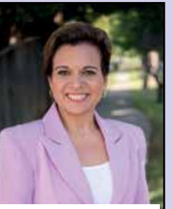
Michelle Rowland MP Minister for Communications