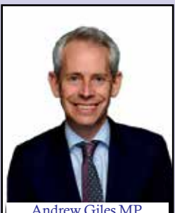
Andrew Giles MP Minister for Immigration, Citizenship and Multicultural Affairs