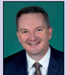
The Hon. Chris Bowen MP (Minister for Climate Change and Energy)