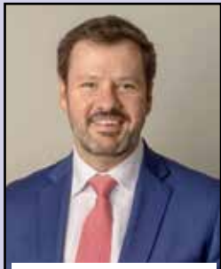
Ed Husic MP Minister for Industry and Science