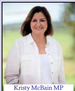
Kristy McBain MP Minister for Regional Development, Local Government and Territories