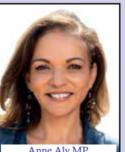
Anne Aly MP Minister for Early Childhood Education Minister for Youth