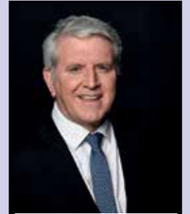
The Hon. Brendan O'Connor MP (Minister for Skills and Training)