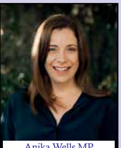
Anika Wells MP Minister for Aged Care Minister for Sport