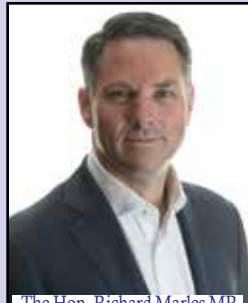
The Hon. Richard Marles MP (Deputy Prime Minister Minister for Defence)