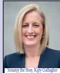
Senator the Hon. Katy Gallagher (Minister for Finance Minister for the Public Service Minister for Women)