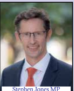
Stephen Jones MP Assistant Treasurer Minister for Financial Services