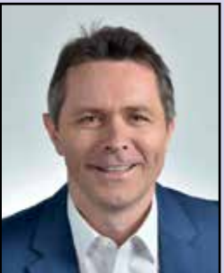
The Hon. Jason Clare MP Minister for Education