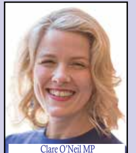
Clare O'Neil MP Minister for Home Affairs Minister for Cyber Security