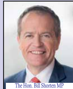
The Hon. Bill Shorten MP (Minister for the National Disability Insurance Scheme Minister for Government Services)