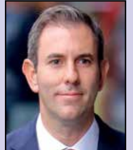
The Hon. Dr Jim Chalmers MP (Treasurer)