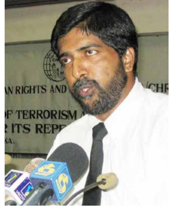
ஆனதும் அவர்கள் இவ்வலகத் தில் நிற்க மாட்டார்கள் மறைந்து விடுவார்கள்” ரவிராஜின் குரல் மௌனித்திருக்கலாம் ஆனால் அவரது தைரியமும் தியாகமும் மறக்கப்படப்போவதில்லை.