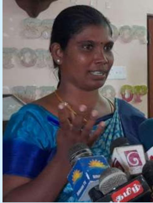
கடலட்டை பண்ணைகளுக்காக வடக்கு கடலின் ஆழம் குறைந்த பகுதிகளை சீனாவின் பிளாமி நிறுவனங்கள் ஆக்கிரமிக்குமானால், எதிர்கால சந்ததியினருக்கு மீன்களை கண்காட்சி நிகழ்வுகளில்தான் காட்ட முடியும் என மெசிடோ நிறுவனம்