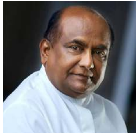
தேர்தல்கள் ஆணைக்குழுவிற்கு புதிதாக

தெரிவு செய்யப்பட்ட ஐந்து உறுப்பினர்கள் தொடர்பான அறிக்கை எதிர்வரும் சில தினங்களில் ஜனாதிபதி ரணில் விக்கிரமசிங்கவின் ஒப்புதலுக்காக அனுப்பி வைக்கப்படும் என சபாநாயகர் மஹிந்த யாப்பா அபேவர்தன தெரிவித்துள்ளார்.