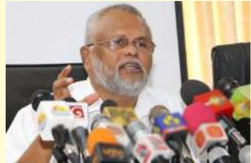
பல தடவை உங்கள் உயிருக்கு அச்சுறுத்தல் வந்த போதும் நீங்கள் செய்யும் மக்கள் சேவை தான் உங்களை காப்பாற்றியுள்ளதாக கிராம அலுவலர் ஒருவர் அமைச்சர் டக்ளஸ் முன்னிலையில் தெரிவித்தார்.

யாழ்ப்பாணம் மாவட்ட செயலகத்தில் இடம்பெற்ற மாவட்ட கிராம அலுவலர்களுக்கும் அமைச்சர் டக்ளஸ் தேவானந்தாவுக்கும் இடையிலான கலந்துரையாடலின் போதே இவ்வாறு கருத்து தெரிவிக்கப்பட்டது. அவர் மேலும் தெரிவிக்கையில், தமிழ் மக்களின் இக்கட்டான காலங்களில் பல சேவைகளை ஆற்றியுள்ளீர்கள் ஆதலால் தான் உயிர் அச்சுறுத்தல்கள் வந்த போதும் நீங்கள் காப்பாற்றப்பட்டுள்ளீர்கள். கிராம சபையாளர்கள் என்ற வகையிலே எங்களுக்கும் பல பிரச்சினைகள் உள்ளது அதனை நீங்கள் தீர்த்து வைக்க வேண்டும். அரசாங்கத்தில் இருந்து வரும் எந்த ஒரு கேள்விக்கும் பதிலளிக்க வேண்டிய அலுவலர்களாக கிராம சேவையாளர்கள் காணப்படும் நிலையில்