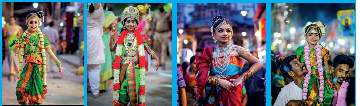
மதுரை மீனாட்சி அம்மன்கோவிலில் சித்திரைத் திருவிழாவின் போது தமது பிள்ளைகளை மீனாட்சி போன்று வேடம் புனைந்து பெற்றோர் ஆலயத்திற்கு அழைத்துவரும் காட்சி அதிஅற்புதமானது.