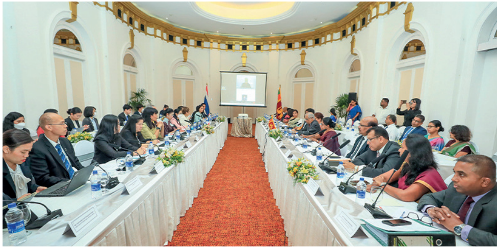
இலங்கைக்கும் தாய்லாந்துக்கும் இடையிலான

தேசிய ஓளடத ஒழுங்குபடுத்தல் அதிகார சபையில் பாரிய ஊழல் மோசடிகள் இடம்பெற்றுள்ளதாகவும், அதன் பணிப்பாளர் சபை பூர்த்தியற்று காணப்படுவதாகவும், அங்கு நிபுணர்களின் பற்றாக்குறை நிலவுவதாகவும் எதிர்க்கட்சித் தலைவர் சஜித் பிரேமதாஸ தெரிவித்தார். பிறப்பிக்கப்படும் பரிந்துரைகள் நடைமுறைப்படுத்தாமல், தலைவரும் பிரதம நினைவேற்று அதிகாரியும் மதிப்பீட்டுக் குழு மற்றும் நிபுணர் குழுக்களில் பங்கேற்பது போன்ற பல முறைகேடுகள் இடம்பெறுவதாகவும், இது குறித்து சம்பந்தப்பட்ட அமைச்சரும் செயலாளரும் உடனடி நடவடிக்கை எடுக்க வேண்டும் என்றும் குறிப்பிட்டார். தொடர்ச்சி P2