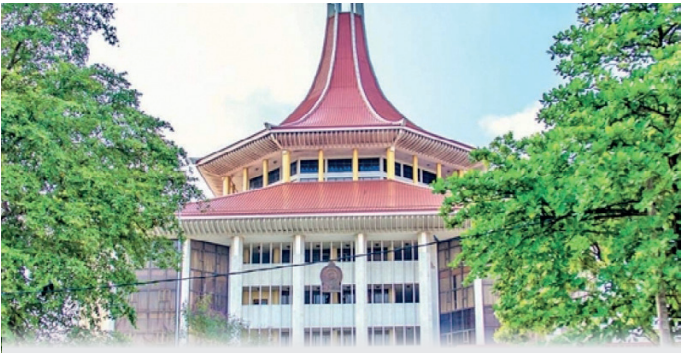
விசேட நிபுணர்களின் ஓய்வு வயதெல்லை