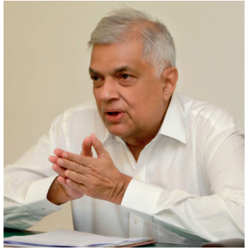
வெள்ளீக்கிழமை (30) வரை ஒத்திவைக்கப்பட்டுள்ளது. தொடர்ச்சி P2

ஜனாதிபதி ரணில் விக்கிரமசிங்கவுக்கும் ஆளும் கட்சியின் பாராளுமன்ற உறுப்பினர்களுக்கும் இடையில், இன்றையதினம் (28) பிற்பகல் 5 மணிக்கு ஜனாதிபதி செயலகத்தில் விசேட கூட்டம் இடம்பெறவுள்ளதாக அறிவிக்கப்பட்டுள்ளது. இதேவேளை, செவ்வாய்க்கிழமை (27) நடைபெறவிருந்த பாராளுமன்ற விவகாரங்களுக்கான குழுக் கூட்டம்