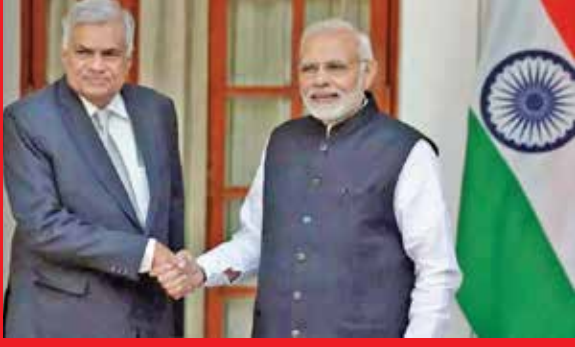
அடுத்த மாதம் இந்தியா செல்லவுள்ள ஜனாதிபதி ரணில் விக்கிரமசிங்கவிடமிருந்து மாகாண சபைத்

தேர்தல் நடத்தப்படும். என்ற வாக்குறுதியை அவரது விஜயத்துக்கு முன்னதாகவே இந்தியா எதிர்பார்க்கின்றது என்று அறியமுடிகின்றது.