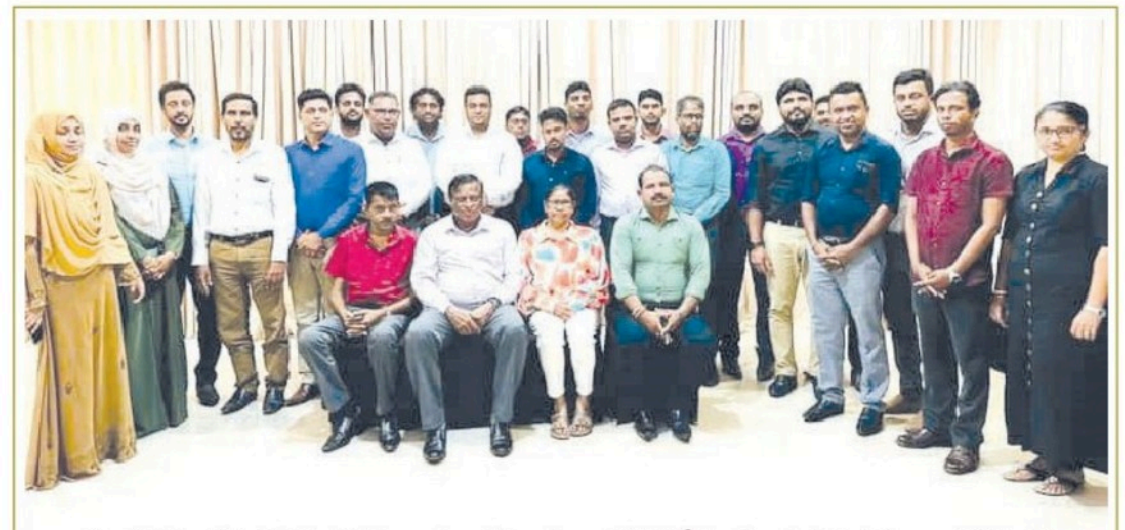
ஓய்வு பெற்றுச்செல்லும் அம்பாறை மாவட்ட அரச அதிபர் ஜே.எம்.ஏ.டக்ளஸ் கான பிரியாவிடை நிகழ்வு அண்மையில்(24) இடம்பெற்றது. அம்பாறை மாவட்டத்தில் கடமையாற்றும் பிரதேச செயலாளர்களினால் ஏற்பாடு செய்யப்பட்ட இந்நிகழ்வில் மேலதிக அரச அதிபர் வீ.ஜெகதீசன் நினைவுச்சின்னம் வழங்கி கௌரவிப்பதையும் கலந்து கொண்ட பிரதேச செயலாளர்கள் மற்றும் உதவிப் பிரதேச செயலாளர்களையும் காணலாம். (மாவட்டப்பள்ளி செய்தியாளர்)

மாத்திரமன்றி கல்விக்கற்ற சமூகத்தின் மத்தியிலும் பெரும் சோகத்தை ஏற்படுத்தியுள்ள நிலையில், இளம் பராயத்தினரின் திடீர் முடிவுகளால் ஏற்படும் உயிரிழப்பைக் கட்டுப்படுத்த வேண்டிய அவசியத்தையும் சமூகத்தின் மத்தியில் உணர்த்தி நிற்றுகின்றது. எது எவ்வாறாயினும், பெறுமதிமிக்க எதிர்காலத்தினர் இவ்வாறு தமது உயிரை மாய்க்கும் முன்னர் உங்கள் தாய், தந்தை, உறவுகளை ஒரு கணம் சிந்தித்துப் பாருங்கள். பெற்றோரும் கல்விச் சமூகத்தினரும் நம் சந்ததிகளுக்கு வெறுமனே கல்வியை மட்டும் புகட்டாது வெற்றி - தேரல்விகளை எதிர்கொள்ளும் மனநிலையையும் விதைத்து விடுங்கள். இல்லையெல், எமது சந்ததிகளின் வாழ்க்கை கேள்விக்குறியாக மாறிவிடும் என்பதில் எவ்வித ஐயமுமில்லை.