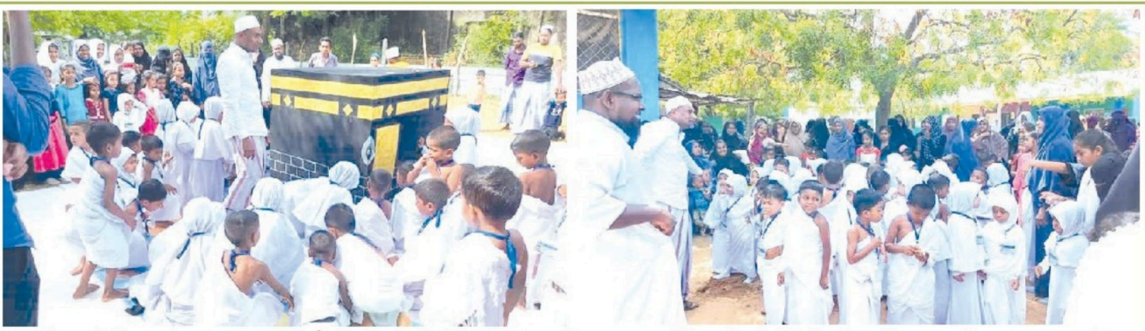
புனித ஹூட் பெருநாளை முன்னிட்டு தோப்பூர் ஜாமியில் ஹிக்கா பாலர் பாடசாலையில் முன்பள்ளிச் சிறார்களுக்கான ஹூட் கடமையை எவ்வாறு நிறைவேற்றுவதென்பது தொடர்பான அறிமுக நிகழ்வு குடியிருப்புக் கிழமை(25) பாலர் பாடசாலை ஆசிரியர்களின் வழிகாட்டலில் நடைபெற்றது. இதன்போது மாதிரி கஃபா உருவாக்கப்பட்டு முன்பள்ளி சிறார்கள் அதை வலம்வரும் முறை தொடர்பாக மாதிரி ஹூட் பயிற்றுவிக்கப்பட்டமை குறிப்பிடத்தக்கதாகும். இந்நிகழ்வில் உலமாக்கள், ஆசிரியர்கள், பெற்றோர்கள் கலந்து கொண்டனர். இந்நிகழ்வை ஏற்பாடு செய்த பாலர் பாடசாலை நிர்வாகத்துக்கும் ஆசிரியர்களுக்கும் பெற்றோர்கள் நன்றி தெரிவித்தனர். (தோப்பூர்)