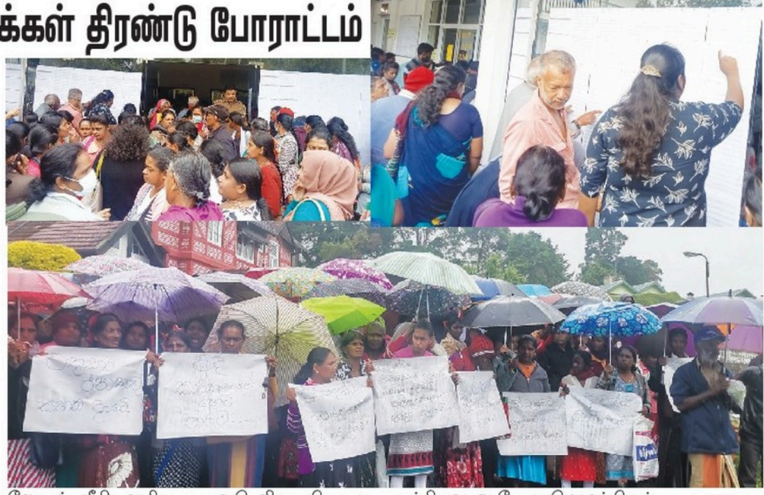
வோசன் வீதி வழியாக நுவரெலியா பிரதான தாலகம் வரை சென்றுபாலகத்துக்கு முன்னால் போராட்டத்தில் ஈடுபட்டனர். இதன்போது பல்வேறு வாசகங்கள் எழுதப்பட்ட கலோக அட்டைகளை ஆர்ப்பாட்டக்காரர்கள் ஏந்தியவாறு கோஷமெழுப்பினர். சுமார் இரண்டு மணித்தியாலம் வரை போராட்டத்தில் ஈடுபட்ட போராட்டக்காரர்கள் பின்னர் அங்கிருந்து கலைந்து சென்றமை குறிப்பிடத்தக்கது.