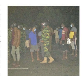
கைவிடுமாறு கோரினர். இரவு 11.50 மணிளவில் போராட்டம் வகைப்பட்டதையடுத்து இடம்பெற்ற சிபிஎன் முறையில் விளைவித்த இடம்பெற்ற என குறித்து இளைஞர்களின் தாய் மற்றும் உறவினர்களுக்கு வாகனத்து விசாரித்தனர். போராட்டத்தின் ஈடுபட்ட உறவினர்களை போராட்டத்தை

முடியாமல் போக சம்பவ இடத்துக்கு விசேட அதிரடிப் படையினர் வரவழைக்கப்பட்டனர். 99 வீதியை மறித்து போராடியவர்களை அகற்றிய விசேட அதிரடிப் படையினர் குழுவும் விளைவித்ததாக புவன கைது செய்து எச்சரிக்கையின் பின் அங்கீகரித்து வெளியேற்றினர். அத்துடன், நிலைமையை கட்டுப்படுத்த இராணுவத்தினரும் அவ்விடத்துக்கு பிரச்சனை மாகியிருந்தனர். மக்களது போராட்டத்தை கட்டுப்படுத்த பொலிஸார், விசேட அதிரடிப்படையினர், இராணுவத்தினர் இணைந்து நடவடிக்கை எடுத்ததையடுத்து அப்பகுதியில் பதற்றத்தை ஏற்பட்டதுடன், முறக்க நிலை தீவிரமடைந்தது.