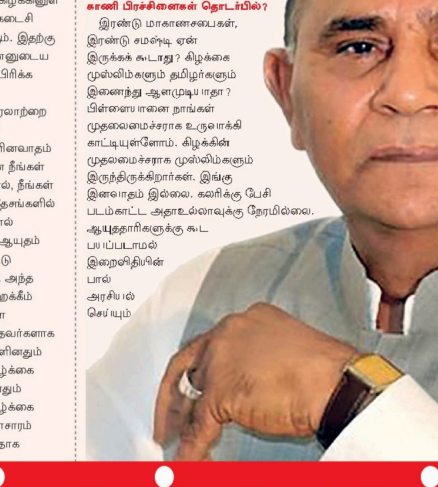
கேள்வி: மகாண சபை முறைமை, காணி பிரிவுகளை தொடர்பில்?

பாண. முல்விமம் பாண என்று வருகிறது. அப்படி ஒரு இயக்கத்தை அப்படி ஒருநிலையை இளைத்து பேசி உருவாக்குகிறார்கள்.