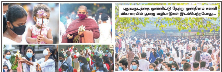
புதுவருடத்தை முன்னிட்டு நேற்று முன்தினம் களையில் புகழை வழிபாடுகள் இடம்பெற்றதுடன்...

வருடப் பயிற்சிக்காவல்தை நிறைவு செய்து 42 ஆயிரத்து 500 பேர்களுக்கு இன்று முதல் நிரந்தர நியமனம் வழங்கப்படும். அதன் தடவல் கடந்த வருடம் பெற்றவரி மற்றும் மாநகங்களில் பயிலுனர் பட்டதாரிகளாக வேலையில் இணைத்துக் கொள்ளப்பட்டவர்களுக்கு எதிர்வரும் வரம் மாத்திரம் நிரந்தர நியமனம் வழங்கப்படும்.