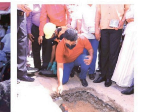
சுவர்களையும் வெற்றி கொள்ளும் வரும்பாக்க கூடுதல் வாய்க்காலை வெல்லும் நடவடிக்கை எடுக்க வேண்டும். இதன் அபிவிருத்திக்கு அதிபர்களின் உதவியோடு, தேவையான போது வேலை மேற்கொள்ளும்.