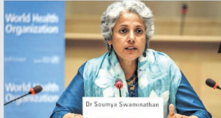
உடம்பை பின்னுக்கு தள்ளி ஒய்க்மென் தொற்று வேகமாக பரவி வருகிறது என்று நோய் எதிர்ப்புக்கான தேசிய தொற்றுப்போட்டி ஆயோசனை குழு தெரிவித்துள்ளது. ஜனவரி கடைசி வாரத்திலும் பெப்ரவரி முதல் வாரத்திலும் கொரோனா 3ஆவது அலை உச்சத்திற்குக்கும் என்று இந்த குழு கணித்துள்ளது.

இந்தியாவில் அடுத்த 2 வாரங்களில் கொரோனா 3ஆம் அலை உச்சத்தை எட்டும் என்று மருத்துவ நிபுணர்கள் எச்சரிக்கை விடுத்துள்ளனர். கடந்த ஒரு வார காலமாக இந்தியா முழுவதும் குறிப்பாக டில்லி, மும்பை, கொல்கத்தா போன்ற நகரங்களில் கொரோனா தொற்று வேகமாக பரவி வருகிறது. நினைவு மிகவும் இயற்கையாக இருப்பதால் அடுத்த 2 வாரங்களில் இந்தியாவிலுள்ள மருத்துவமனைகள் நிரம்பி வழியும் என்று உலக சுகாதார அமைப்பின் மூத்த விஞ்ஞானி சௌமியா சுவாமிநாதன் தெரிவித்துள்ளார். கொரோனா 2ஆம் அலையின் போது, இந்த மருத்துவ சிகிச்சை பற்றாக்குறை இந்த மூன்று இரத்தளை என தெரிவித்துள்ளதுடன் இந்திய மருத்துவமனைகள் தற்போது தயாராகவே இருப்பதாகவும் அவர் குறிப்பிட்டுள்ளார்.