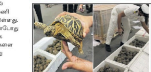
சென்னை விமான நிலையத்தில் கடல் நண்டு என்று கூறி மலேயியாவிற்கு ஆகாத கங்கு ஆகிவிட்டது. 1,364 நட்சத்திர ஆகாத கங்கு ஆகிவிட்டது பற்றி முதல் செய்தியைப்போடும்...