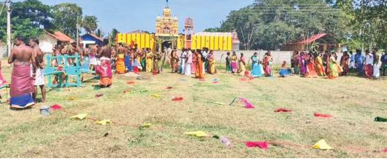
முந்தல் ஸ்ரீதிரௌபதியம்மன் ஆலயத்தின் வருடாந்த மஹோற்சவத்தில் வியாழக்கிழமை (30)வளவீக்கொடிவேற்ற நிகழ்வு இடம்பெற்றது. இதன் போது பலர் கலந்து கொண்டனர்.