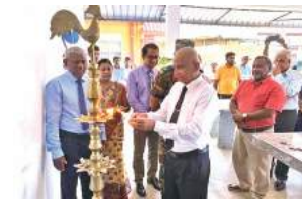
உணவுகளை வழங்கும் நோக்கில் இவ்வணவகம் ஏற்படுத்தப்பட்டுள்ளது. உணவு செய்கை முறை தொடர்பில்

வைத்தியசாலைக்கு வரும் பொது மக்களுக்கு தரமான, தாய்மையான