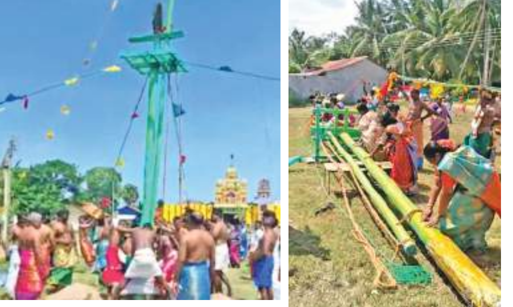
முந்தல் ஸ்ரீதிரௌபதியம்மன் ஆலயத்தின் வருடாந்த மஹோற்சவத்தில் வியாழக்கிழமை (30)வளவீக்கொடிவேற்ற நிகழ்வு இடம்பெற்றது. இதன் போது பலர் கலந்து கொண்டனர்.