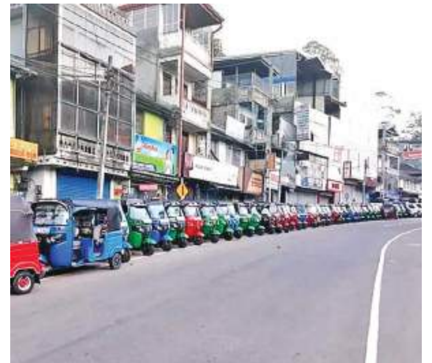
தலவாக்கலை நகரிலுள்ள ஐசி எரிபொருள் நிலையத்திற்கு மிக நீண்ட நாட்களின் பின்னர் நேற்று (1) பெற்றோல் வந்ததையடுத்து அதனை பெற்றுக்கொள்வதற்காக முச்சக்கர வண்டிகள் மற்றும் மோட்டார் சைக்கிள்கள் வரிசையில் நின்றன. இதன்போது காலையில் இருந்து வரிசையில் நின்றவர்களுக்கு பிரதேச மக்களால் தேர்தல் வழங்கப்பட்டது. (தலவாக்கலை குறும்பு நிருபர்)