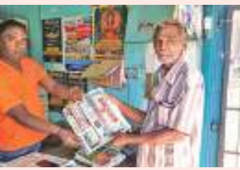
ரிவு, கொழும்பிலிருந்து தனியார் வாகனத்தில் அனுப்பமுடியாதவிடத்து இலங்கை போக்குவரத்து பஸ் மூலம் பத்திரிகைகளை அனுப்புவார்கள் எனத் தெரிவித்துள்ளதாகவும் வாசகர்கள் ஏமாற்றத்தேவையில்லை எனவும் அவர் தெரிவித்தார். நூலகங்கள் மற்றும் வழமையான வாடிக்கையாளர்களுக்கு பத்திரிகைகளை அவர்களின் இடத்திற்கே விநியோகிக்கதாகத் அவர் மேலும் தெரிவித்தார்.