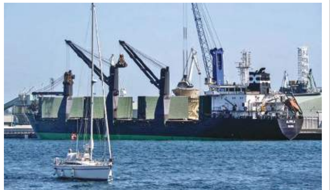
ஏற்றுமதிகளில் அதிகம் தங்கி உள்ள ஆபிரிக்க பிராந்தியம் அதிக நெருக்கடிக்கு உள்ளாக உள்ளது.

இந்த சூழலில் பாதிக்கப்படக்கூடிய நாடுகளில் பஞ்சம் ஏற்படக் கூடிய சாத்தியம் பற்றி எச்சரிக்கைகள் விடுக்கப்பட்டுள்ளன. குறிப்பாக உக்ரைனிய