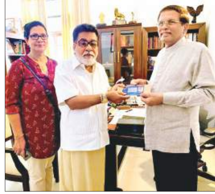
முன்னாள் பிரதி அமைச்சர் மேர்வீன் சில்வா ஸ்ரீலங்கா சுதந்திரக்கட்சியில் இணைந்து கொண்டார். கட்சி தலைமையகத்தில் முன்னாள் ஜனாதிபதியும் கட்சியின் தலைவருமான மைத்திரிபால சிறிசேனவிடமிருந்து கட்சியின் உறுப்பினர் அட்டையை பெற்றுக்கொண்டபோது பிடிக்கப்பட்ட படம்.