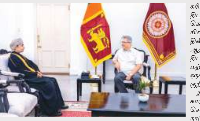
ஓமானின் தற்போது சுமார் 25,000 இலங்கையர் பணிபுரிகின்றனர். பயிற்சித் துறையில் தொழில் வாய்ப்புகளை அதிகரித்து ஜனாதிபதியிடம்