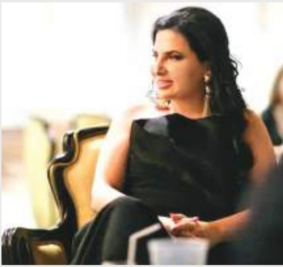
பித்த 2017 ஆம் ஆண்டு தொடக்கம் அவர் காணாமல் போயுள்ளார். கிரிப்டோ கரன்சி என்று அழைத்துக் கொண்ட வன்ஹோயின்,

தனது 40 வயதுகளில் இருக்கும் பக்கேரியாவைச் சேர்ந்த அவர் 'வைன்ஹோயின்' என்று அழைக்கப்படும் கிரிப்டோ நாணய மோசடியில் ஈடுபட்டவர் என தேடப்பட்டு வருகிறார். இவர் பாதிக்கப்பட்டவர்களிடம் இருந்து 4 பில்லியன் டொலருக்கு மேல் மோசடி செய்த தலைமறைவாக இருப்பதாக எப்.பி.ஐ தெரிவித்துள்ளது. அமெரிக்கா பிடியாணை பிறப்பித்த 2017 ஆம் ஆண்டு தொடக்கம் அவர் காணாமல் போயுள்ளார். கிரிப்டோ கரன்சி என்று அழைத்துக் கொண்ட வன்ஹோயின்,