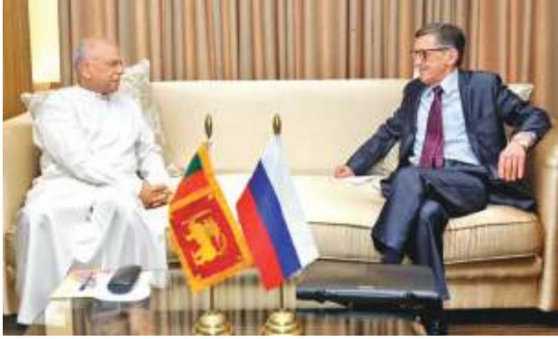
இலங்கைக்கான ரஷ்ய தூதுவர் யூரி பீ மெட்ரி அண்மையில் பொதுநிர்வாக அமைச்சர் தினேஷ் குணவர்தனவை அமைச்சில் வைத்து சந்தித்தார். இதன்போது தற்போதைய நாட்டு நிலை மற்றும் இருதரப்பு உறவு குறித்து முக்கியமாக ஆராயப்பட்டுள்ளது.