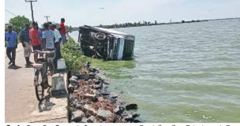
பெரியபோர்திவு தினகரன் நிபுனர்

மட்டக்களப்பு வவுண்திவு வலையிறப்புப் பாலத்திற்குள், கரைகரையிலே ஒன்று வீதியை விட்டு விலகிய ஆற்றில் வீழ்ந்தது. இச்சம்பவம் அண்மையில் இடம்பெற்றுள்ளது. இவ்வீதியால் இரண்டு லொறிகள் சென்ற சமயம், ஒரு லொறியை மற்ற லொறி முந்திச் செல்ல முற்பட்டது.