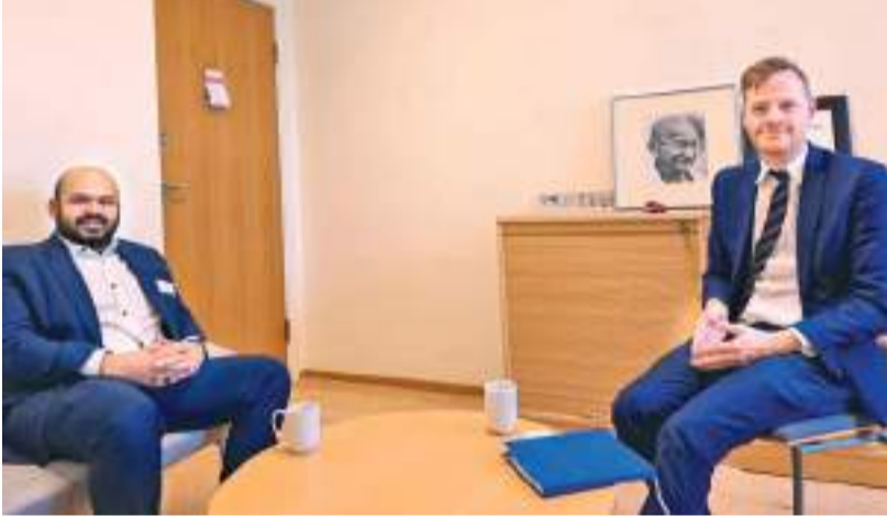
பெரியபோர்திவு தினகரன் நிபுனர்

நாட்டின் தற்போதைய பொருளாதார நெருக்கடி குறித்து நேர்வே வெளிவிவகார அமைச்சின் தெற்காசியாவிற்கான பிரதிப் பணிப்பாளரைச் சந்தித்து, பாராளுமன்ற உறுப்பினர் பேச்சுவார்த்தை நடத்தியுள்ளார். இரா. சாணக்கியன் எம்