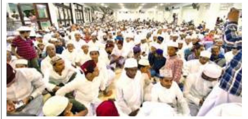
பேருவளை விசேட நிருபர்

சீனக்கோட்டை ஜாமிஅதுல் பாஸிய்யா கலாபீட தலைப்பாகை சூடும் நிகழ்வு அண்மையில் சீனக்கோட்டை பாஸிய்யா பெரிய பள்ளி வாசலில் இடம்பெற்ற 131ஆவது வருட மனாகிபுஷ் ஷாதுலி தமாம் மஜ்லிஸில் நடைபெற்றது.