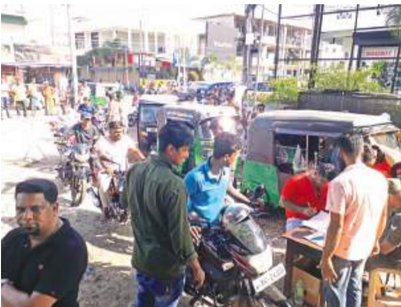
அக்கரைப்பற்று ஹாசீம் (ஐஓசி) எரிபொருள் நிறப்பு நிலையத்தில் நேற்று (04) பொது மக்களுக்கு பெற்றோல் வழங்கப்பட்டது. வரிசையில் காத்திருந்த மக்கள் பெற்றோலைப் பெற்றுக் கொண்டனர்.