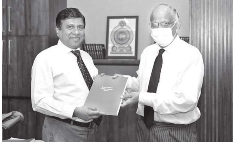
புதிய அரசியலமைப்பை தயாரிப்பதற்காக நியமிக்கப்பட்ட குழுவின் தலைவரான ஜனாதிபதி சட்டத்தரணி ரொமேஷ் டி சில்வா, புதிய அரசியலமைப்பு வரைபை நீதி, சிறை, மற்றும் அரசியலமைப்பு மறுசீரமைப்பு அமைச்சர் ஜனாதிபதி சட்டத்தரணி விஜயதாச ராஜபக்சவீடில் கையளிப்பதை காணலாம்.

நாடு எதிர்கொண்டிருக்கிற பிரச்சனைகளுக்கு தீர்வுகாண தேசிய அரசாங்கம் அமைக்கப்படவேண்டும் என்பதை நாம் தொடர்ச்சியாக தெரிவித்து வருகின்றோம். தற்போது மஹாநாயக்க தேரர்கள் ஒன்றிணைந்து ஜனாதிபதிக்கு கடிதம் ஒன்றை அனுப்பியுள்ளனர். அதில் நாடு எதிர்கொண்டிருக்கிற பிரச்சனைகளுக்கு தீர்வுகாண அனைவரும் இணைந்து தேசிய அரசாங்கம் அமைக்க நடவடிக்கை எடுக்க வேண்டும் என கோரியுள்ளனர். மஹாநாயக்க தேரர்கள் தெரிவித்துள்ளதன்படி தேசிய அரசாங்கம் ஒன்றை அமைக்க நாம் தயார். அரசாங்கம் அது தொடர்பில் நடவடிக்கை எடுக்கவேண்டும் என்றும் தெரிவித்தார். 06