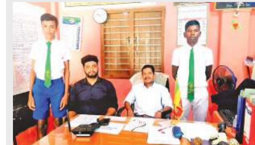
மன்னார் குரூப் நிருபர்

மன்னார் மாவட்டத்தின் கீழ் உள்ள பாடசாலைகளுக்கான 2022 ஆம் ஆண்டுக்கான வலய மட்ட மெய்வல்லுநர் திறனாய்வுப் போட்டி மன்/முருங்கன் மத்திய கல்லூரி மைதானத்தில் இடம்பெற்ற நிலையில் மன்/உயிர்த்தராசன் குளம், நோ.க.த.க.பாடசாலை மாணவர்கள் இருவர் இரண்டாம் இடத்தை பெற்று மாகாண மெய்வல்லுநர் போட்டிக்கு தெரிவாகியுள்ளனர்.