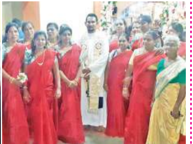
கொழும்பு வொல்ஹென்கொட திரு இருதயநாதர் ஆலயத்தின் திருவிழா கடந்த ஞாயிறு தினத்தில் விமரிசையாக நடைபெற்றது. ஆலயத்தின் கொடியேற்றம் நடைபெற்று நவநாட்களுடன் வெஸ்பர்ஸ் ஆராதனைக் கூந்த சனிக்கிழமை இடம்பெற்றது. அதனைத் தொடர்ந்து ஞாயிற்றுக்கிழமை காலை திருவிழா திருப்பலி அருட்தந்தை பிரகீத் டிடிஎன் தலைமையில் நடைபெற்றதுடன் அன்றைய தினம் மாலை திரு இருதய ஆன் டவரின் திருச்சுருப பவனியும் நடைபெற்றது. இறுதி வழிபாடு மற்றும் இறுதி ஆசீர்வாத நிகழ்வுகளைப் படங்களில் காணலாம்.

கத்தோலிக்கத் திருச்சபை திருத்தாதர் புனித தோமாவின் திருநாளை நாம் கடந்த ஞாயிறு தினத்தில் கொண்டாடியது.