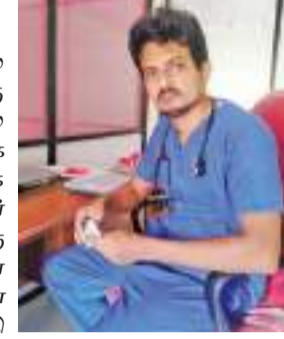
எரிபொருளின்மையால் நோயாளர்கள் ஆஸ்பத்திரிக்கு செல்ல முடியாத காரணத்தால் வீட்டிலிருக்கும் நோயாளர்களுக்கு தொலைபேசி/வாட்ஸ்அப்/இமோ மொரவெல பிரதேச செயலாளர் பிரிவுக்குட்பட்ட மஹிஷ்வலிவெல பகுதியில் பதிவாகியுள்ளது.

ரொட்டவெல குறாப் நிருபர் அப்துல்சலாம் யாசிம்