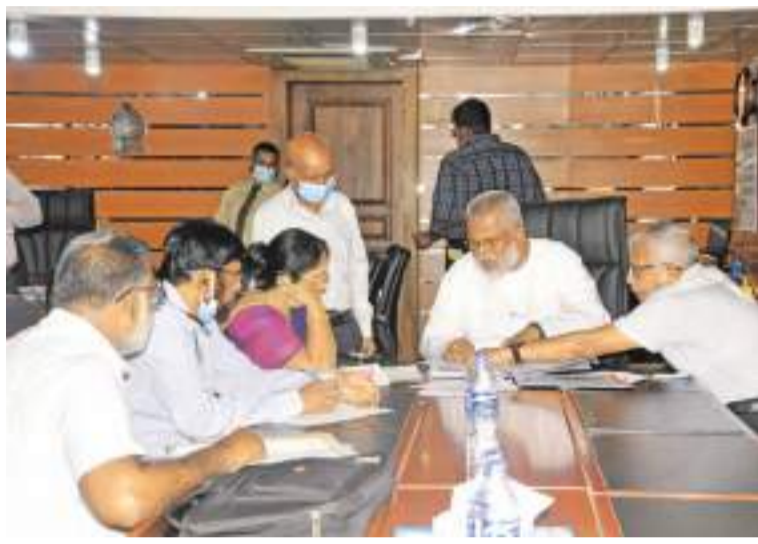
மற்றும் ஒருநாள் மீன்பிடிப் படகுகளை செயற்படுத்துவதற்கு மேற்கொள்ள வேண்டிய சகல நடவடிக்கைகளுக்கும் பலநாள் ஆழ்க் கடல் மீன்பிடி கலன்களின் உரிமையாளர்கள் விருப்பம் தெரிவித்துள்ளனர்.

ஒலுவில் மீன்பிடித் துறைமுகத்தின் செயற்பாடுகளை ஆரம்பிப்பதற்கு அமைச்சர் டக்ளஸ் தேவானந்தாவினால் மேற்கொள்ளப்பட்டிருக்கின்ற கடுமையான முயற்சிகளை வரவேற்றுள்ள ஒலுவில் பிரதேச பலநாள் ஆழ்க் கடல் மீன்பிடிக்க கலன்களின் உரிமையாளர்கள், ஒலுவில் துறைமுகத்தின் செயற்பாடுகளை விரைவுபடுத்துவதற்கான பூரண ஒத்துழைப்புக்களை வழங்கத்தயாராக இருப்பதாகவும் தெரிவித்துள்ளனர். மாவளிகாவத்தையில் அமைந்துள்ள கடற்கொழில் அமைச்சின் நேற்று (06) நடைபெற்ற கலந்துரையாடலின்போதே மேற்குறிப்பிட்டவாறு இவர்கள் தெரிவித்தனர். ஒலுவில் துறைமுகத்தை பலநாள் ஆழ்க் கடல், கலன்கள்