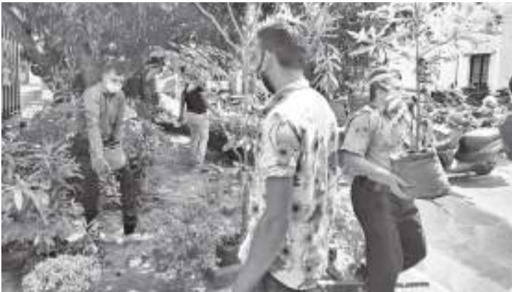
( திறப்பணை தினகரன் நிருபர் )