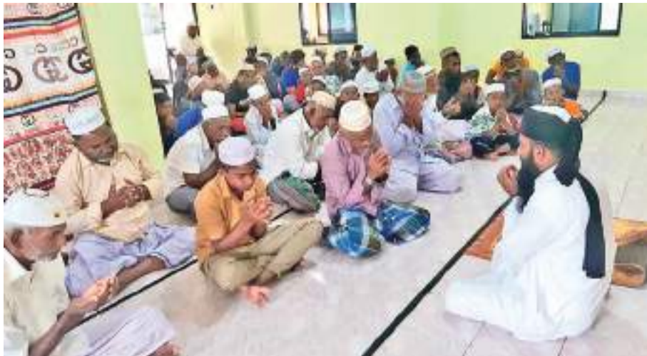
உட்பு பள்ளிவாசலில் ஹஜ்ஜப் பெருநாள் விஷேட தொழுகைகள் இடம்பெற்றபோது...