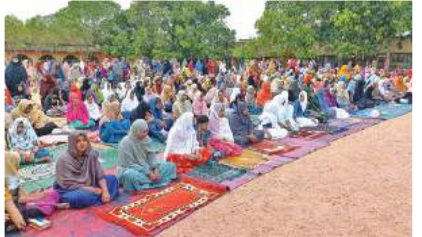
கிண்ணியா மத்திய கல்லூரி மைதானத்தில் பெருநாள் தொழுகையும் விசேட துஆ பிரார்த்தனையும் இடம்பெற்றது.