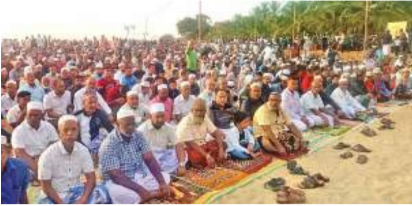
காத்தான்குடியில் ஹஜ் பெருநாள் திடல் தொழுகை நேற்று (10) ஞாயிற்றுக்கிழமை காலை காத்தான்குடி கடற்கரையில் இடம்பெற்றது.