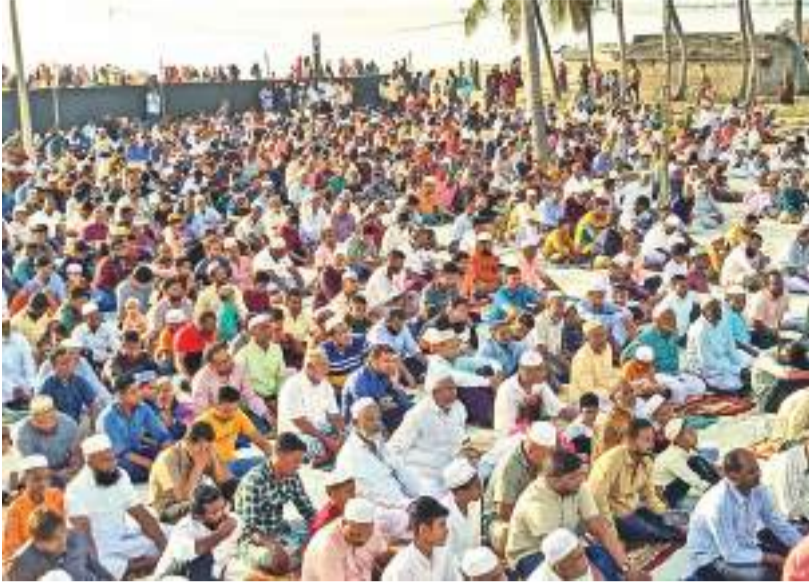
கல்முனை முஹம்மதிய்யா ஜம்ஆ பள்ளிவாசல் மற்றும் ஹதா ஜம்ஆ பள்ளிவாசல் இணைந்து ஏற்பாடு செய்திருந்த புனித ஹஜ்ஜாப் பெருநாள் தொழுகை கல்முனை கடற்கரை வீதியில் உள்ள ஹதா திவிலி நேற்று (10) இடம்பெற்றது.