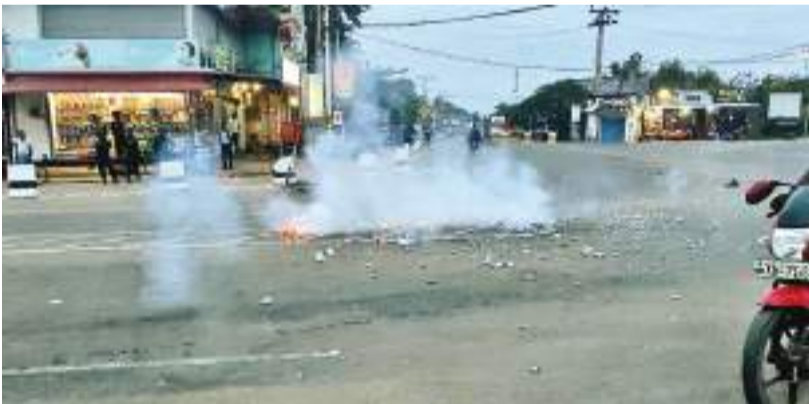
ஜனாதிபதி மாளிகைக்கு திரண்ட மக்களின் போராட்ட வெற்றிக்கு முல்லைத்தீவு மக்கள் நேற்று ஆதரவு தெரிவித்து வலு கொடுத்தனர்.