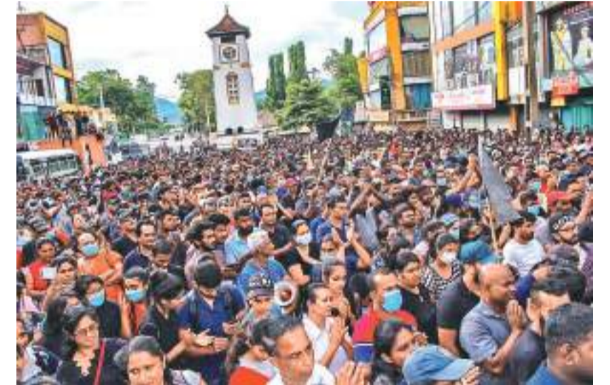
ஜனாதிபதியையும் அரசாங்கத்தையும் வெளியேற்றாது கோரி நாடு முழுவதும் மக்கள் ஜூலை 9ஆம் திகதி போராட்டங்களை ஏற்படுத்தியதுடன் பதுனை மாவட்டத்தின் பதுனை, பண்டாரவளை, ஹாலிலை பிரதேச மக்களும் அந்தப் போராட்டங்களில் இணைந்து கொண்டனர். (ஹாலிலை விசேட நிருபர்)