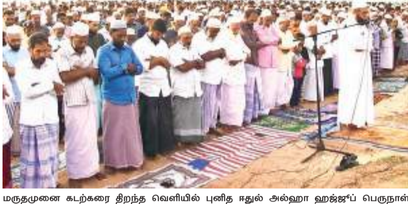
மருதமுனை கடற்கரை திறந்த வெளியில் புனித ஈதல் அல்ஹா ஹஜ்ஜாப் பெருநாள் தொழுகை நேற்று (10) காலை நடைபெற்றது.