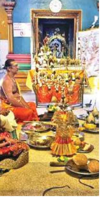
வரலாற்றுச் சிறப்புமிக்க சிலாபம், மானாவாரியில் அமைந்துள்ள ஸ்ரீஇராஜ ராஜேஸ்வரி அம்பாள் ஆலயத்தின் வருடாந்த மஹோற்சவத்தில், கொடியேற்றத்துடன் திருவிழா திங்கட்கிழமை (4) இடம்பெற்ற போது பிடிக்கப்பட்ட படங்களாகும்.