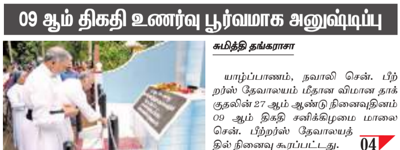
யாழ்ப்பாணம், நவாலி சென். பிறநர்ஸ் தேவாலயம் மீதான விமான தாக்குதலின் 27 ஆம் ஆண்டு நினைவுதினம் 09 ஆம் திகதி சனிக்கிழமை மாலை சென். பிறநர்ஸ் தேவாலயத்தில் நினைவு கூரப்பட்டது. 04

09 ஆம் திகதி உணர்வு பூர்வமாக அனுஷ்டிப்பு