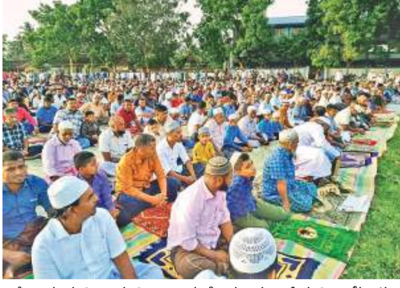
புனித ஹஜ்ஜாப் பெருநாள் தொழுகையும் பிரசாங்கமும் ஜாமிஉத் தெளவீத் ஜம்ஆ பள்ளிவாசலின் ஏற்பாட்டில் அஷ்ஷெய்க் எம்.எச்.றியால் காவிபி தலைமையில் நின்றவூர் அல்அஹ்ரக் தேசிய பாடசாலை மைதானத்தில் நடைபெற்ற போது பிடிக்கப்பட்ட படம்.