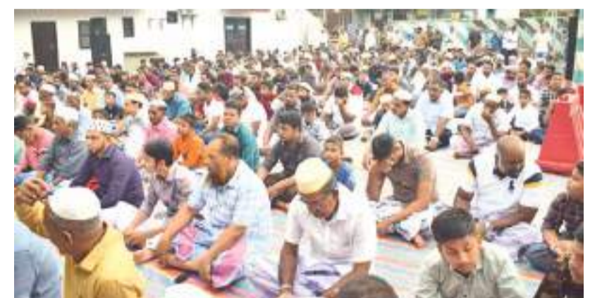
புனித ஹஜ்ஜப் பெருநாள் திறந்த வெளியினை தொழுகை மட்டக்களப்பு மாவட்டத்தின் ஓட்டமாவடி மன்னு ஸல்வா வளாகத்தில் ஞாயிற்றுக்கிழமை நடைபெற்றது.