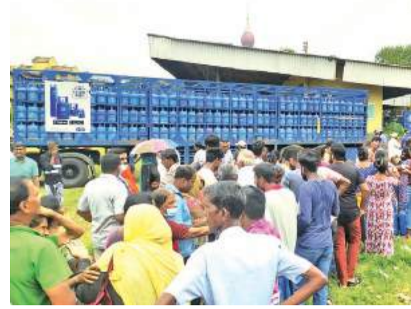
சுமார் 3 மாத காலத்திற்குப் பின்னர் நேற்று கொழும்பு, குணசிங்கபுர பகுதிவாழ் மக்களுக்கு குணசிங்கபுர விளையாட்டு மைதானத்தில் விற்பனை வரலாறு விநியோகிக்கப்பட்டுவது பிடிக்கப்பட்ட படம்.

டாபய ராஜபக்ஷ பதவியை இராஜினாமா செய்தபின் புதிய ஜனாதிபதியொருவரை நியமிப்பது மற்றும் எதிர்கால நடவடிக்கைகள் தொடர்பில் பேசுவதற்கு