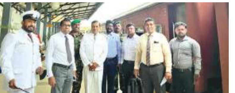
யாழ்ப்பாணத்துக் காவலகத்தில் குறுப் நிருபர்

அரசு பணியாளர்கள் மற்றும் அறிவியல் நகர் யாழ். பல்கலைக்கழக விரிவுரையாளர்கள், பணியாளர்களுக்கு வசதியாக இச்சே