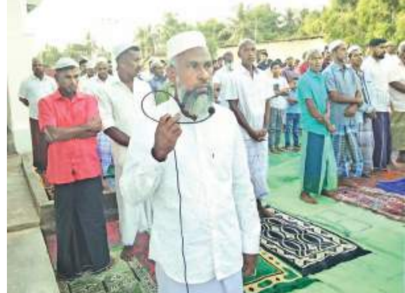
பாலமுனையில் நடைபெற்ற ஹஜ்ஜப்பெருநாள் தொழுகை நிகழ்வு.

குண்டை மீட்டதுடன் ஆரம்பக் கட்ட விசாரணைகளையும் மேற்கொண்டனர். இது தொடர்பாக விசாரணைகளை மேற்கொண்டுவருவதாக காத்தான்குடி பொலிசார் தெரிவித்தனர்.