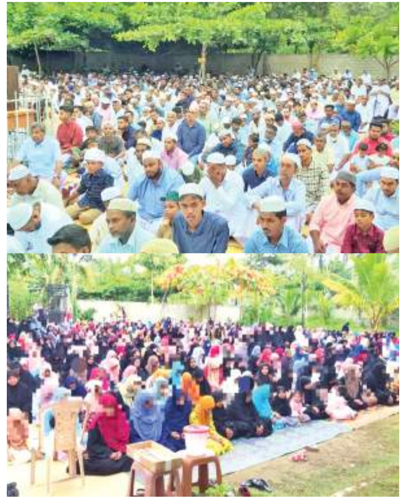
பேருவளை ரியானூஸ்ஸாலிவீன் பள்ளிவாசலில் நேற்று முன்தினம் ஞாயிற்றுக்கிழமை நடைபெற்ற ஹஜ் பேருநள் தொழுகையில், கலந்து கொண்டோரில் ஒரு பகுதியினரை படங்களில் காணலாம்.

இத்தொழில் மூலம் 10,000 குடும்பங்கள் நன்மையடைகின்றன. ஆனால் நாட்டில் நிலவும் பொருளாதார நெருக்கடியால், கூலி கொடுக்க முடியாமல் முதலாளிமார்கள் கடும் நிதி நெருக்கடியில் உள்ளதாகவும் கூறப்படுகிறது. இம்முறை சிறிதளவு அறுவடை செய்யப்பட்ட உப்பை ஏற்றிச் செல்வதற்கு லொறிகளுக்குத் தேவையான மசலும் கிடைக்கவில்லை. இதனால், உப்பை சந்தைக்கு கொண்டு செல்வதில் பல சிக்கல்களை எதிர்நோக்கியுள்ளதாகவும் இவர்கள் கூறுகின்றனர்.