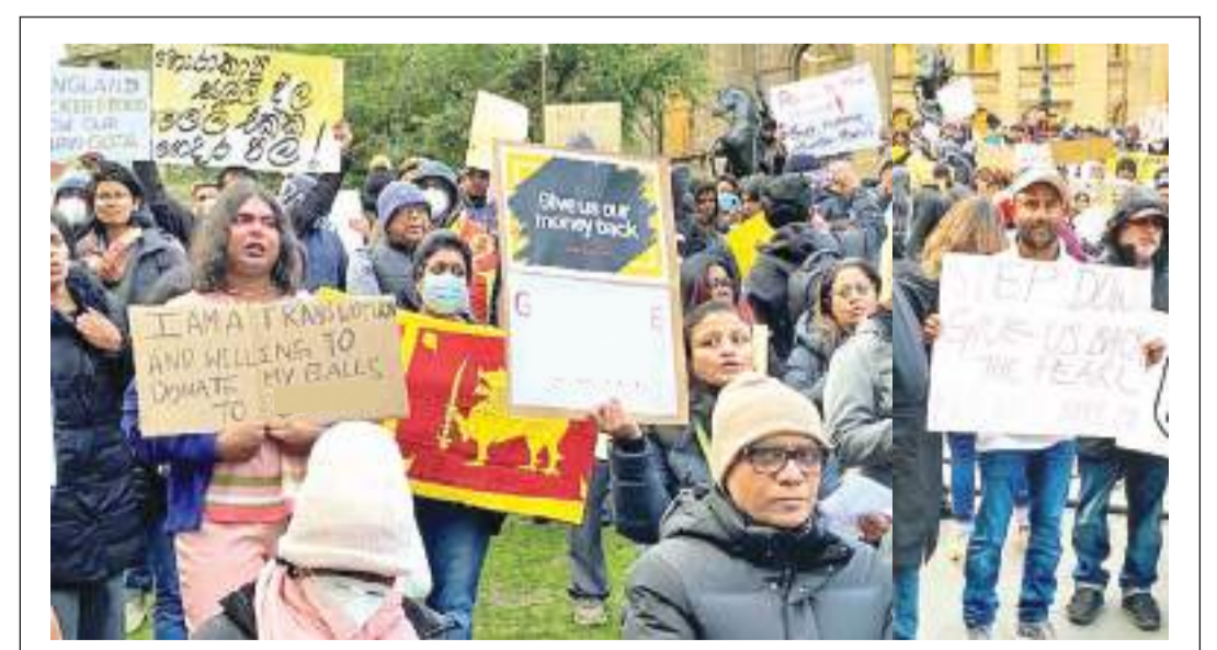
அவுஸ்திரேலியாவிலுள்ள இலங்கை சொலிடாரிட்டி அமைப்பினர் அண்மையில் (09) நாட்டின் பொருளாதார நெருக்கடிக்கு தீர்வு கோரியும், உறுதியான அரசியல் ஸ்திரீத்தை ஏற்படுத்துமாறும் ஆர்ப்பாட்டத்தில் ஈடுபட்டனர். அவுஸ்திரேலியாவின் ஸ்டேட் நூலை முன்னிலில் முன்னெடுக்கப்பட்ட இந்த ஆர்ப்பாட்டத்தில் கலந்துகொண்டோரில் ஒரு பகுதியினரை படத்தில் காணலாம்.