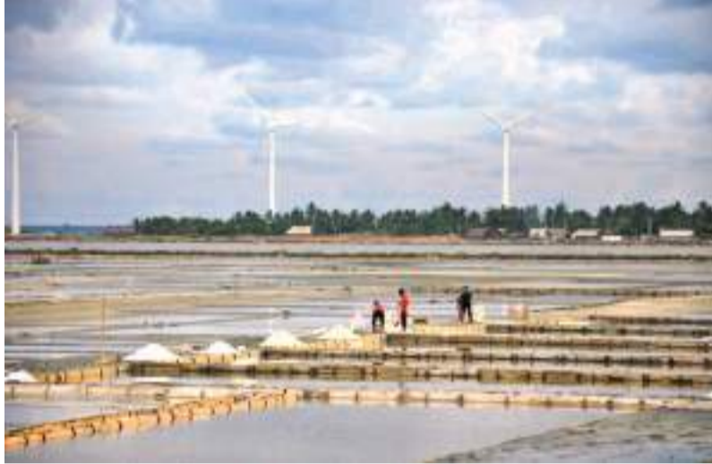
பெரும் நஷ்டத்தை எதிர்நோக்கியுள்ளதாகவும் தொழில்துறையினர் கூறுகின்றனர். இங்கு உற்பத்தி செய்யப்படும்

ஆனால், நாட்டில் ஏற்பட்டுள்ள கடுமையான எரிபொருள் நெருக்கடியால் நீர்ப்பம்பிகளை இயக்குவதற்கு எரிபொருள் இல்லாதுள்ளது. இதனால், தொழிற்சாலைகள்