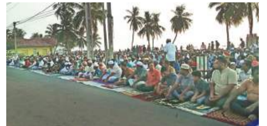
'ஈதுல் அஹு' ஹஜ்ஜப் பெருநாள் நபிவழி திடல் தொழுகை சாய்ந்தமருது 12 கடற்கரைத் திடலில் ஞாயிற்றுக்கிழமை காலை நடைபெற்றது.