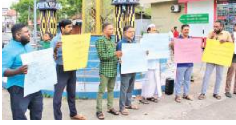
இல்லத்தின் முன் தாக்கப்பட்ட நியூஸ் பெஸ்ட் ஊடகவியலாளர்களுக்கு நீதி வேண்டும், 'ஊடகத்தையும் உணர்வுகளையும் ஒடுக்க நினைக்காதே',

கடந்த 9ம் திகதி பிரதமர் ரணில் விக்கிரமசிங்கவின் வீட்டிற்கு முன்பாக ஊடகவியலாளர்கள் தாக்கப்பட்டமையை கண்டித்து காத்தான்குடியில் ஆர்ப்பாட்டமென்று முன்னெடுக்கப்பட்டுள்ளது. மட்டக்களப்பு மாவட்ட முஸ்லிம் ஊடகவியலாளர்களின் ஏற்பாட்டில் நேற்று முன்தினம் மாலை காத்தான்குடி குட்வின் சதுக்கத்தில் இடம்பெற்றது. 'வேண்டும் வேண்டும் சுதந்திரம் வேண்டும்', 'ஊடக சுதந்திரத்தை பறிக்காதே', 'அடிக்காதே அடிக்காதே ஊடகத்திற்கு அடிக்காதே', 'பிரதமர்