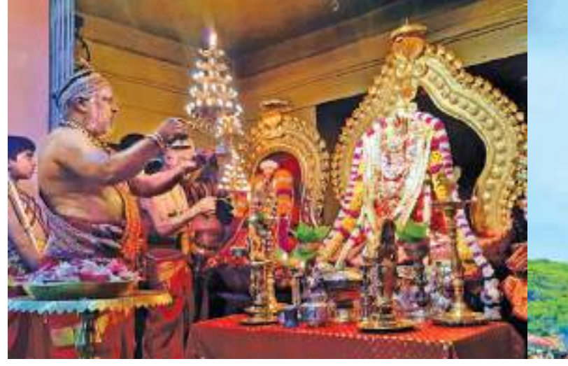
வரலாற்று சிறப்பு மிக்க நயினாதிவ நாக பூசணி அம்மன் ஆலய வருடாந்திர தேர்த்திருவிழா நேற்றைய தினம் செவ்வாய்க்கிழமை காலை இடம்பெற்றது.

துள்ளனர். அதேவேளையில் நாட்டில் தற்போது ஏற்பட்டுள்ள பொருளாதார நெருக்கடி, அசாதாரண நிலைமை காரணமாக பல, புகையிரதம் உள்ளிட்ட இடங்களில் ஏற்படுகின்ற நெரிசல் நிலைமையால் கொரோனா நோயும் தீவிரமடையக்கூடிய அபாய நிலை காணப்படுவதாக அதிகாரிகள் சுட்டிக்காட்டுகின்றனர். அத்துடன் வைத்திய சாலைகள், மருந்தகங்களில் பல மருந்துகளுக்கு தட்டுப்பாடு நிலவுவதுடன் அவர்களுக்கு தொற்று உறுதிப்படுத்தப்பட்டுள்ளதாக அவர்கள் தெரிவிக்கின்றனர். இவர்களை அவரவர் வீடுகளில் தனிமைப்படுத்த நடவடிக்கை எடுத்திருப்பதாக சுகாதார அதிகாரிகள் தெரிவித்த