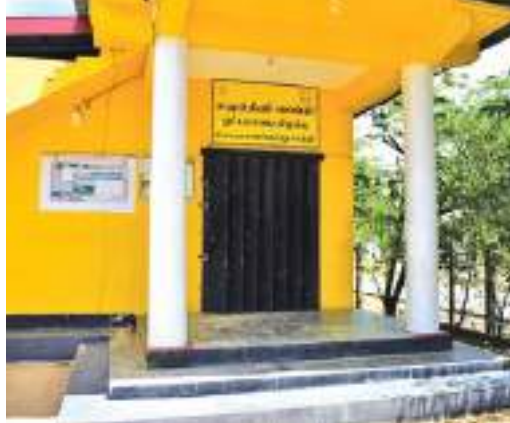
அந்த வகையில் வாழைச்சேனை, ஓட்டமாவடி, கோறளைப்பற்று மத்திய ஆகிய செயலகத்திற்குட்பட்ட சமுர்த்தி திணைக்கள சமுர்த்தி அபிவிருத்தி உத்தியோகத்தர்கள் இரண்டாவது நாளாகவும் கடமைக்கு சமூகம் வழங்காத நிலையில் சமுர்த்தி வங்கிகள், சமுர்த்தி மகா சங்கத்தின் கிளைகள் என்பன மூடிக் காணப்படுகின்றது.

மட்டக்களப்பு மாவட்டத்திலுள்ள வாழைச்சேனை, ஓட்டமாவடி, கோறளைப்பற்று மத்திய ஆகிய செயலகத்திற்குட்பட்ட சமுர்த்தி அபிவிருத்தி உத்தியோகத்தர்கள் இரண்டாவது நாளாகவும் நேற்றும் பணிப்புகிஷ்கரிப்பில் ஈடுபட்டு வருகின்றனர். எரிபொருள் வழங்கப்படாமையால் கடமைகளை மேற்கொள்வதில் பாரிய சிரமங்களை எதிர்கொள்வதாகவும், சமுர்த்தி அபிவிருத்தி உத்தியோகத்தர்களுக்கு எரிபொருளை வழங்குமாறு கோரியும், அத்தோடு அத்தியாவசிய சேவை உத்தியோகத்தர்களுக்குள் சமுர்த்தி உத்தியோகத்தர்களையும் உள்வாங்குமாறு கோரியும் பணிப்புகிஷ்கரிப்பு போராட்டத்தில் ஈடுபட்டு வருகின்றனர்.