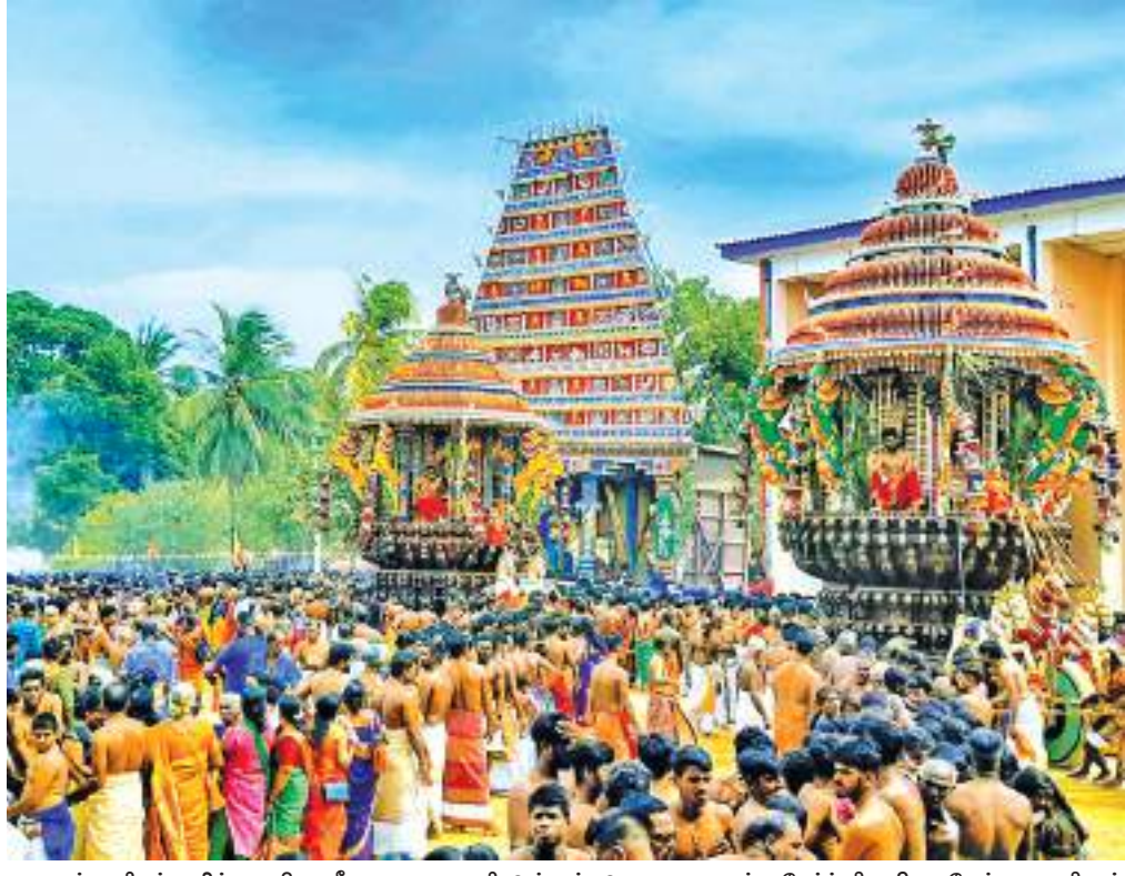
வரலாற்று சிறப்பு மிக்க நயினாதீவு நாகபூஷணி அம்மன் ஆலய வருடாந்த தேர்த் திருவிழா நேற்றைய தினம் செல்வாக்கிழமை காலை நடைபெற்றது. வசந்த மண்டப பூஜைகளை தொடர்ந்து, பின்னையார், முருக பெருமானுடன் உள்வீதியான வந்த நாகபூஷணி அம்மன் திருத்தேரில் ஆரோகணித்து பக்தர்களுக்கு அருட்காசி அளித்தார்.

3700 மெ.தொன் எரிவாயுவடன் மற்றுமொரு கப்பல் நாட்டை வந்தடைந்தது தொடராக விநியோகிக்க துரித ஏற்பாடு விற்பனை எரிவாயு நிறுவனத்தினால் இறக்குமதி செய்யப்பட்ட 3,700 மெட்ரிக் தொன் எரிவாயுவை கொண்ட மற்றுமொரு கப்பல் நேற்று (12) இலங்கையை வந்தடைந்ததாக விற்பனை 04