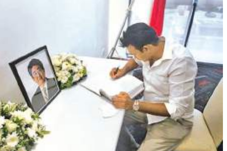
ஜப்பானின் முன்னாள் பிரதமர் ஷின்சோ அபேவின் மறைவிற்கு, இ.தொ.கா தலைவர் செந்தில் தொண்டாமான் ஜப்பானிய தூதரகத்திலுள்ள கிரங்கல் புத்தகத்தில் அனுதாபத்தை பதிவிட்டார்.

கிலோ 308 கிராம் ஹெரோயினை பொலிஸார் மீட்டுள்ளனர். போதைப்பொருள் வியாபாரம் தொடர்பில் பிரதான சந்தேக நபர் ஒருவர் அடையாளம் காணப்பட்டுள்ளதாகவும் சந்தேக நபர்களுடன் கைப்பற்றப்பட்ட ஹெரோயின் தொகை தொடர்பும் வழக்கின் சான்றுப் பொருளாக சமர்ப்பிக்கப்படும் எனவும் விசாரணை நடத்தி வரும் பொலிஸார் தெரிவித்தனர்.