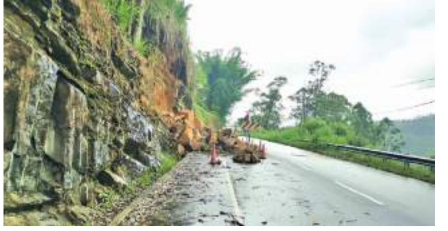
இதனை உடனடியாக அகற்ற சம்பந்தப்பட்ட அதிகாரிகள் நடவடிக்கை எடுக்க வேண்டுமென வாகன சாரதிகள் கோரிக்கை விடுகின்றனர்.

மலையகத்தில் தொடர்ச்சியாக பெய்து வரும் கடும் மழை காரணமாக ஹற்றன் நுவரெலியா பிரதான வீதியில் கற்பாறைகள் சரிந்து விழும் அபாயம் ஏற்பட்டுள்ளது. தலவாக்கலை டெவன் பகுதியில் கடந்த சில தினங்களுக்கு முன்னர் கற்பாறைகள் சரிந்து வீதியில் வீழ்ந்துள்ளன. இதனை சீர் செய்யும் நடவடிக்கைகளை சம்பந்தப்பட்டவர்கள் இதுவரை முன்னெடுக்கவில்லை என வாகன சாரதிகள் விசனம் தெரிவித்துள்ளனர். எனவே வாகன போக்குவரத்துக்கு இடையூறாக இந்த கற்பாறைகள் பிரதான வீதியோரமாக கிடப்பதால்