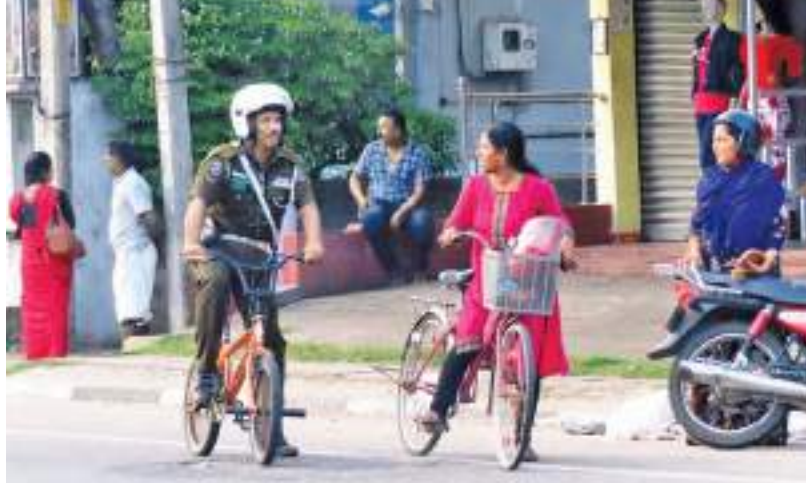
எரிபொருள் பற்றாக்குறை காரணமாக அம்பாறை மாவட்டத்தில் போக்குவரத்து பொலிஸ் தமது கடமையினை துவிச்சக்கரவாகு மூலம் மேற்கொண்டு வருகின்றனர்.

'ஜனநாயகத்தின் நான்காவது துணை நகரக்க நினைக்காதே', 'ஊடக சுதந்திரத்தையும் ஊடகவியலாளர்களின் பாதுகாப்பையும் உறுதிப்படுத்து போன்ற பதாகைகளை ஏற்றியவாறும், ஊடக சுதந்திரத்தை உறுதிப்படுத்தி, ஊடகவியலாளர்களுக்கு நீதியை பெற்றுக் கொடுக்க வேண்டும் என்ற கோசங்களை எழுப்பியவாறும் ஆர்ப்பாட்டத்தில் ஈடுபட்டிருந்தனர். ஒரு மணித்தியாலம் முன்னெடுக்கப்பட்ட ஆர்ப்பாட்டத்தில் மட்டக்களப்பு மாவட்ட முஸ்லிம் ஊடகவியலாளர்களும், மட்டக்களப்பு மாவட்டத்தைச் சேர்ந்த தமிழ் ஊடகவியலாளர்களும் கலந்து கொண்டனர்.