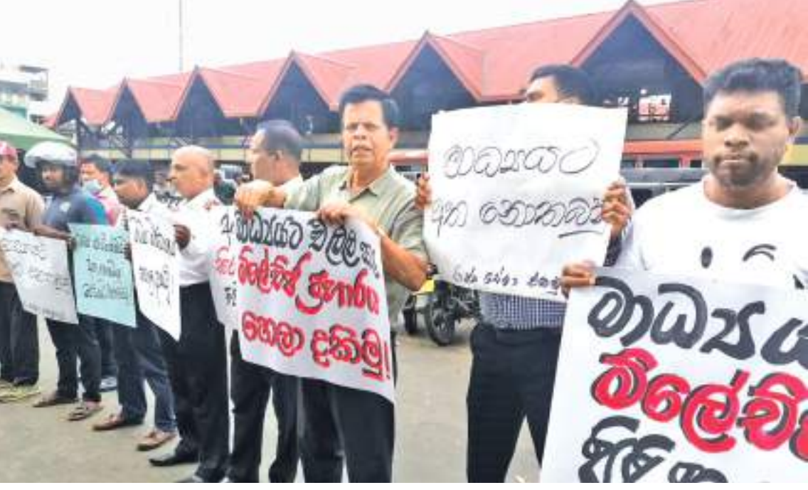
கொழும்பில் ஊடகவியலாளர்கள் தாக்கப்பட்டமை தொடர்பில் பலத்த கண்டனத்தை தெரிவிக்கும் முகமாக பதுளை மாவட்ட ஊடகவியலாளர்கள், சமூக செயற்பாட்டாளர்கள் ஆகியோர் கிணைந்து நேற்றுமுன்தினம் பதுளை பஸ் நிலையத்திற்கு முன்பாக பாரிய ஆர்ப்பாட்டொன்றில் ஈடுபட்டனர்.

பசறை நடு ஊருக்கு பிரதான வீதியில் நேற்று காலை இடம் பெற்ற பஸ்விபத்தில் ஒருவர் படுகாயமடைந்துள்ளார். பதுளை நோக்கி சென்று கொண்டிருந்த ஜீப் வண்டியொன்று கோணக்கலை புறூல்வத்தை பாடசாலைக்கு அருகிலுள்ள பாலத்திலிருந்து பள்ளத்தில் வீழ்ந்து விபத்துக்குள்ளானது. இதன்போது வாகன சாரதி படுகாயமடைந்துள்ளதோடு அயலவர்களின் உதவியுடன் மீட்கப்பட்டு பசறை பொது வைத்தியசாலையில் அனுமதிக்கப்பட்டதன் பின்னர் மேலதிக சிகிச்சைகளுக்காக பதுளை மாவட்ட வைத்தியசாலைக்கு அனுப்பி வைக்கப்பட்டுள்ளார். இவ்விபத்து தொடர்பாக மேலதிக விசாரணைகளை பசறை பொலிஸார் மேற்கொண்டு வருகின்றனர்.