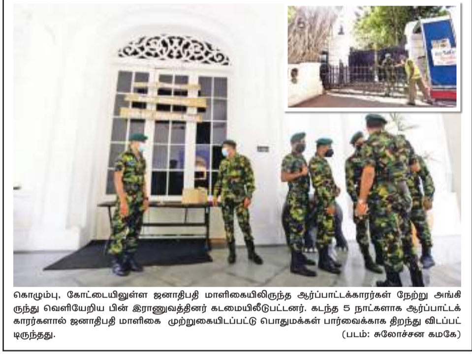
கொழும்பு, கோட்டையிலுள்ள ஜனாதிபதி மாளிகையிலிருந்து ஆர்ப்பாட்டக்காரர்கள் நேற்று அங்கிருந்து வெளியேறிய பின் இராணுவத்தினர் கடைமையிலேடுபட்டனர். கடந்த 5 நாட்களாக ஆர்ப்பாட்டக்காரர்களால் ஜனாதிபதி மாளிகை முற்றுகையிடப்பட்டு பொதுமக்கள் பார்வைக்காக திறந்து விடப்பட்டிருந்தது.

சிங்கப்பூரிலுள்ள இலங்கை தூதரகம் ஊடாக கடிதம் அனுப்பி வைப்பு ஜனாதிபதி கோட்டாபய ராஜபக்ஷ தனது இராஜினாமா கடிதத்தை சபாநாயகர் மகிந்த யாப்பா அபேவர்தனவுக்கு அனுப்பி வைத்துள்ளார். சிங்கப்பூரில் உள்ள இலங்கைத் தூதரகம் ஊடாக ஜனாதிபதி கோட்டாபய ராஜபக்ஷ அனுப்பி வைத்த இராஜினாமா கடிதம் கிடைத்ததாக சபாநாயகரின் ஊடகப் பிரிவு நேற்று உறுதி செய்தது. இராஜினாமா கடிதத்தின் சட்டபூர்வ தன்மை தொடர்பில் மீள ஆராயப்பட்டபின் இது தொடர்பான உத்தியோகபூர்வ அறிவிப்பை இன்று மக்களுக்கு உத்தியோகபூர்வமாக அறிவிப்பதாக சபாநாயகர் மகிந்த யாப்பா அபேவர்தன மேலும் தெரிவித்தார்.