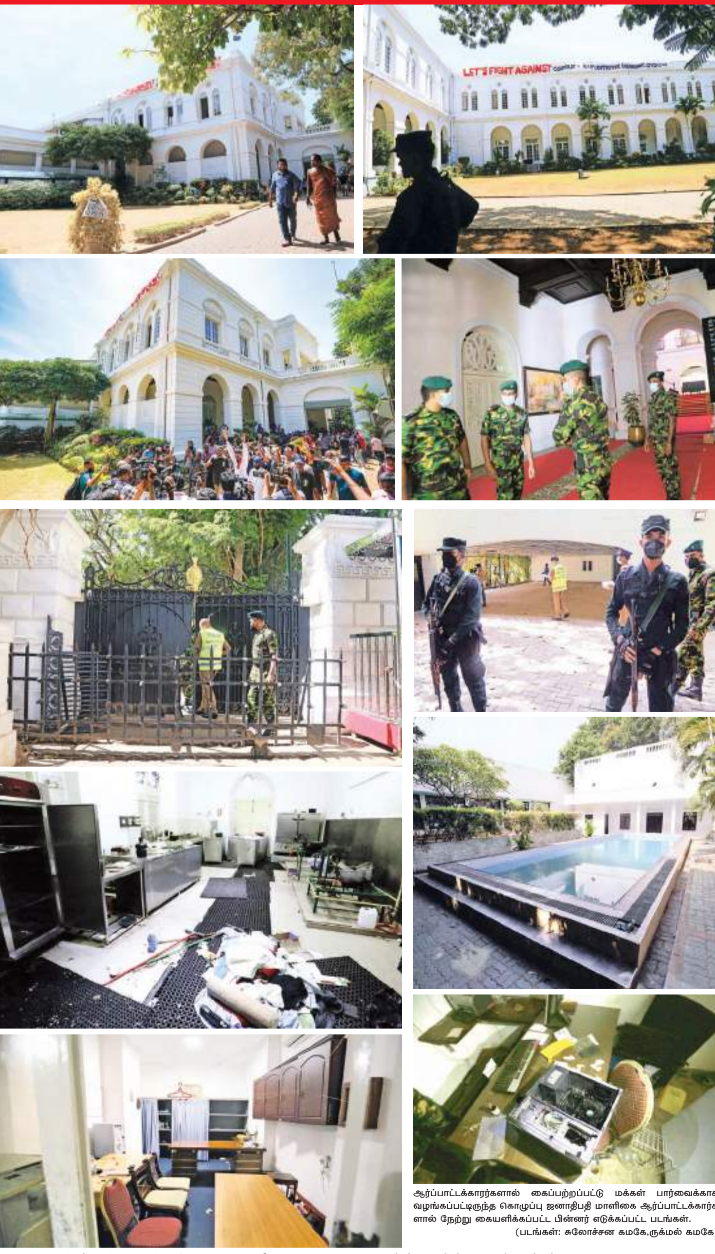
ஆர்ப்பாட்டக்காரர்களால் கைப்பற்றப்பட்டு மக்கள் பார்வைக்காக வழங்கப்பட்டிருந்த கொழும்பு ஜனாதிபதி மாளிகை ஆர்ப்பாட்டக்காரர்களால் நேற்று கையளிக்கப்பட்ட பின்னர் எடுக்கப்பட்ட படங்கள்.