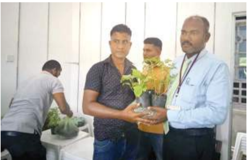
கிண்ணியாவில் தெரிவு செய்யப்பட்ட கலைஞர்களுக்கு வீட்டுத் தோட்டம் செய்வதற்கான மரக்கன்றுகள் கிண்ணியா பிரதேச செயலகத்தில் விநியோகிக்கப்பட்டு வருகிறது. (14) வழங்கி வைக்கப்பட போது...

அடையாளம் கண்ட வகையில் சஜித் பிரேமதாசு, அனுரகுமார திலா நாயக்க ஆகியோரும் இந்நாட்டை தலைமை ஏற்று நடத்துவதற்கு மிக பொருத்தமானவர்கள். சஜித் ஜனாதிபதியாக, அனுரகுமார திலா நாயக்க பிரதமராக நியமிக்கப்பட வேண்டும் என்று நாம் முன்மொழிகின்றோம். ரணில் விக்கிரமசிங்க உடனடியாக பிரதமர் பதவியில் இருந்து விலகி வழி விட வேண்டும். இந்த அரசாங்கத்தை தீர்மானிக்கின்ற சக்திகளாக போராட்டக்காரர்கள் தொடர்ந்தும் இருந்து இயக்குதல் வேண்டும். அதேபோல் வடகிழக்கிலும் இவ்வாறான மக்கள் போராட்டங்கள் முன்னெடுக்கப்பட வேண்டும்.