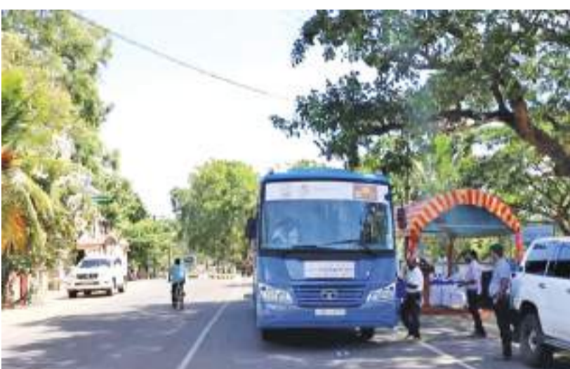
மட்டக்களப்பு விசேட நிருபர்

தற்போதைய எரிபொருள் தட்டுப்பாடு காரணமாக போக்குவரத்துக்கள் மட்டுப்படுத்தப்பட்ட நிலையில் பொதுமக்கள் பலசிரமங்களை எதிர்நோக்குகின்றனர். அவர்களின் நலன் கருதி புதிய உள்ளக நகர போக்குவரத்து சேவை ஒன்று நேற்று (14) மட்டக்களப்பு