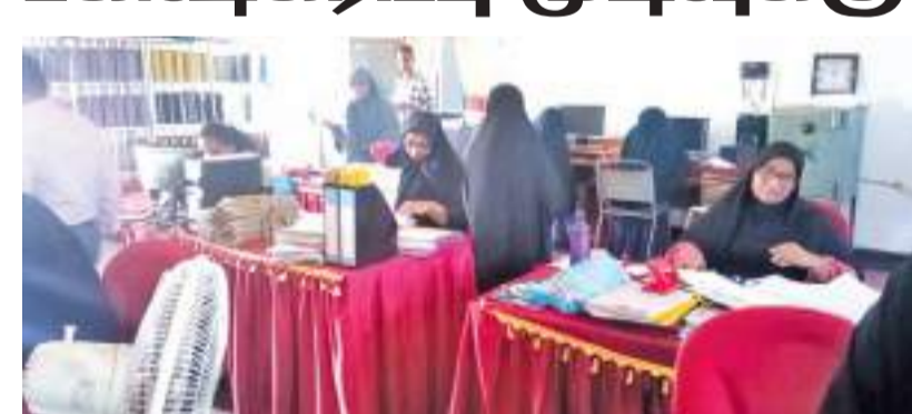
புதிய காத்தான்குடி தினகரன் நிருபர்

மட்டக்களப்பு மாவட்ட சமுர்த்தி உத்தியோகத்தர்கள் மேற்கொண்ட பணி பகிஷ்கரிப்பு நேற்று (14) விநியோகத்தை கைவிட்டு கடமைக்கு திரும்பினர். சகல சமுர்த்தி அபிவிருத்தி உத்தியோகத்தர்களையும் பணிப் பகிஷ்கரிப்பை கைவிட்டு கடமைக்கு திரும்புமாறு அகில இலங்கை சமுர்த்தி அபிவிருத்தி உத்தியோகத்தர்கள் மற்றும் விவசாய ஆராய்ச்சி உத்தியோகத்தர் சங்கம் வேண்டுகோள் விடுத்ததையடுத்து சகல சமுர்த்தி அபிவிருத்தி உத்தியோகத்தர்களும் வியா