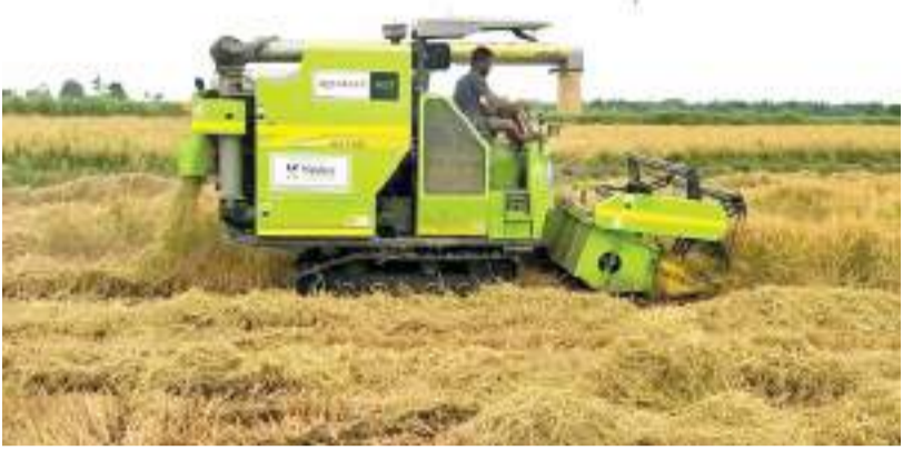
அக்கரைப்பற்று மத்திய நிருபர்

அம்பாறை மாவட்டத்தில் வேளாண்மை அறுவடை இயந்திரங்களின் கூலி அதிகரிப்பு