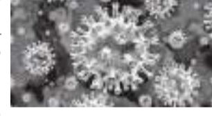
சுகாதார பிரிவு கட்டும் எச்சரிக்கை

இலங்கையில் கொவிட் வைரஸ் பரம்பல் மீண்டும் தலைதூக்க ஆரம்பித்துள்ளதாக சுகாதாரத்துறை புள்ளி விபரங்கள் மூலம் தெரியவந்துள்ளது. நேற்றைய தினத்தில் மாத்திரம் 72 கொவிட் தொற்றாளர்கள் கண்டுபிடிக்கப்பட்டுள்ளனர். இவர்களில் வெளிநாடு சென்று திரும்பியோர் எவரும் இல்லை என்பதுடன்