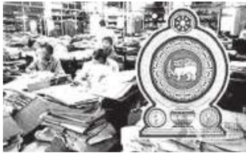
தது. எவ்வாறாயினும் பொது நிர்வாக அமைச்சின் செயலாளர்

அரசாங்க அலுவலகங்களுக்கு ஊழியர்களை சேவைக்கு அழைப்பதை மட்டுப்படுத்தும் வகையில் ஏற்கனவே வெளியிடப்பட்டுள்ள சுற்று நிரும் மேலும் ஒரு மாத காலத்திற்கு நீடிக்கப்பட்டுள்ளது. எரிபொருள் தட்டுப்பாடு, போக்குவரத்து வசதிகளில் நிலவிய அசௌகரியங்களை கருத்திற் கொண்டு பொது நிர்வாக உள்நாட்டலுவலர்கள் அமைச்சு கடந்த ஜூன் 20 ஆம் திகதி அரசாங்க ஊழியர்களை கடமைக்கு அழைப்பதை மட்டுப்படுத்தும் வகையிலான தீர்மானத்தை எடுத்திருந்தது. எவ்வாறாயினும் பொது நிர்வாக அமைச்சின் செயலாளர்