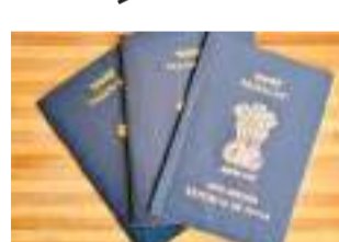
இலங்கையர் கள், வெளிநாடு செல்ல இந்திய கடவுச்சீட்டை பெற்றுக்கொள்வதாக கிடைத்த தகவலின் அடிப்படையில், தமிழக கியூ பிரிவு பொலிஸார் விசாரணைகளை ஆரம்பித்துள்ளனர்.

இலங்கையர் கள், வெளிநாடு செல்ல இந்திய கடவுச்சீட்டை பெற்றுக்கொள்வதாக கிடைத்த தகவலின் அடிப்படையில், தமிழக கியூ பிரிவு பொலிஸார் விசாரணைகளை ஆரம்பித்துள்ளனர். இந்த சட்டவிரோத நடவடிக்கை தொடர்பாக கடந்த 2019 ஆம் ஆண்டு வழக்கொன்று தொடரப்பட்டுள்ளது. இந்த விடயத்தில் 5 பொலிஸ் அதிகாரிகள், இந்திய குடிவரவு மற்றும் குடியகல்வு பணியகத்தின் 14 அதிகாரிகள், இந்திய தபால் திணைக்களத்தின் 2 அதிகாரிகள் உட்பட 41 பேர் சம்பந்தப்பட்டுள்ளதாக கூறப்படுகிறது.