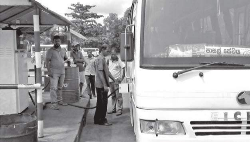
பாடசாலைகள் இன்று ஆரம்பமாகும் நிலையில் ஜனாதிபதியின் பணிப்பில் பாடசாலை பஸ்களுக்கு நேற்று ஏரிபொருள் விநியோகிக்கப்படுவதை படத்தில் காணலாம்.

பட்டவுள்ளது. இதேவேளை, சர்வ கட்சி அரசாங்கம் தொடர்பில் அரசாங்கத்து டன் இணைந்து செயற்படுவது குறித்து இதுவரை எவ்வித தீர்மானமும் எட்டப்பட வில்லை என ஐக்கிய மக்கள் சக்தியின் பொதுச் செயலாளர் ரகுசித் மத்தும் பண்டார தெரிவித்துள்ளார். கட்சித் தலை வர்கள் கூடி இறுதி முடிவு எடுப்பார்கள் என்றும் அவர் தெரிவித் துள்ளார்.க.கவும் அமைச்சப் பொறுப்புக் களை ஏற்காது என கட்சி செயலாளர் தயாசிரி ஜெயசேகா அறிவித்துள்ளதோடு த.தே.கூ வும் இதே நிலைப்பாட்டை அறி வித்துள்ளது.