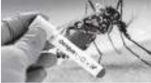
டெங்கு நோய் தீவிரமடையும் அபாயம் ஏற்பட்டுள்ள நிலையில் இன்று நாடுபூராவும் டெங்கு ஒழிப்பு தினம் முன்னெடுக்கப்படுகிறது. கடந்த 7 மாத காலத்தினுள் 44 ஆயிரம் டெங்கு நோயாளர்கள் அடையாளம் காணப்பட்டுள்ளதோடு எதிர்வரும் நாட்களில் இது தீவிரமடையும் அபாயம் உள்ளதாக தெற்றுநோய் தடுப்புப் பிரிவு தெரிவித்துள்ளது. இந்த மாதத்தில் மாதிரம் 8900 டெங்கு