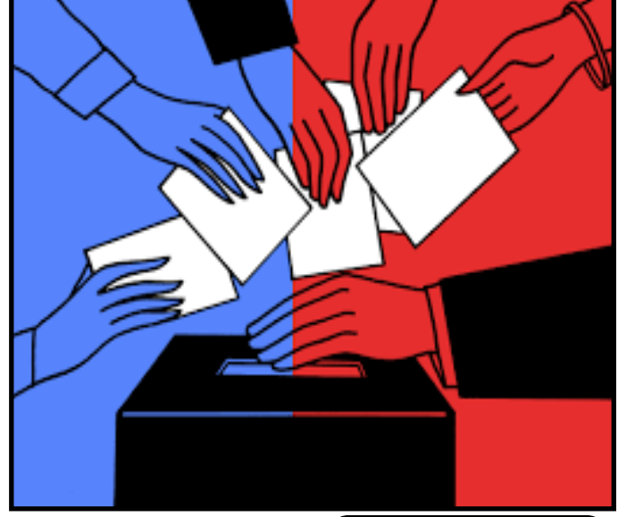
தொகுப்பு - லிங்கம்

தென் சூடானைப் பொறுத்தவரை பொதுவாக்கெடுப்பை சாத்தியமாக்கியது அங்கு நடந்த விடுதலைப் போர். கடலோனியாவைப் பொறுத்தவரை பொதுவாக்கெடுப்புக்கான முன்னெடுப்புகள் செய்வதை சாத்தியமாக்கியது அங்கிருந்த சுயாட்சி அரசாங்கம். தமிழ் மக்களைப் பொறுத்தவரை இந்த இரண்டுமே இன்று இல்லை. ஆயுதப் போராட்டம் 2009 ஆம் ஆண்டு தோற்கடிக்கப்பட்டது. ஈழத்தமிழ் மக்களின் ஒரு