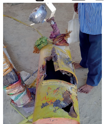
சென்றுள்ளதாக முறைப்பாடு செய்யப்பட்டுள்ளதாக பொலிஸார் தெரிவித்தனர்.

வலையிறவு மடத்துப்பிள்ளையார் கோவில் உண்டியலை உடைத்து அதிலிருந்து பணத்தை திருடிச் சென்றுள்ள சம்பவம் சனிக்கிழமை (01) அதிகாலை இடம்பெற்றுள்ளதாக மட்டக்களப்பு தலைமையக பொலிஸார் தெரிவித்தனர். குறித்த கோவிலின் முன்னால் உள்ள உண்டியலை, இரும்பு கம்பியால் தாக்கி உடைத்து, அதிலிருந்து 25 ஆயிரம் ரூபாய்க்கும் அதிகமான பணத்தை திருடிச்