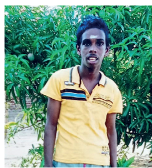
அவரது சகோதரி கேட்டுக்கொண்டுள்ளார்.

நிலையத்தில் முறைப்பாடு செய்துள்ளதாகவும், திங்கட்கிழமை (03) அக்கரைப்பற்று பஸ் தரிப்பிடத்தில் குறிந்த நபரைக் கண்டதாக ஓட்டோ சாரதி ஒருவர் தெரிவித்துள்ள நிலையில், மனநலம் பாதிக்கப்பட்ட தனது தம்பியை யாராவது அவதானித்தால், 0750438780 என்ற அலைபேசி இலக்கத்துக்கு தெரியப்படுத்துமாறு