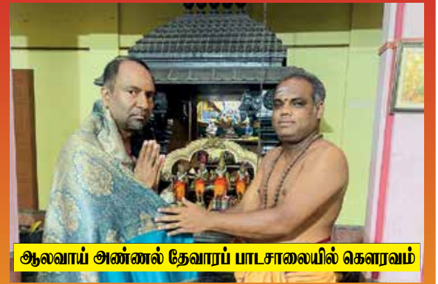
ஆலவாய் அண்ணல் தேவாரப் பாடசாலையில் கௌரவம்