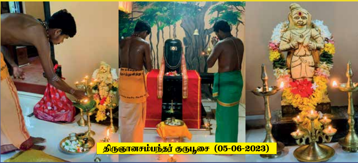
திருஞானசம்பந்தர் குருபூசை (05-06-2023)