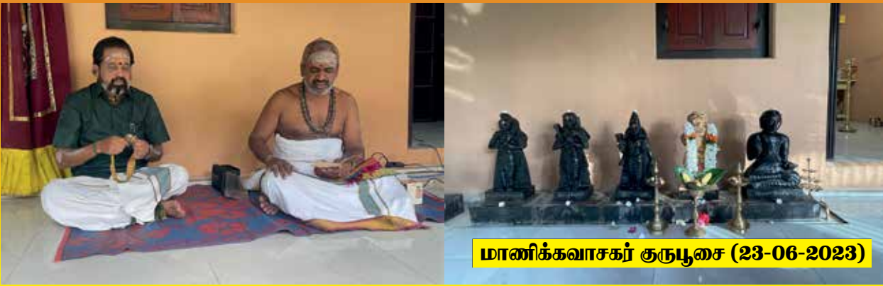
மாணிக்கவாசகர் குருபூசை (23-06-2023)