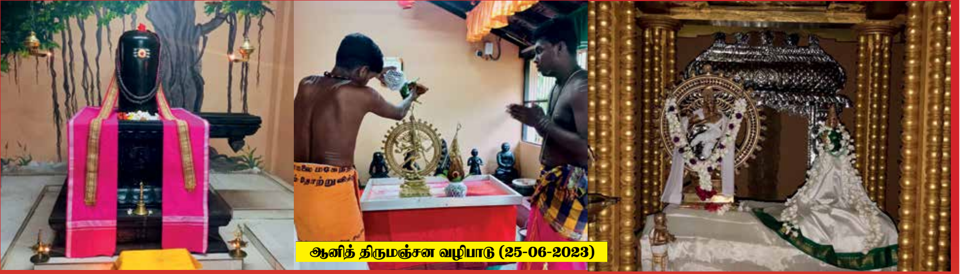
ஆனித் திருமஞ்சள வழிபாடு (25-06-2023)