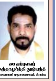
சைவப்புவலர் சுந்தரமூர்த்தி துலையந் வைணம் முதுவைணம், பரங்க

"மேன்மைகொள் சைவநீதி விளங்குக உலகமெல்லாம்" திருச்சிற்றம்பலம்