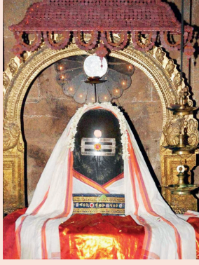
திருவேதிகுடி மாதேவர் - வேதபுரீசுவரர்

நீண்ட நாளாக திருமணமாகாமல், திருமணத் தடைகள், இடையூறுகள், இழுப்புகள் நிலவிவந்தால் தஞ்சாவூர் வேதிகுடியில் இருக்கும் மங்கையர்க்கரசி அம்பாளுடனுறை வேதிகுடி வேதபுரீசுவரப் பெருமானை மனதிலே நினைந்து உளமுருகி திருஞான சம்பந்த மூர்த்தி நாயனார் அருளிச்செய்த முன்றாம் திருமுறை (பதிகம் 3-78, திருவேதிகுடி) “நீறுவரி ஆடுஅரவொடு ஆமை மனவு” என்ற பதிகத்தினை, காலை மாலை இருவேளையும் வேதிகுடி அரசின் திருவடியை நீள நினைந்து, உளமுருகி மெய்யன் போடு பாடுவது திருமணத்தடைகளை தகர்க்கும். உரியவர் பாடினால் இன்னும் சிறப்பாகும் இப்படி இயலாதவர்களுக்கு அவர்கள் பொருட்டு பெற்றோரோ, உறவினர்களோ பாடுதலும் பலன்தரும்.