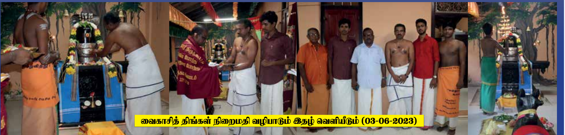
வைகாசித் திங்கள் நிறைமதி வழிபாடும் இதழ் வெளியீடும் (03-06-2023)