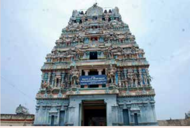
“எரியார் சடையும் அடியும் இருவர்தெரியாததொர் தீத் திரளாயவனே மரியார் பிரியா மருகற் பெருமானே!”

[இவ்வாரப் பாலப்பற்று 274 சிவபுரங்களில் 29 ஆவது திருக்கோயில் - திருமருகல்]