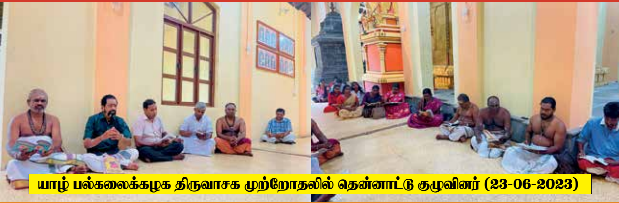
யாழ் பல்கலைக்கழக திருவாசக முற்றோதலில் தென்னாட்டு குழுவினர் (23-06-2023)