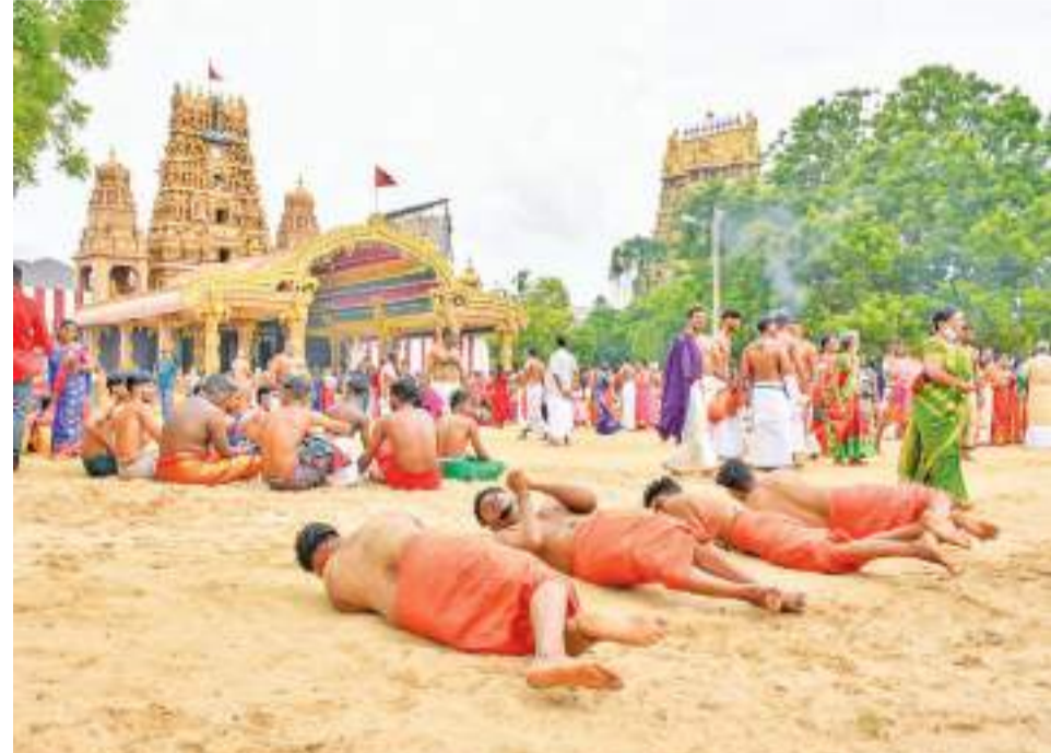
வரலாற்று சிறப்பு மிக்க நல்லூர் கந்தசுவாமி ஆலய வகுடாந்த மகோற்சவம் நேற்றுக் காலை 10 மணிக்கு கொண்டாடப்பட்டது. கொவிட்-19 தொற்றுக்கு பின்னர் முதல் முறையாக பெருந்தொகையான அடியார்களின் பங்களிப்புடன் நேற்று விழா ஆரம்பமானது.

பிலியந்தலை, நாரஹேன்பிட்டியில் அதிரடி கொள்ளப்பட்டுள்ள ஜனாதிபதி ரணில் விக்கிரமசிங்கவின் பிரதேச இல்லத்துக்கு தீ வைத்த சம்பவத்தின் பிரதான சந்தேகநபர் உட்பட மூன்று பேர் கைது செய்யப்பட்டுள்ளதாக பொலிஸ் ஊடகப் பிரிவு தெரிவித்துள்ளது. 06