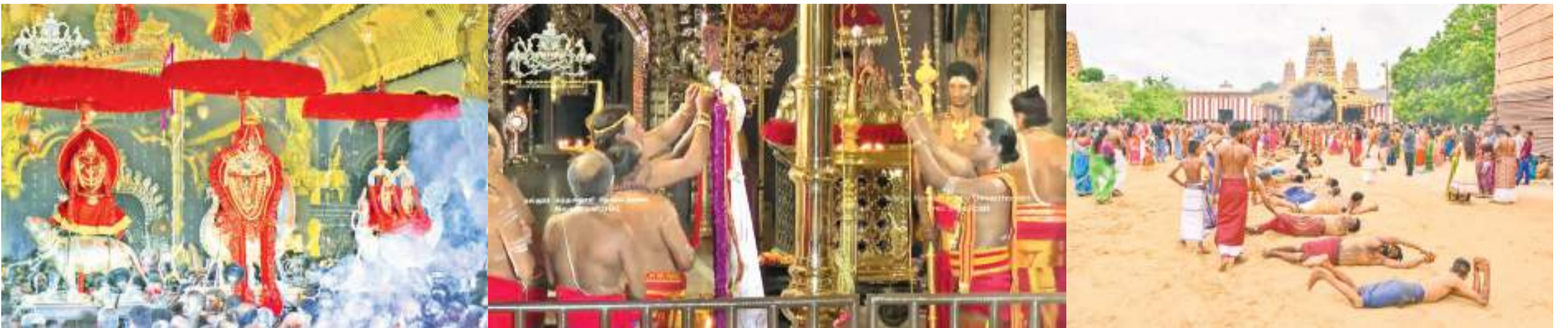
யாழ். விசேட நிருபர்

வரலாற்று சிறப்பு மிக்க நல்லூர் கந்தசுவாமி ஆலய