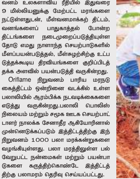
Oriflame நிறுவனம் பாரிய மரநடுகைகளைக் கட்டி ஒன்றிணை வடக்கில் உள்ள பலாவிளத்தில் ஆரம்பிக்க நடவடிக்கைகளை எடுத்து வருகின்றது.