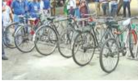
கொழும்பு மாநகரசபையினால் தற்போது பின்வரும் நகராட்சி பிரதேசங்களில் துவிச்சக்கர வண்டி தரிப்பிடங்கள் அமைக்கப்பட்டு உள்ளன.

கொழும்பு பிரதேச மக்கள் மத்தியில் துவிச்சக்கர வண்டி பாவனைக்கு ஊக்களித்து ஒத்துழைப்பு வழங்கி மாநகரசபையின் பாக்களிப்பை வழங்கும் நோக்கில் இந்தத் திட்டம் அறிமுகமாகியுள்ளது.