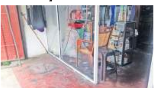
யாழ். விசேட, பகுத்தித் துறை நிருபர்கள்

யாழ்ப்பாணம் கொக்குவில் குளப்பிட்டி பகுதியிலுள்ள எரிபொருள் நிரப்பு நிலையத்திற்கு அருகில் இடம்பெற்ற மோதல் சம்பவமொன்றில் அப்பகுதியிலுள்ள புடவை விற்பனை நிலையமொன்று சேதமாக்கப்பட்டுள்ளது. எரிபொருள் நிரப்பு நிலையத்தில் எரிபொருள் பெருநீர்வெள்ளம் காரணமாக வாகனங்களுக்கு இடையில் நேற்று முன்தினம் இரவு ஏற்பட்ட வாய்த்தர்க்கம் கைகலப்பாக மாறியதில் விற்பனை நிலையம் சேதமடைந்துள்ளது.