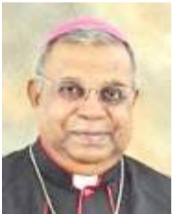
தலைமன்னார் விசேட நிருபர்

கொரோனா தொற்று மீண்டும் தலைதூக்கக் கடுமையான சுகாதார விதிமுறைகளை பின் பற்றி மக்கள் ஆவணி மடு பெருவிழாவில் கலந்து கொள்ள மாறு மன்னார் ஆயர் இம்மாதிரி வேண்டுகோள்களை தெரிவித்தார். ஆண்டுகை தெரிவித்தார்.