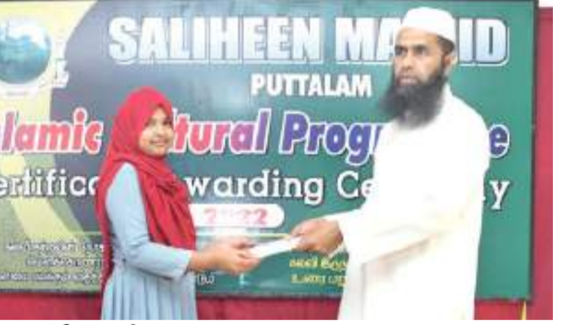
புத்தளம் தினகரன் நிருபர்

புத்தளம் ஸாலிஹீன் பள்ளி நிர்வாகத்தினரால் ஏற்பாடு செய்யப்பட்டு வெற்றிகரமாக நடைபெற்று முடிந்த இஸ்லாமிய கலை கலாசார நிகழ்வுகளில் வெற்றி பெற்றவர்களுக்கான சான்றிதழ் வழங்கும் நிகழ்வு அண்மையில் சாலிஹீன் பள்ளிவாசல் வளாகத்தில் நடைபெற்றது. இப்போட்டி நிகழ்ச்சியில் மொத்தமாக 657 மாணவ மாணவிகள் ஆர்வத்தோடு கலந்து கொண்டனர். போட்டிகளில் பங்கேற்ற அனைவருக்கும் சான்றிதழ்கள் வழங்கி