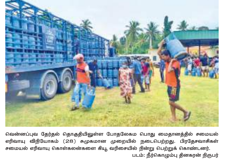
வெள்ளப்புவ தேர்தல் தொகுதியிலுள்ள போதலேகம் பொது மைதானத்தில் சமையல் எரிவாயு விநியோகம் (28) சுமுகமான முறையில் நடைபெற்றது. பிரதேசவாசிகள் சமையல் எரிவாயு கொள்கலன்களை கீழு வரிசையில் நிறுந்து பெற்றுக் கொண்டனர்.