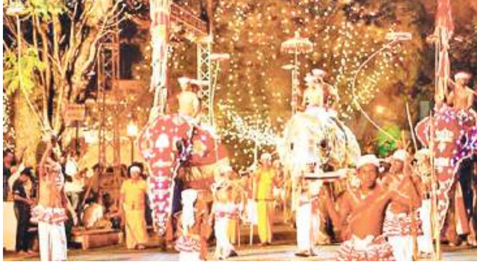
நாளான எதிர்வரும் 12 ஆம் திகதி காலை 11.45 பகல் பெரஹரவுடன் 'தீயா கெப்பீம்'

வரலாற்றுச் சிறப்பு மிக்க கண்டி எசல பெரஹரா உற்சவ நிகழ்வுகள் தற்போது மிகவும் கோலாகலமாக கண்டியில் நடைபெற்று வருகின்றன. கடந்த ஜூலை மாதம் 29 ஆம் திகதி உள்பெரஹரா வீதி ஊர்வலத்துடன் ஆரம்பமான நிகழ்வுகள் எதிர்வரும் 12ஆம் திகதி பகல் பெரஹரா பிரதான நிகழ்வுகளுடன் நிறைவடையும்.