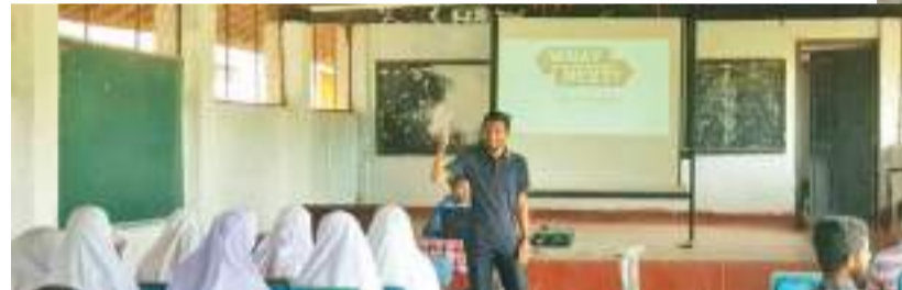
நீர்கொழும்பு தினகரன் நிருபர்

சிலபயம் கல்வி வலயப் பிரிவினாவுள்ள தமிழ் மொழி மூலப்பாடசாலைகளில் கல்வி பயின்று 2021ம் ஆண்டுக்கான க.பொ.த சாத பரீட்சைக்கு அண்மையில் தேர்வறிய மாணவர்களுக்கான "க.பொ.த. உயர்தர பிரிவில் கல்வி பயிற்சித் தரங்கு" கொட்டராமுல்ல அல்