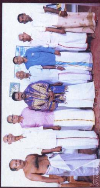
அறங்காவலர் நிளம் - 2022