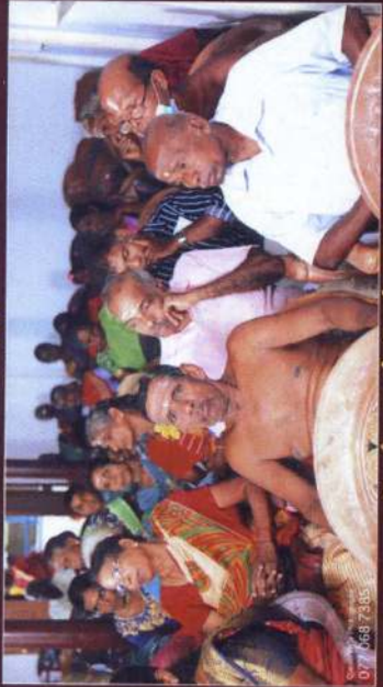
அறங்காவலர் நிளம் - 2022