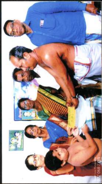
அறங்காவலர் நிளம் - 2022