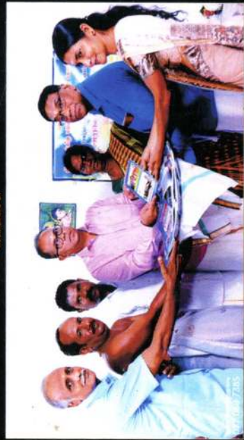
அறங்காவலர் நிளம் - 2022