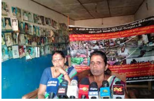
இறந்தவர்களுக்காவது உரிய நீதியைப் பெற்றுக்கொடுக்க நடவடிக்கை எடுக்கப்படுமா? என்பதில் கூட சந்தேகம் எழுந்துள்ளதாகவும் அவர் கவலை தெரிவித்துள்ளார்.

தற்போது முல்லைத்தீவு மாவட்டத்தில் மனிதப் பதைகுழி அகழ்வு நடவடிக்கை இடம்பெற்று வரும் நிலையில்,