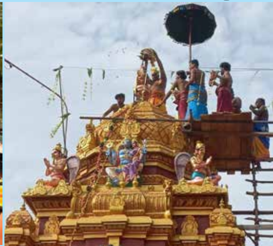
யாழ்ப்பாணம் - பொன்னாலை ஸ்ரீ வரதராஜப்பெருமாள் ஆலய நவகுண்ட பக்ஷ சம்புரோக்ஷண