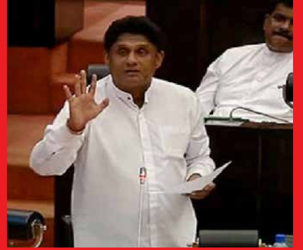
நடவடிக்கையொன்றை மேற்கொள்ள வேண்டும் என அவர் தெரிவித்துள்ளார்.

நேற்று ஒரு தாய் அறந்துள்ளார். இந்த அறப்புக்கு நஷ்ட ஈடு கொடுப்பதால் மட்டும், அவரது பிள்ளைகளும் கணவரும் நன்றாக வாழ்ந்துவிடுவார்களா? எனவே, இது தொடர்பாக அரசாங்கம் தீவிரமான