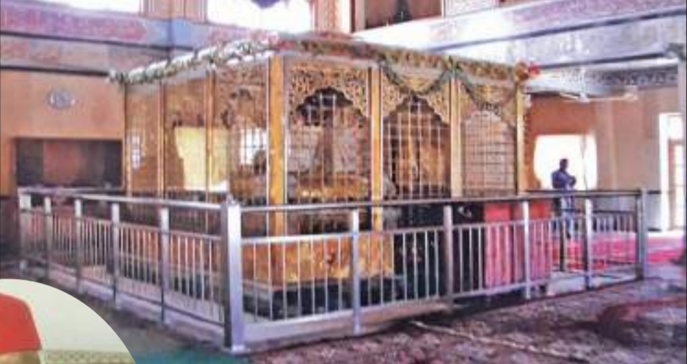
எகிப்து நாட்டில் ஹுமைசராவில் அடங்கப்பட்டுள்ள இமாம் ஷாதுலி நாயகம் (றழி) அவர்களின் வரலாறு சரிப் (அடக்கஸ்தலம்)

ஞானப் பாதைக்கும் ஷாதுலிய்யா தர்கா எனப் பெயர் வரலாயிற்று. இல்லாத்தின் இதயத்தை இயக்கிவிட்டு புத்தாயிர் அளித்ததால் நூறுத்தீன் (மார்க் கத்தின் கடர்) என்ற பெயர் பெற்றார்கள். மெய்ஞானி ஷாதுலி நாயகம் அவர்களின் ஞானப் பேருரைகள் அனைவர்கள் உள்ளத்தையும் கவர்ந்தன. ஷரீஅத்தை கண்டிப்பாய் கடைபிடிக்கும் படி மக்களை அச்சுபட்டி ஏச்சரிக்கை செய்தார்கள். அவர்களின் அற்புதக் கருத்துக்களை கேட்க பல்லாயிரக்கணக்கான மக்கள் கூடினார்கள். ஷாதுலாவில் பிரசாரத்தை முடித்துக் கொண்டு ஷேய்கின் சொற்படி தூனில் சென்றார்கள்.