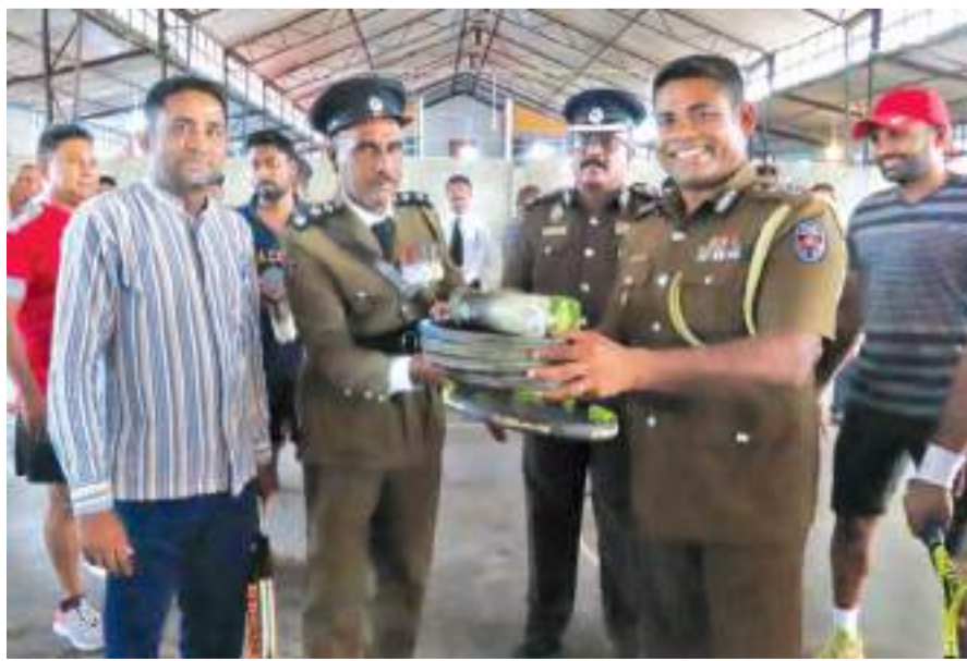
பி.எம்.எம்.ஏ.காதர்... ஈ (மருதமுனை தினகரன் நிருபர்)

யத்தினை இணைத்து அமைக்கப்பட்ட டென்ஸில் விளையாட்டு கூடத்தை பார்வையிட்டதுடன் டென்ஸில் விளையாட்டிலும் பங்குபற்றியமை குறிப்பிடத்தக்கது. இந்நிகழ்வில் பொலிஸ் ஆலோசனைக்கு உறுப்பினர்கள் உட்பட பலரும் கலந்து கொண்டனர்.