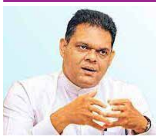
'அஸ்வெசும' நலன்புரித் திட்டத்திற்

காக கிடைக்கப்பெற்ற மேன் முறையீடுகள் மற்றும் ஆட்சேபனைகள் தொடர்பில், மாவட்டச் செயலாளர்கள் மதிப்பீடு செய்ய ஆரம்பிப்பார்கள், என நிதி இராஜாங்க அமைச்சர் ஷெஹான் சேமசிங்க தெரிவித்துள்ளார்.