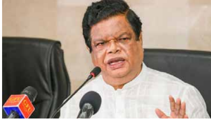
மேற்கொள்வதற்கான கலந்துரையாடலை ஆரம்பிக்க ஜனாதிபதி ரணில் விக்கிரமசிங்க சமர்ப்பித்த யோசனைக்கு அமைச்சரவை அங்கீகாரம் வழங்கியுள்ளதாக அவர் குறிப்பிட்டார்.

அதற்கமைய, நீண்டகாலத்திற்கு அந்த நாட்டுடன் சுதந்திர வர்த்தக உடன்படிக்கையை மேற்கொள்ளும் நோக்கில், அதன் ஆரம்பப் படிமுறையாக முன்னுரிமை வர்த்தக உடன்படிக்கையை