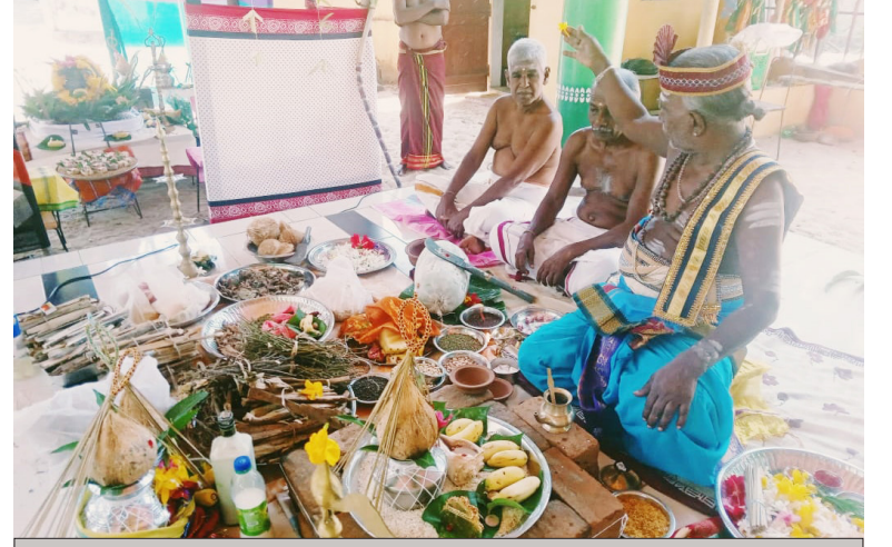
தம்பிலுவில் கலைமகள் வித்தியாலய ஆலையடிப் பிள்ளையார் ஆலய வருஷாபிஷேகம் நேற்று புதன்கிழமை நடைபெற்றது. (அ)