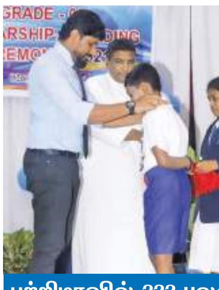
பற்றிமாவில் 222 புலமையாளர் கௌரவிப்பு