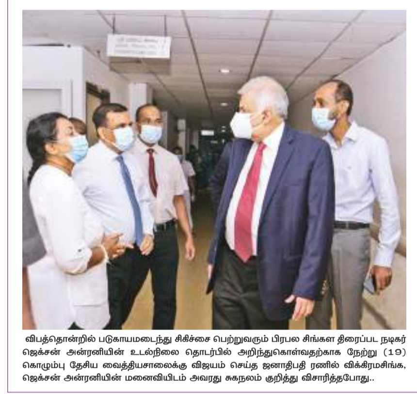
விபத்தொன்றில் படுகாயமடைந்து சிகிச்சை பெற்றுவரும் பிரபல சிங்கள திரைப்பட நடிகர் ஜெக்சன் அன்ரணியின் உடல்நிலை தொடர்பில் அறிந்துகொள்வதற்காக நேற்று (19) கொழும்பு தேசிய வைத்தியசாலைக்கு விஜயம் செய்த ஜனாதிபதி ரணில் விக்கிரமசிங்க, ஜெக்சன் அன்ரணியின் மனைவியிடம் அவரது சுகநிலை குறித்து விசாரித்தபோது..