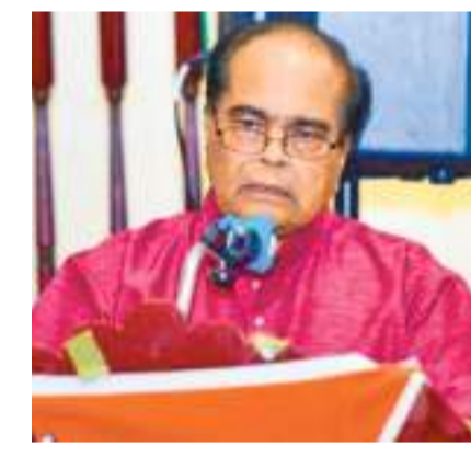
சுகர் சேவையாற்றுகிறார். தமிழர்களின் உடற்கல்வி மற்றும் மருத்துவத் தேவைகள் பற்றிய அறிவு வளர்ச்சி ஊக்குவிக்கும் முகமாக 1979 ஆண்டிலே தமிழர் மருத்துவ நிறுவனம் ஒன்றை அமைத்து அதன் இயக்குனர் சபையிலும் சேவையாற்றியுள்ளார்.

குறித்த சில கடற்கரைப் பிரதேசங்கள் முறையான நகரமற்றிப்பின்று, குப்பை கூளங்கள் காணப்படும் இடங்களாக காணப்படுகின்றன. தெரு மின்விளக்குகளின் இருளில் மூழ்கியுள்ளன. கட்டடக்காலிகளின் நடமாட்டம் அதிகரித்துக் காணப்படுகின்றது. குடிநீர், கழிவுநீர் வசதிகளேனும் இல்லாத அவலம் தொடருகின்றது. பொதுமக்கள் கழிவுகளை பாதுகாப்பான முறையில் அகற்றுவதற்கான கழிவுத் தொட்டிகள் இல்லை.