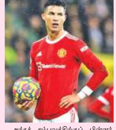
அந்தச் சம்பவத்திற்குப் பின்னர், ரொனால்டோ சமூக ஊடகத்தில் மன்னிப்புக் கேட்டுக்கொண்டார். மேலும் வேறொரு ஆட்டத்தைப் பார்த்து வருமாறு அவர் பாதிக்கப்பட்ட ரசிகருக்கு அழைப்புவிடுத்தார்.

கால்பந்து நட்சத்திரம் கிறிஸ்டியானோ ரொனால்டோ கடந்த பருவத் தின்போது எவர்டன் அணி ரசிகர் ஒருவரின் கையில் இருந்த கைபேசியைத் தட்டிவிட்டு நொறுக்குவதைப்போல் தோன்றும் வீடியோ தொடர்பில் பிரிட்டிஷ் பொலிஸார் அவருக்கு எச்சரிக்கை விடுத்துள்ளனர். அந்தச் சம்பவம் கடந்த ஏப்ரல் 9ஆம் திகதி மான்செஸ்டர் யுனைட்டெட் அணியும் எவர்டன் அணியும் மோதியபோது நடந்தது. அதில் 0-1 என்ற கோல் கணக்கில் மான்செஸ்டர் யுனைட்டெட் அணி தோல்வி அடைந்தது. திடீர்த் தாக்குதல், குற்றவியல், சேதம் ஆகிய குற்றச்சாட்டுகள் தொடர்பில் 37 வயது ரொனால்டோ அதிகாரிகளால் விசாரிக்கப்பட்டார். அவருக்கு நிபந்தனைபுடைய எச்சரிக்கை விடுக்கப்பட்டது.