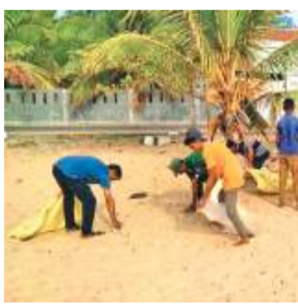
இயற்கையைப் பாதுகாத்தால், இயற்கை எங்களைப் பாதுகாக்கும்' என்ற வாசகமடங்கிய பதாகையொன்று பிரதான விழிப்புறுத்தல் பயணிகள் பார்வைக்கு காட்சிப்படுத்தப்பட்டிருந்தது. ஆனால், தற்காலத்தில் இயற்கையின் அருட்கொடையான பொது இடங்கள், இரம்மியப் பிரதேசங்களை பாதுகாப்பதை விடவும் அசிங்கப்படுத்துபவர்களையே அதிகம் காணக் கூடியதாக உள்ளது.

குறிப்பாக, அம்பாறை மாவட்டத்தில் பொது மக்கள் ஓய்வு மற்றும் பொழுது போக்கிற்காக பயன்படுத்தும் பொது இடங்கள் அதிகமுள்ளன. இவ்வாறான பொது இடங்கள் நீண்ட காலம் சத்தம் செய்யப்பட்டு, கவனிப்பாற்றா நிலையில் மிகவும் கவலைக்கிடமான நிலையில் இருப்பதை அவதானிக்கக் கூடியதாக உள்ளது.