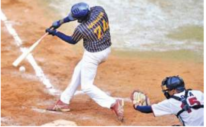
அமைய ஏற்பாடு செய்யப்பட்ட ஐந்து பேர் கொண்ட தொடராகும். இதன் காரணமாக இந்தப் போட்டித் தொடரில் அழைப்பு கிடைக்கப் பெற்ற நாடுகள் பங்கேற்பது முக்கியமானதாக பார்க்கப்படுகிறது. இது தொடரில் இலங்கை தேசிய பேஸ்போல் அணியின் முன்னாள்

இலங்கை பேஸ்போல் சங்கத் துக்கு கிடைத்த அழைப்புக்கு பதிலளிக்க தவறியதாலேயே மலேசியா வின் கோலாலம்பூரில் நடைபெற்ற சர்வதேச பேஸ்போல் போட்டியில் பங்கேற்கும் வாய்ப்பை இலங்கை இழந்திருப்பதாக குற்றச்சாட்டு எழுந்துள்ளது. இலங்கை உட்பட்ட ஒன்பது நாடுகள் இந்தத் தொடருக்காக பரிந்துரைக்கப்பட்டிருந்தபோதும் இலங்கைக்கு மின்னஞ்சல் மூலம் கிடைத்த அழைப்பை அது கண்டு கொள்ளாமல் செயற்பட்டதால் இந்த நிலைமை ஏற்பட்டிருப்பதாக மேலும் குற்றச்சாட்டப்பட்டுள்ளது. கோலாலம்பூர் நகரில் கடந்த புதன் கிழமை (17) ஆரம்பமான இந்தப் போல் போல் தொடர் நேற்று (19) வெள்ளிக்கிழமை முடிவுற்றது. இந்த போல் போல் போட்டி பேஸ்போல் விளையாட்டின் புதிய வடிவத்துக்கு