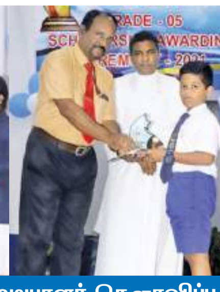
பற்றிமாவில் 222 புலமையாளர் கௌரவிப்பு