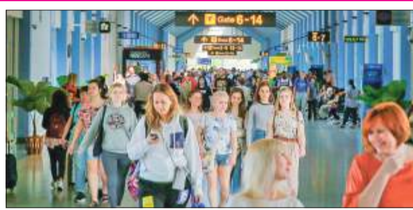
டத்தின் முதல் ஏழு மாதங்களில் வருமானமாகப் பெற்றுக்கொள்ள சுற்றுலாத்துறை மூலம் 50.4 மில்லி மடிந்ததென்றும் அமைச்சர் தெரிவித்துள்ளார்.

பயணிகள் நாட்டுக்கு வருகை தந்துள்ளதன் இந்த வருடத்தின் முதல் ஏழு மாதத்தில் அந்த எண்ணிக்கைவும் அவர் தெரிவித்துள்ளார். அதன்படி இந்த வருடத்தின் முதல் ஏழு மாதங்களில் மாதந்திரம் சுற்றுலாத்துறை மூலம் அரசாங்கம் 824.9 மில்லியன் அமெரிக்க டொலர்களை வருமானமாகப் பெற்றுக் கொண்டுள்ளதாகவும் அமைச்சர் தெரிவித்துள்ளார். அத்துடன் ஜூலை மாதத்தில் மாதந்திரம் சுற்றுலாத்துறை மூலம் 85.1 மில்லியன் அமெரிக்க டொலர் வருமானமாகப் பெற்றுக் கொள்ள முடிந்துள்ளதாகவும், கடந்த வரு