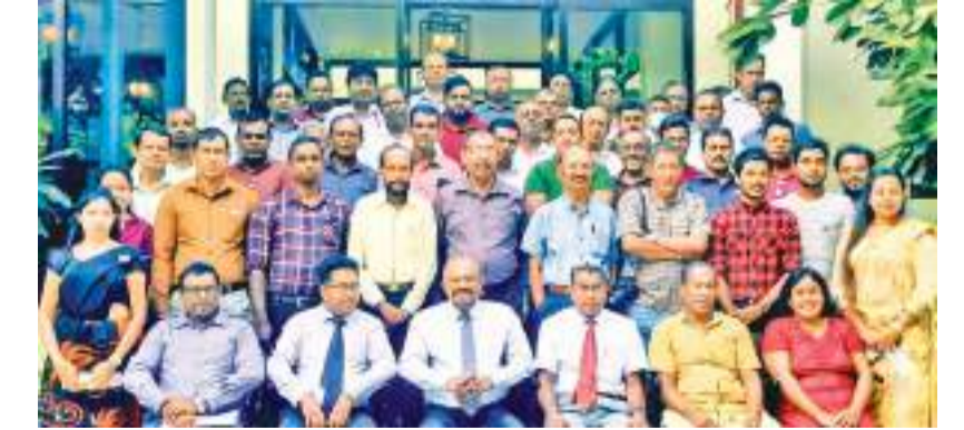
அநுராதபுரம் மாவட்ட செயலகத்தினால் ஏற்பாடு செய்யப்பட்ட மாவட்ட ஊடகவியலாளர் களுக்கான இரற் முகாமைத்துவம் சம்பந்தமான ஊடகவியலாளர் கருத்தரங்கு நேற்று அநுராதபுரம் நந்திய ஹோட்டலில் நடைபெற்றது. இதன் போது கலந்து கொண்ட ஊடகவியலாளர்கள் எடுத்துக் கொண்ட படம்.

இங்கு சிறிய ரக மீன் குஞ்சுகளை வளர்க்கும் எண்ணத்தில், சிறிய துவாரம் உள்ள மீன் பிடி வலைகள், மற்றும் தன்கூசு வலைகளை பாவித்து மீன் பிடிப்பதை நீர் வாழ் உயிரின அதிகாரிகள் தடை செய்துள்ளனர். இவ்வாறான பெரிய ரக மீன்கள் கிலோ 600 ரூபா தொடக்கம் 700 ரூபா வரையில் விற்பனை செய்யப்பட்டாலும், நுகர்வோரின் தேவையை பூர்த்தி செய்யும் அளவுக்கு மீன்கள் கிடைப்பதில்லை என நுகர்வோர் தெரிவிக்கின்றனர்.