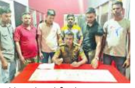
யாழ்ப்பாணம் குறாப் நிருபர்

யாழ்ப்பாணம் செயலகத்திற்கு கைப்பெயுடன் சந்தேகத்திற்கிடமாக நடமாடியவரின் மீட்பு கைப்பெயுடன் நடமாடிய இளைஞன் கைது. ஹெரோயின் போதைப்பொருளும் மீட்கப்பட்டுள்ளன. மாவட்ட செயலகத்திற்கு அருகாமையில் தேற்றுமுன்தினம் திங்கட்கிழமை மாலை பெண்கள் பாவிக்கும் கைப்பெயுடன் (ஹெண்ட்பேக்) சந்தேகத்திற்கிடமான முறையில் இளைஞனொருவன் அப்பகுதியில் நடமாடியுள்ளார். தகவல் அறிந்த யாழ்ப்பாண பொலிஸ் புலனாய்வு பிரிவினர் சம்பவ இடத்திற்கு சென்று, சந்தேகத்திற்கிடமான முறையில் நடமாடிய இளைஞனிடம் விசாரணைகளை முன்னெடுத்து, அவரது உடமைகளை சோதனை செய்தனர். சந்தேகநபர் 24 வயதுடைய குருநகர் பகுதியை சேர்ந்தவர் என தெரியவந்துள்ளது. இளைஞனின் கைப்பெயினுள் சுமார் 08 கிராம் ஹெரோயின் போதைப்பொருள் மற்றும் சுமார் 20 இலட்ச ரூபாய் பெறுமதியான தங்க நகை என்பன காணப்பட்டதாக பொலிஸார் தெரிவித்தனர்.