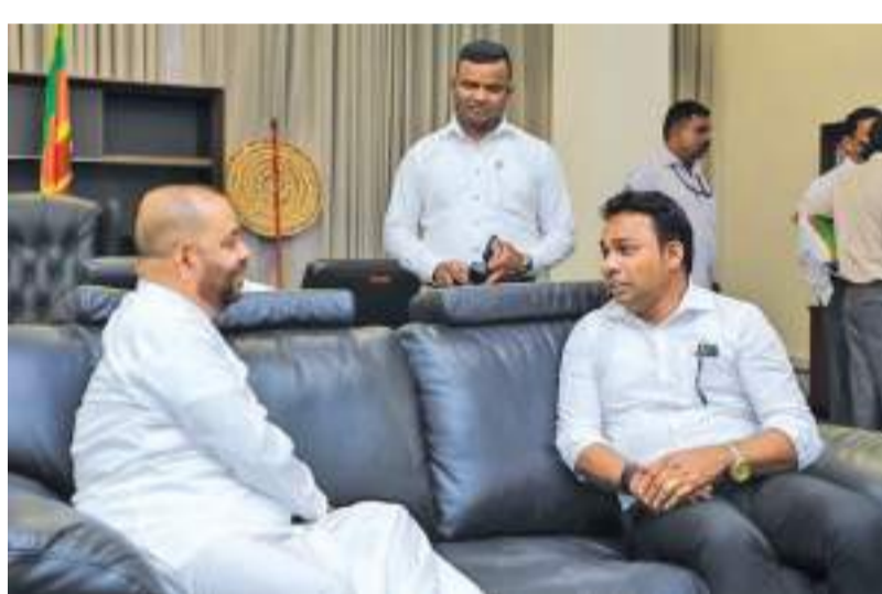
தற்போது கிழக்கிலுள்ள விவசாயிகள் எதிர்பார்ப்பும் உரப் பிரச்சினை தொடர்பாக விவசாய அமைச்சர் மஹிந்த அமரவீரவை விவசாய அமைச்சர், இராஜாங்க அமைச்சர் எஸ். வியாழேந்திரன் நேற்று சந்தித்து

கலந்துரையாடினர். தற்போது மட்டக்களப்பு மாவட்டத்துக்கு எதிர்பாரும் பெரும் போகத்துக்கு தேவையான யூரியா சுமார் எட்டாயிரம் 8,000 மெற்றிக் தொன் மற்றும் குடலப் பசளை சுமார்