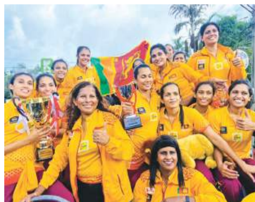
ஆசிய வலைப்பந்து சம்பியன்ஷிப் இறுதிப்போட்டியில் வென்று நேற்று நாட்டை வந்தடைந்த இலங்கை அணியினர் ஊர்வலமாக அழைத்துவரப்பட்டபோது...