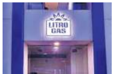
அது மாத்திரமன்றி உலக வங்கியின் கண்காணிப்பின் கீழ் அனைத்து கொள்வனவு மற்றும் பணக்கொடுப்பனவுகளும் இடம்பெறுகின்றன. சர்வதேசத்திடமிருந்து சமையல் எரிவாயுவை கொள்வனவு செய்யும்போது அனைத்து நடவடிக்கைகளும் அரசு திறைசேரியின் கண்காணிப்புக்கு உட்படுத்தப்படுகின்றன.

சமையல் எரிவாயு இறக்குமதி தொடர்பிலான ஒப்பந்தத்தின் போதும், சர்வதேசத்திடமிருந்து சமையல் எரிவாயுவை கொள்வனவு செய்யும் போதும், இலங்கைக்கு கிடைக்கப்பெற்றுள்ள உலக வங்கியின் நிதி, மோசடி செய்யப்பட்டதாக தெரிவிக்கப்படும் தகவல் முற்றிலும் உண்மைக்கு புறம்பானதென லிற்றோ நிறுவனம் தெரிவித்துள்ளது. லிற்றோ நிறுவனம் வெளியிட்டிருள்ள அறிக்கையிலேயே இந்த விடயம் தெரிவிக்கப்பட்டுள்ளது. லிற்றோ சமையல் எரிவாயு நிறுவனம், சமையல் எரிவாயு கொள்வனவின் போது முழுமையாக வெளிப்படாத தன்மையை பின்பற்றுகின்றது.