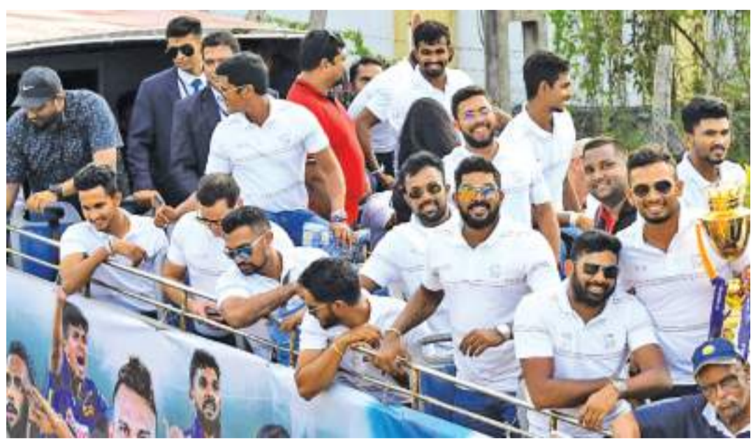
ஆறாவது தடவையாகவும் ஆசிய சின்னத்தை வென்ற இலங்கை கிரிக்கெட் அணி நேற்று நாட்டை வந்தடைந்தது. விமான நிலையத்திலிருந்து திறந்த வாகனத்தில் அழைத்துவரப்பட்ட அவர்களுக்கு வழிநடுகிறும் மக்கள் பெரும் ஆர்வாரத்துடன் வரவேற்பளித்தனர்.