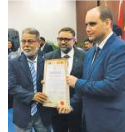
கலாபீட்டில் நீண்டகாலமாக பணிபுரிந்து வரும் இவர், தான் சார்ந்த சமூகத்திற்கு பல்வேறு பொது அமைப்புகளைக் கொண்டு சேவையாற்றி வருகின்றமை குறிப்பிடத்தக்கது.

பேருவளை, மஹகொடையை வசிப்பிடமாகக் கொண்ட சமூக சேவையாளரும் அகில இலங்கை சமாதான நிகழ்வொன்றில் அண்மையில் கொழும்பு பண்டாரநாயக்க சர்வதேச மாநாட்டு மண்டபத்தில் நடைபெற்ற கௌரவிப்பு நிகழ்வில் தேசாபிமானி பட்டம் வழங்கி கௌரவிக்கப்பட்டுள்ளார். சமாதானம், ஐக்கியம் கலாசார அபிவிருத்தி மனித உரிமைகள் செயற்பாடுகளுக்காக இவர் ஆற்றிய பங்களிப்பை கௌரவிக்கும் வகையில் இலங்கை சமாதான நிகழ்வொன்றில் பேரவையினால் ஒழுங்கு செய்யப்பட்ட தேசிய சமாதான மாநாட்டில் இந்த அழியுமிருந்து வழங்கப்பட்டுள்ளது. பேருவளை ஜாமியா நளீமிய்யா