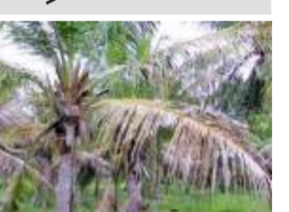
காய்களை பறித்த தாங்கள் தற்போது ஐந்து தேங்காய்களை கூட பறிக்க முடியாத நிலை ஏற்பட்டுள்ளதாகவும் குறிப்பிடுகின்றனர். எனவே, இலை கொட்டி நோயைக் கட்டுப்படுத்துவதற்கு உரிய அதிகாரிகள் உடனடியாக நடவடிக்கை எடுக்க வேண்டும் என தெற்கு செய்கையாளர்கள் கோரிக்கை விடுகின்றனர்.

தென்னை மரங்களுக்கு இவ்வாறு நோய் ஏற்பட்டமை தமக்கு மேலும் பொருளாதார ரீதியாக பாதிப்பை ஏற்படுத்தியுள்ளதாகவும் தெற்கு பயிர் செய்கையாளர்கள் கூறுகின்றனர். இவ்வாறு தென்னை மரங்கள் இலை கொட்டி நோயினால் பாதிக்கப்பட்டுள்ளமையால் தென்னையில் இருந்து எதிர்பார்த்த விளைச்சலைப் பெறமுடியாத நிலை ஏற்பட்டுள்ளதாகவும் தென்னை இலைகளின் பச்சையம் இல்லாமல் நாளுக்கு நாள் தென்னை மரங்கள் பழுதடைந்து வருவதாகவும் தெற்கு செய்கையாளர்கள் கவலை தெரிவிக்கின்றனர். முன்னர் ஒரு ஏக்கரில் 2500 தேங்