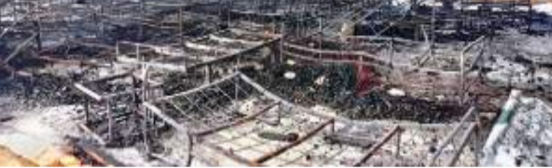
வவுனியா விசேட நிருபர்

வவுனியா மன்னார் வீதி 4ஆம் கட்டை பகுதியில் வீதி அபிவிருத்தி பணியில் ஈடுபடும் ஊழியர்கள் தங்கியிருந்த விடுதியில் ஏற்பட்ட தீப்பரவல் காரணமாக விடுதி முற்றாக சேதமடைந்துள்ளது. மாவட்டத்தின் பல பகுதிகளில் மெகா (Mega) நிறுவனத்தினரால் ஒப்பந்தம் அடிப்படையில் வீதி அபிவிருத்தி பணிகள்