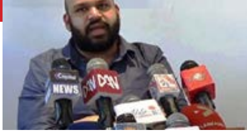
இருப்பதற்கு தங்களுக்கு மொட்டு கட்சியினருக்கும் இடையே விரிசல் ஏற்பட்டு

இதனை தெரிவித்துள்ளார். இந்த விடயம் தொடர்பாக அவர் மேலும் தெரிவிக்கையில் - 'தமிழர்களின் பிரச்சினைகளுக்குத் தீர்வு வழங்குவேன் எனக் கூறி சர்வதேசத்தினுடைய ஆதரவைப் பெறவே ஜனாதிபதி ரணில் விக்கிரமசிங்க முயற்சிகளை எடுத்து வருகின்றார். அதே போன்று உள்நாட்டுக்கு உள்ளே பிரச்சினைகளைத் தீர்க்காமல்