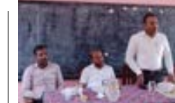
மாவடிப்பள்ளி அஸ்ரப் வித்திக்கு புதிய அதிபர்

மக்களால் தெரிவு செய்யப்பட்டு வருகின்ற மக்கள் பிரதிநிதிகள் இந்தப் பிரச்சினைக்குத் தீர்வை தருவதாக நேரடி கலந்துரையில் மேலட்களில் வாக்குறுதி வழங்கினாலும் அவை எதுவும் நிறைவேற்றப்படவில்லை என விசனம் தெரிவித்துள்ளனர். இது தொடர்பில் அதிகாரிகள் பலரும் பல்வேறு காரணங்களை கூறி வருகின்ற நிலையில் தமக்கான உச்சகட்ட அதி காரத்தை பயன்படுத்தி இந்தப் பிரச்சினைக்குத் தீர்வை வழங்க முன்வர வேண்டும் என சம்பந்தப்பட்ட திணைக்கள அதிகாரிகளிடம் மக்கள் கோரிக்கை விடுத்துள்ளமை குறிப்பிடத்தக்கது.