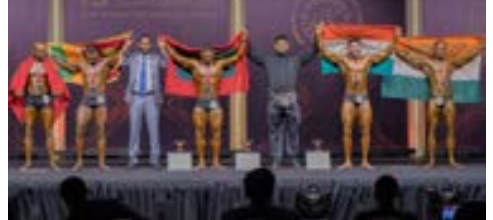
தெற்காசிய உடற்கட்டமைப்பு போட்டியில்

வேலைத்திட்டம் நாட்டு ராஜ்யம் இடம்பெற்று வருகின்றன. அதே நேரம் நாட்டின் பொருளாதாரத்தை லீனக் கட்டியெழுப்பும் நடவடிக்கைகளை மேற்கொண்டு வருகிறது. மேலும் ஐக்கிய தேசிய கட்சி இடம்பெற்ற ஊழல் மோசடிகளுடன் ஒருபோதும் சம்பந்தப்பட்டதில்லை. கடந்த வருடம் 10 பில்லியன் ரூபாய் மத்திய வங்கி பிணைமுறி மோசடி குற்றச்சாட்டுக்கள் தற்போது பொய்யாகி உள்ளன. என்றாலும் ரணில் விசுவநாதன் சிங்க பிணைமுறியில் 12 பில்லியன் ரூபாயை மத்திய வங்கியில் வைப்பில் வைத்துக்கொண்டே இந்த நடவடிக்கையை கையாண்டு வந்தார். அதனால் பிணைமுறி மோசடியால் நாட்டுக்கு எந்த பாதிப்பும் ஏற்படவில்லை. மேலும் கோட்டாபய ராஜபக்ஷ அரசாங்கம் வரி விலக்களியின் மூலம் சுமார் 600 பில்லியன் ரூபாய் நாட்டின் பெருமானம் இல்லாமல் போனது. அதன் காரணமாகவே நாடு வங்குரோத்து நிலைக்குச் சென்றது. இவ்வாறு வங்குரோத்து அடைந்த நாட்டையே ரணில் விசுவநாதன் சிங்க நடவடிக்கைகள் மூலம் மீட்டி வருகிறார். இன்னும் வங்குரோத்து நிலையில் இருந்து முற்றாக நீங்கும் என்ற நம்பிக்கை எமக்கு இருக்கிறது. அதற்கான வேலைத்திட்டங்களை ஜனாதிபதி முன்னெடுத்து வருகிறார். - என்றார். (05)