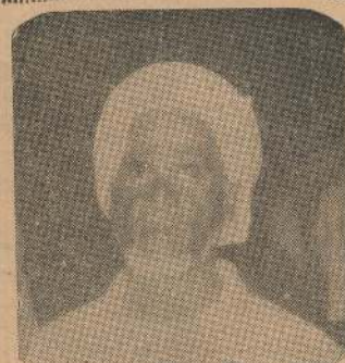
புலிகள் சப்பிய, ஓட்டமாவடி 'கொமெய்னி'

இருள்! நேர்மைகளும் நியாயங்களும் இங்கே செத்தபடி..... ஓர் இனம் வாழ மறுஇனம் மாய்கிறது! கோஷங்கள் எல்லாம் வேஷங்களாகி வெளிச்சத்துக்கு வர மறுக்கின்றது! தேச சுதந்திரம் தேய்ந்துகொண்டிருக்க தேசங்கள் இங்கே சாய்ந்து கொண்டிருக்கின்றது "நவாஸ்"