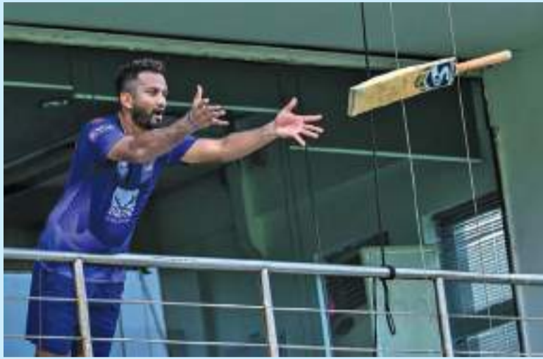
முறையில் பார்க்கிறேன்" என்று அவர் தெரிவித்தார்.

"தலைமை பொறுப்புக்கு பொருத்தமான சில வீரர்கள் உள்ளனர். சில வீரர்கள் வளர்ந்து இந்த பொறுப்பை ஏற்படுத்த திறன் படைத்தவர்களாக இருப்பதை நான் தனிப்பட்ட