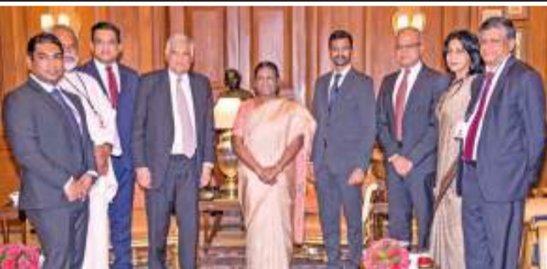
ஜனாதிபதி ரணில் விக்கிரமசிங்க தலைமையிலான தூதுக்குழு, இந்திய குடியரசுத் தலைவர் திரௌபதி முர்முவை டெல்லியில் உள்ள ராஷ்டிரபதி பவனிச் சந்தித்த போது...

தெரிவித்தார். இலங்கை பொருளாதார சீர்திருத்தங்களை சீராக அமுல்படுத்தி வருவதாகவும் இந்தியப் பிரதமருடனான தூதுக்குழு மட்டத்தில் நடைபெற்ற கலந்துரையாடல்களின் மூலம் நாட்டை ஸ்திர்ப்படுத்துவதற்கான சாதகமான பெறுபெறுகளை வெளிப்படுத்தி வருவதாகவும் தெரிவித்த ஜனாதிபதி விக்கிரமசிங்க, எடுக்கப்பட்ட தீர்மானங்களின் மூலம் இலங்கை அடைந்துள்ள முன்னேற்றம் தொடர்பாக உள்ளாட்டிலும் வெளிநாடுகளிலும் மீண்டும் நம்பிக்கையை