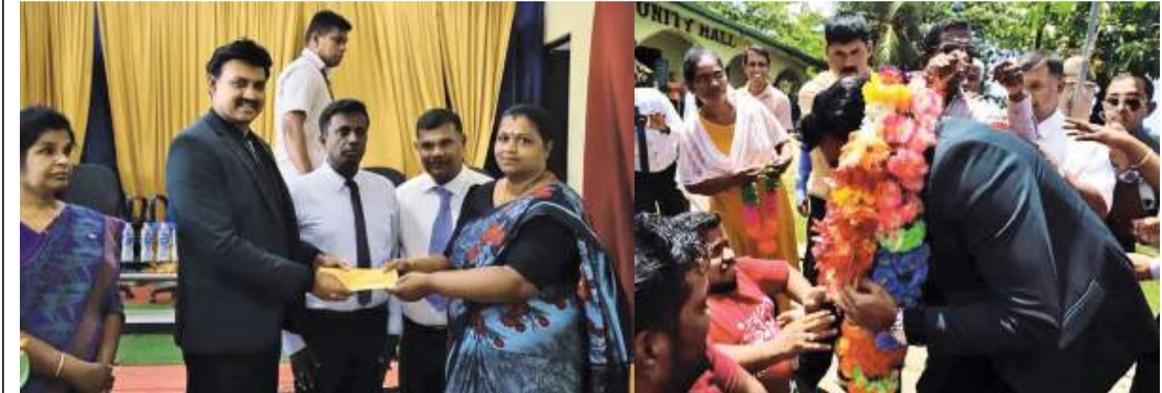
மட்டக்களப்பு மாவட்டத்திலுள்ள மாற்றுத் திறனாளிகளுக்கு கிழக்கு மாகாண ஆளுநர் செந்தில் தொண்டமான் உதவித்தொகை வழங்கி வைத்ததுடன், நந்தவனம் முதியோர் இல்லம், ADVRO முதியோர் இல்லம், கிழக்கு இல்லமாயி மாற்றுத்திறனாளிகள் இல்லம், முஸ்லிம் முதியோர் இல்லம் போன்றவற்றின் நிர்மாணப் பணிகளுக்கு நிதியுதவியும் வழங்கி வைத்தார்.