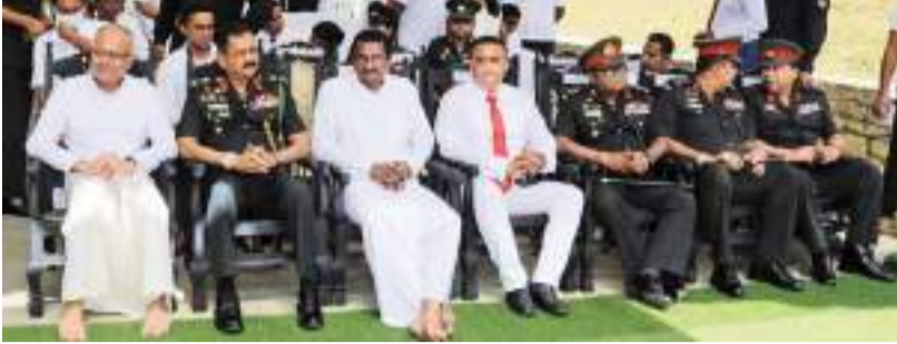
கவத்தை தினகரன் விசேட நிருபர்

சங்கரமுவ மகா சமன் தேவாலயத்தில் விசேட தேவையுடையோருக்கான பிரத்தியேக வீதி