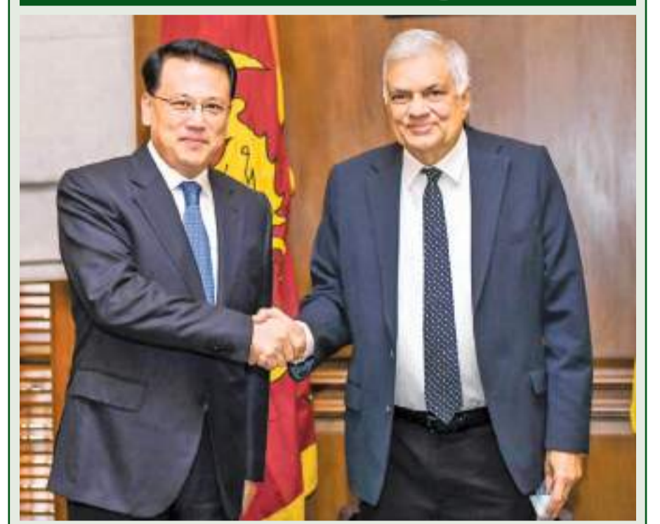
சவால்களுக்கு மத்தியிலும் நாட்டின் பொருளாதாரத்தைக் கட்டியெழுப்புவதற்கான ஜனாதிபதி ரணில் விக்கிரமசிங்கவின் அர்ப்பணிப்பை சீன கம்யூனிஸ்ட் கட்சியின் அரசியல் துறாக்குழுவினர் பாராட்டியுள்ளனர். சீன கம்யூனிஸ்ட் கட்சியின் மத்திய செயற்குழு மற்றும் அரசியல் குழுவின் உறுப்பினரும், ஷென் கிங், நகரசபை