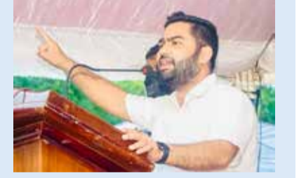
02 மூப் பக்கத்தில்...

மகரூப் தெரிவித்துள்ளார். வெளி மாகாணங்களுக்கு நியமனம் செய்யப்பட்டுள்ள கிழக்கு மாகாணத்தைச் சேர்ந்த கல்விக்கல்லூரி ஆசிரியர் குழுப் பிரதிநிதிகளுடனான சந்திப்பு நேற்று (24) திங்கட்கிழமை கொழும்பில் இடம்பெற்ற போது கருத்து தெரிவிக்கையிலேயே இவ்வாறு அவர் இவ்வாறு தெரிவித்தார்.