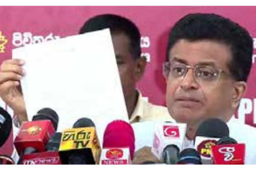
02 மூப் பக்கத்தில்...

அரசியலமைப்பின் 13ஆவது திருத்தச்சட்டத்தில் உள்ள பொலிஸ் அதிகாரங்களை நீக்கும் 22ஆவது திருத்தச்சட்டத்தை அடுத்த வாரம் பாராளுமன்றத்தில் சமர்ப்பிக்கவுள்ளதாக பிவித்துரு ஹெல் உறுமய கட்சியின் தலைவரும் பாராளுமன்ற உறுப்பினருமான உதய கம்மன்பில தெரிவித்தார். பிவித்துரு ஹெல் உறுமய கட்சியின்