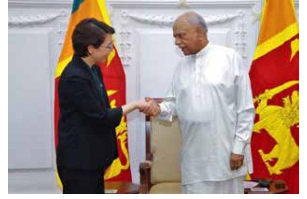
கீழ், இலங்கையர்களை ஆட்சேர்ப்பு செய்வதற்கான சாத்தியக்கூறுகள் குறித்து ஆராயுமாறு தூதுவரிடம் பிரதமர் வலியுறுத்தினார்.