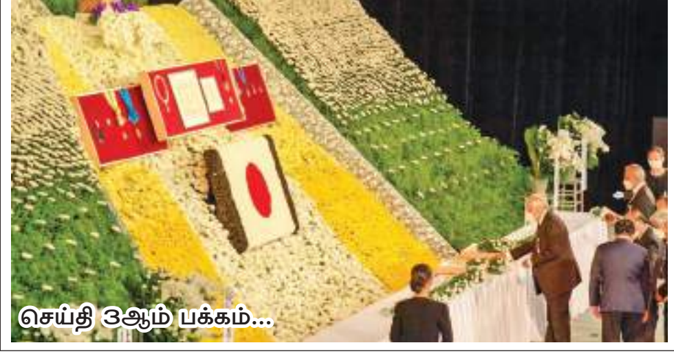
செய்தி 3ஆம் பக்கம்...