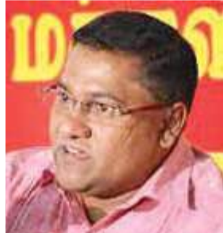
ஜே.வி.பி எம்.பி விஜித் ஹேரத்

தற்குக்கூட முடியாத நிலையில் வாழ்கின்றனர். கம் பனிகளுக்கு வரிச் சலுகைகளை வழங்கி தங்களின் சொந்தப் பணத்தை வங்கிகளில் வைத்திருக்கும் முதியோருக்கு இவ்வாறான நிலை தோற்றுவிக்கப்பட்டுள்ளது. கடந்த காலங்களில் வங்கி வாட்டி வீதத்தில் மாற்றங்களை மேற்கொண்டமையினால் பல்வேறு தரப்பினரும் பாதிக்கப்பட்டுள்ளனர். இதனால் சிறிய மற்றும் மத்திய தொழில்துறையினருக்கும் பாதிப்பு ஏற்பட்டுள்ளது. இது மிகவும் அநீதியானது. அதேவேளை ஊழல் மோசடிகளை