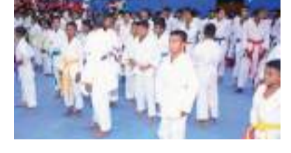
மாணிக்காடு குறுப் நிருபர்

றுக்கிழமை (02) நடைபெற்றது. தென்கிழக்கு பல்கலைக்கழக கராத்தே போட்டி நடைபெற்றது. சர்வதேச மாசியல் ஆட்.ஐ.எம்.ஏ சம்மேளனத்தின் பிரதம போட்டி நடைபெற்றது. மூன்றுமது இப்பால் தலைமையில் இடம்பெற்ற இந்த நிகழ்வில் ஆறு வயது தொடக்கம் 13 வயது வரையான சப் ஜூனியர் மற்றும் கட்டெட், ஜூனியர், சீனியர் என அனைத்து பிரிவையும் சேர்ந்த ஆண், பெண் இரு பாலாருக்குமான காதா, டம் காதா, குமிதே ஆகிய போட்டிகள் நடைபெற்றன.