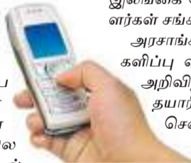
சமூக பாதுகாப்பு பங்களிப்பு வரி

சமூக பாதுகாப்பு பங்களிப்பு வரி அறிமுகம் படுத்தப்பட்ட பின்னர் அனைத்து வகையான கையடக்க தொலைபேசிகள் மற்றும் துணை சாதனங்களின் விலைகள் மீண்டும் உயருமென அகில இலங்கை தொடர்பாடல் நிலைய உரிமையாளர்கள் சங்கம் தெரிவித்துள்ளது. புதிய வருடாந்த வருமானம் 10 மில்லியன் ரூபாவுக்கும் அதிகமான வருமானத்தை பெறும் வர்த்தகர்களுக்கு சமூக பாதுகாப்பு வரி அறிவிடப்படுகிறது. இதனையடுத்து பெரிய இறக்குமதி யாளர்கள் பொருட்களை சில்லறை விற்பனையாளர்களுக்கு விற்கும் போது வரியைச் சேர்க்கின்றனர். இதனையடுத்து சில்லறை விற்பனையாளர்கள் தங்கள் பொருட்களை வாடிக்கையாளர்களுக்கு விற்கும்போது கூடுதல் வரிக்கூட்டன் விலையை அதிகரிப்பதாக