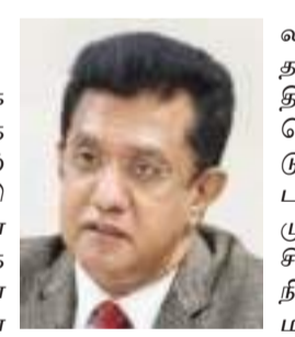
சஜித் ஹர்ஷா டி. சில்வா

கோப் உறுப்பினராக முன்னாள் தலைவர் சரித்த ஹேரத்தை நியமிப்பதற்காக ஐக்கிய மக்கள் சஜித் எம்.பி. ஹர்ஷா டி. சில்வா கோப் குழு உறுப்பினர் பதவியிலிருந்து இராஜினாமா செய்ததாக பாராளுமன்றத்தில் நேற்று அறிவிப்பு வெளியிட்டார். கோப் குழு உறுப்பினர் பதவியி