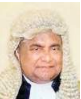
மஹிந்த யாப்பா அபேவர்த்தன

கோப் மற்றும் கோபா குழுக்களுக்கு உறுப்பினர்களை நியமிப்பதற்கான தீர்மானம் கட்சித் தலைவர்கள் கூட்டத்திலேயே எடுக்கப்பட்டது. தாம் அதில் தலையிடவில்லையென சபாநாயகர் மஹிந்த யாப்பா அபேவர்த்தன பாராளுமன்றத்தில் நேற்றுத் தெரிவித்தார். கட்சித் தலைவர்கள் கூட்டத்தில் அவ்விடயம் தொடர்பில் கவனம் செலுத்தப்படாது. சுயாதீன தரப்பினருக்கு சபையில் உரையாற்ற