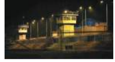
கரித்துள்ளன. 2020 தொடக்கம் இவ்வாறான மோதல்களில் 400க்கும் அதிகமானோர் கொல்லப்பட்டிருப்பதாக ஈ.எப்.ஈ செய்தி நிறுவனம் குறிப்பிட்டுள்ளது.

ஈக்வடோரின் மிகப்பெரிய சிறைகளில் ஒன்றான லட்குவாவில் கைதிகளுக்கு இடையே ஏற்பட்ட மோதலில் குறைந்தது 15 கைதிகள் உயிரிழந்துள்ளனர். கைதிகள் துப்பாக்கி மற்றும் கத்திகளால் சண்டையிட்டதாகவும் தொடர்ந்து சிறை காவலர்கள் நிலைமையை கட்டுப்பாட்டுக்குள் கொண்டுவந்ததாகவும் தேசிய கைதிகள் நிறுவனம் குறிப்பிட்டது. ஈக்வடோர் சிறையில் போதைக்கடத்தல் சும்பல்களுக்கு இடையிலான மோதல்கள் அண்மைக் காலத்தில் அதி