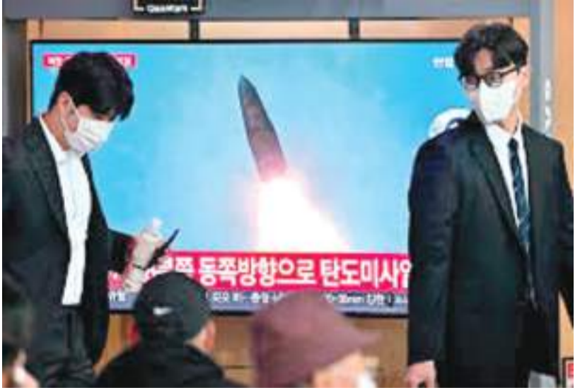
மேலால் முன்னெச்சரிக்கை அல்லது அறிவுறுத்தல் இன்றி ஏவுகணையை பறக்கவிடுவதும் சர்வதேச விதமுறைகளுக்கு எதிரானதாகும். ஹெராகைடோ தீவு உட்பட வடக்கு ஜப்பானில் உள்ள மக்கள்

ஜப்பானுக்கு மேலால் வட கொரியா நேற்று (04) இடைநிலைத் தூர ஏவுகணை ஒன்றை வீசியுள்ளது. இது ஜப்பான் மற்றும் அமெரிக்காவின் அவதானத்தை அதிகரித்துள்ளது. சுமார் 4,500 கிலோமீற்றர் பறந்த இந்த பலிஸ்டிக் ஏவுகணை பக்கி கடலில் விழுந்துள்ளது. இது அமெரிக்காவின் குவாம் தீவை தாக்க போதுமான தூரமாகும். 2017 ஆம் ஆண்டுக்குப் பின்னர் ஜப்பானுக்கு மேலால் வட கொரியா ஏவுகணை வீசி இருப்பது இது முதல் முறையாகும். இதனால் ஜப்பான் தனது நாட்டு மக்களுக்கு அரிதான எச்சரிக்கை ஒன்றை விடுத்தது. வட கொரியா பலிஸ்டிக் ஏவுகணை மற்றும் அணு ஆயுதம் சோதிப்பதை ஐ.நா. தடை செய்துள்ளது. மற்றொரு நாட்டின்