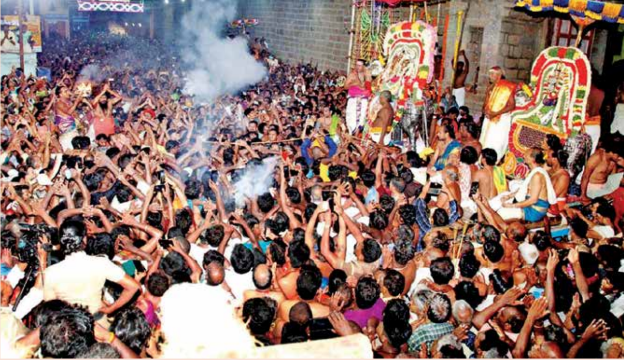
தருமை ஆதீனத்தின் ஏற்பட்டில் அப்பர் பெருமானுக்கு திருக்கயிலாயக் காட்சிப் பெருவிழாவானது, திருவையாற்றில் அருள்மிகு ஐயாறப்பர் திருமுன்னரில், வருகின்ற ஆடித்

திங்கள் 31ம் நாள் (16-08-2023) ஆழ மறைமதி நாளன்று மாலை 6 மணியளவில் இடம்பெறவுள்ளது.