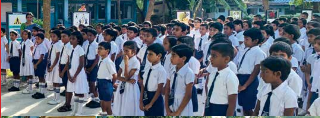
யாழ்ப்பாணம் இந்து ஆரம்ப பாடசாலை நற்சிந்தனை நிகழ்வு