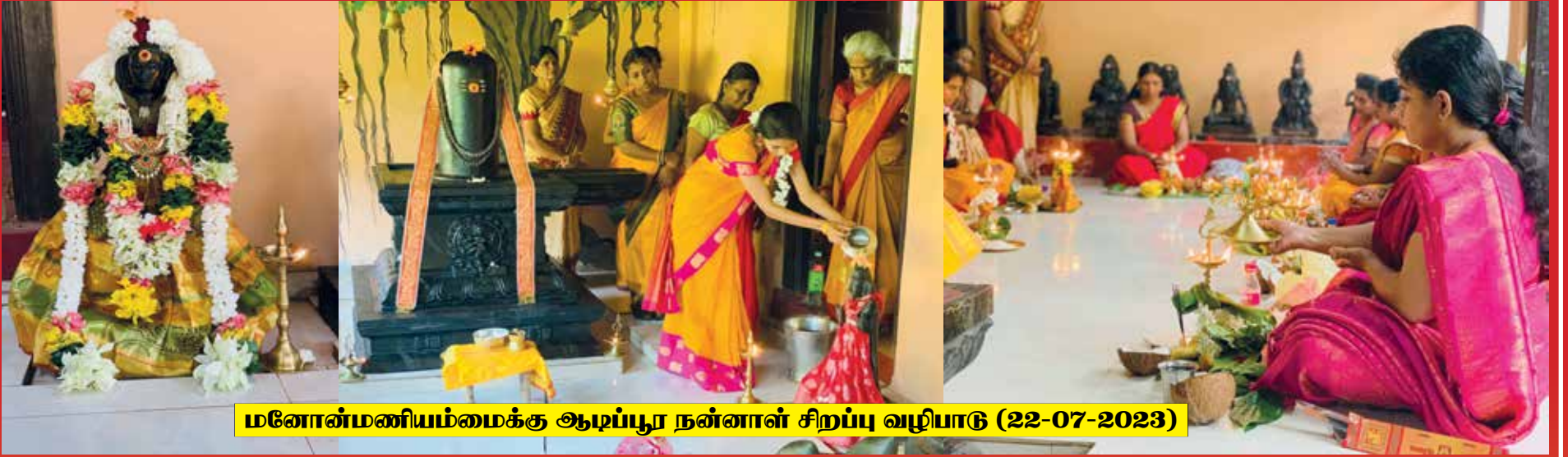
மனோம்னியம்மைக்கு ஆடிப்பூர நன்னாள் சிறப்பு வழிபாடு (22-07-2023)