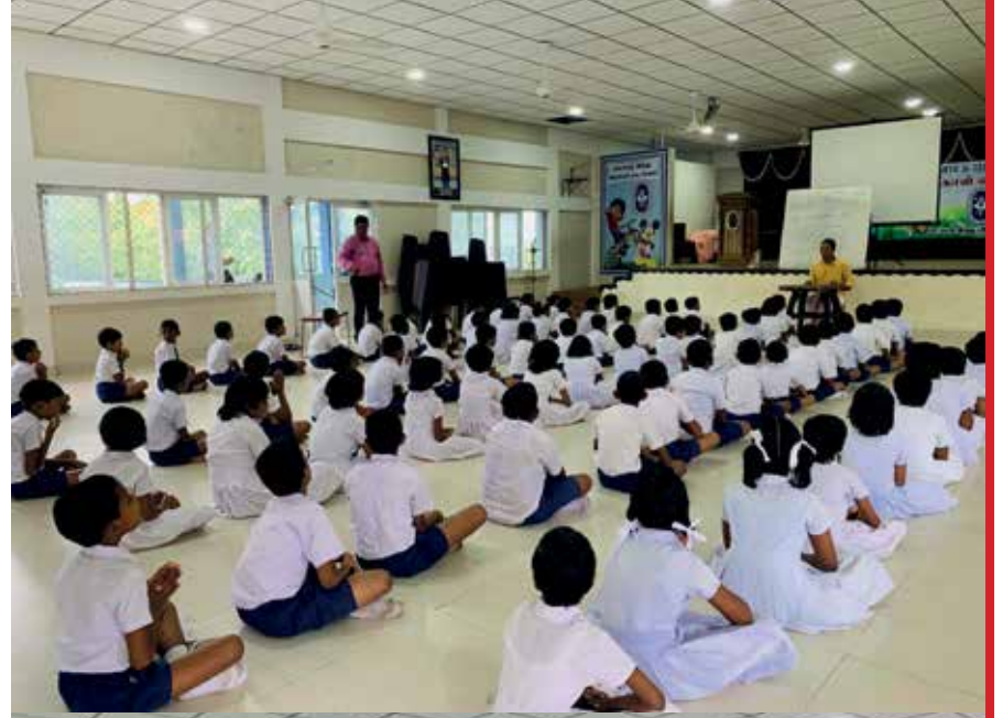
யாழ்ப்பாணம் இந்து ஆரம்ப பாடசாலை பண்ணிசை வகுப்பு