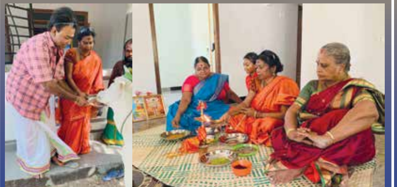
நயினாத்வில் தெய்வத்தமிழில் புதுமனைப் புகழிழா (06-07-2023)