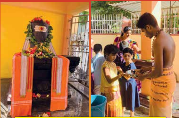
தாயுமானவர் சுவாமி திருக்கோயிலில் சனிக்கழுவாய் வழிபாடு (15-07-2023)