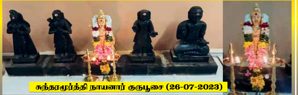
சுந்தரமூர்த்தி நாயனார் குருபூசை (26-07-2023)