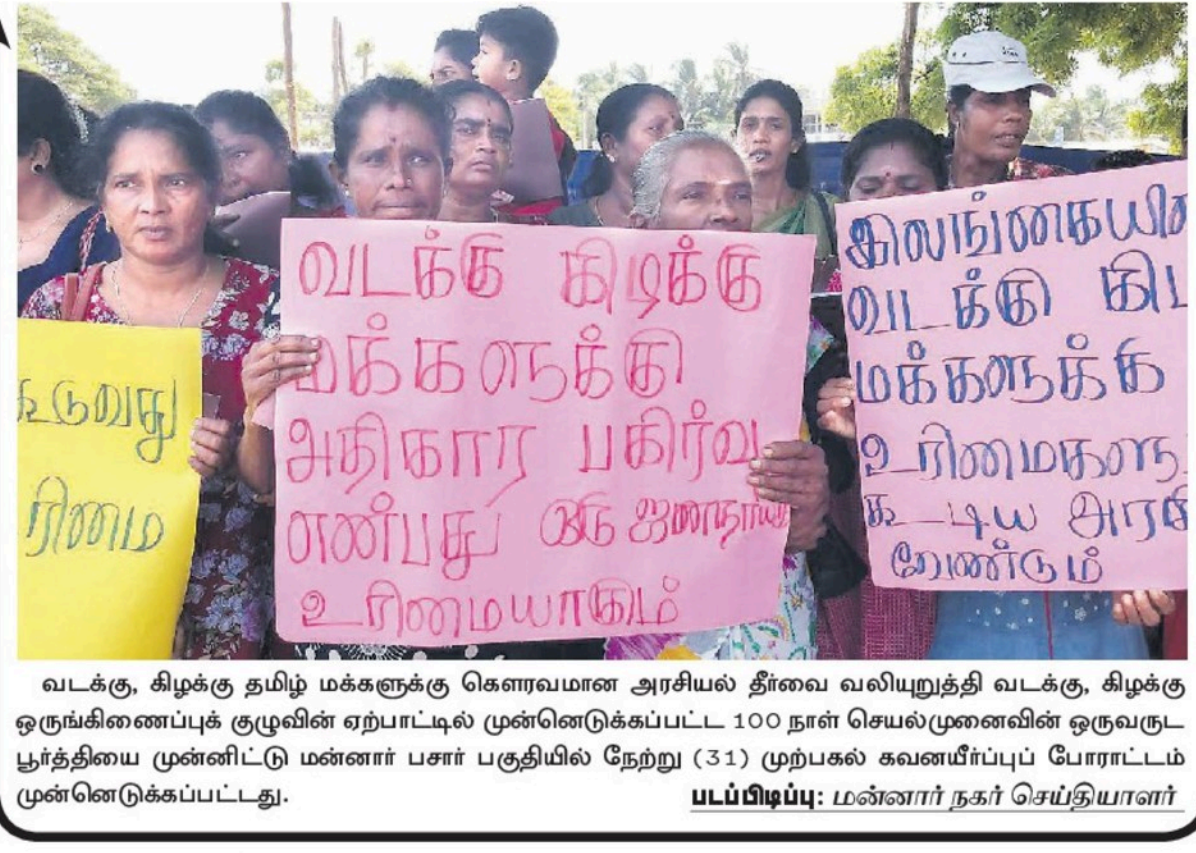
வடக்கு, கிழக்கு தமிழ் மக்களுக்கு கௌரவமான அரசியல் தீர்வை வலியுறுத்தி வடக்கு, கிழக்கு ஒருங்கிணைப்புக் குழுவின் ஏற்பாட்டில் முன்னெடுக்கப்பட்ட 100 நாள் செயல்முனைவின் ஒருவருட்புர்த்தியை முன்னிட்டு மன்னார் பசர் பகுதியில் நேற்று (31) முற்பகல் கவனயீர்ப்புப் போராட்டம் முன்னெடுக்கப்பட்டது.

ஜனாதிபதி ரணில் விக்கிரமசிங்க அமெரிக்கா உள்ளிட்ட நாடுகளுடன் நெருங்கிய தொடர்புகளை மேற்கொண்டுவரும் பின்னணியில் தலிபான்களுடன் நடத்தப்பட்டுள்ள... 02 பக்கம்