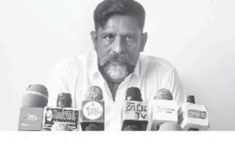
மண்ணை விநியோகித்தவர்கள் யார், இதனை யார் பார்த்துக் கொண்டிருக்கிறார்கள்? இந்தக் கேள்விக்கு அதிகாரிகள் விடையை முயல்கள்.

இந்தப் புவியியலியல் அளவைகள் கரங்கங்கள் திணைக்களத்தால் சகல நடவடிக்கையும் நிறுத்தப்பட்டு பின்பும் மாவட்டத்தில் மணலுக்கான கிறவலுக்கான எந்தவிதமான தட்டுப்பாடும் இருக்கவில்லை. அதேவேளை, இந்த மணல் கிடைக்கவில்லை என அபிவிருத்திகள் நிறுத்தப்பட்டன. இந்நிலையில், இந்தத் தடைகளைத் தாண்டி ஆற்று மண் கிரவல்களை விநியோகித்தவர்கள் யார், இது எங்கிருந்து கொண்டு வரப்பட்டது? அப்படியானால், அரசாங்கத்துக்கு கடந்த முறை நூள் ஒன்றுக்கு கிடைத்த 50 தொகை 75 இலட்சம் ரூபா வரையிலான வருமானம் யாருக்கு சென்றது. இதனை ஆராயவேண்டியவர்கள் அமைச்சர்களும் அதிகாரிகளும். ஏனென்றால், ஒருவர் ஒரு பிடி மண்ணையும் எடுக்க விடாமட்டேன் எனவும் இன்னும் ஒருவர் மாற்றுக்கருத்தையும் கூறுகின்றனர். அவ்வாறாயின், உங்கள் தடைகளைத் தாண்டி இந்த