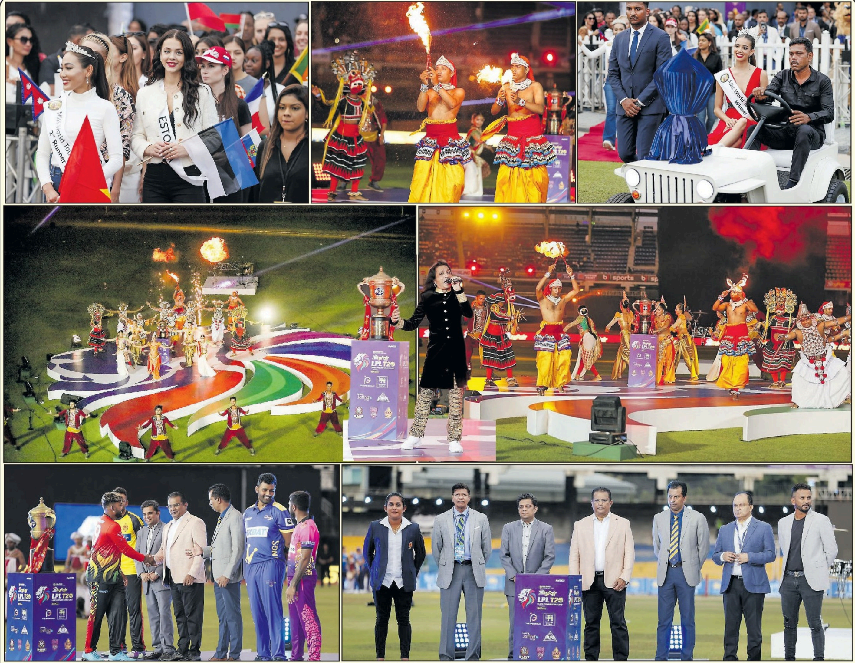
2023 ஆம் ஆண்டுக்கான எல்.பி.எல் தொடரின் ஆரம்ப விழா நேற்று முன்தினம் கொழும்பு ஆர்.பிரேமதாஸ சர்வதேச கிரிக்கெட் மைதானத்தில் கோலாகலமான முறையில் நடைபெற்றது.