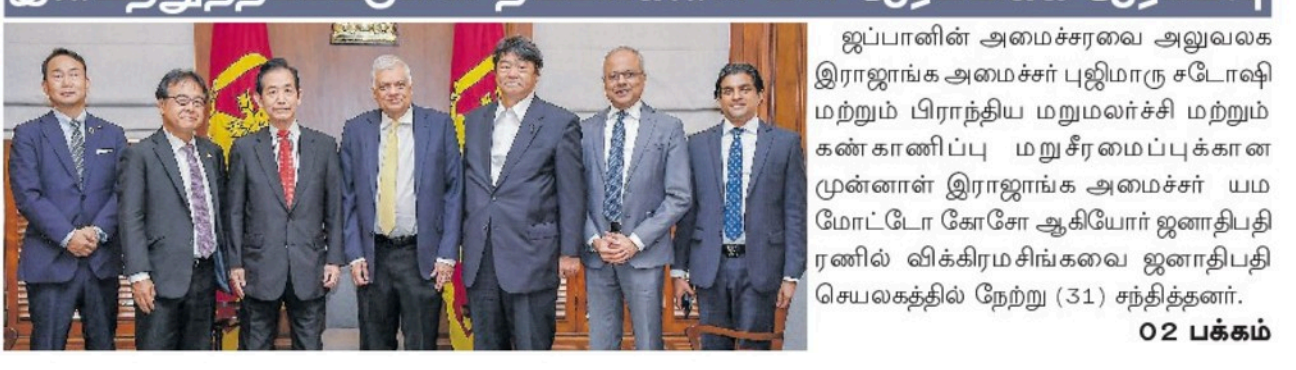
இடையேயுள்ள திட்டங்களை மீள ஆரம்பிக்க ஆராய்வு

ஜப்பானின் அமைச்சரவை அலுவலக இராஜாங்க அமைச்சர் புஜிமாரு சடோஷி மற்றும் பிராந்திய மறுமலர்ச்சி மற்றும் கண் காணிப்பு மறுசீரமைப்புக்கான முன்னாள் இராஜாங்க அமைச்சர் யாமோட்டோ கோசோ ஆகியோர் ஜனாதிபதி ரணில் விக்கிரமசிங்கவை ஜனாதிபதி செயலகத்தில் நேற்று (31) சந்தித்தனர். 02 பக்கம்