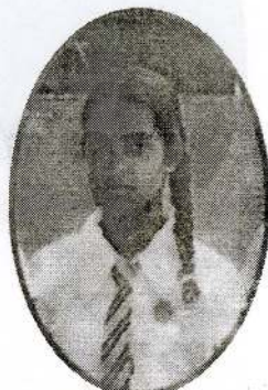
ஞானசேகரம் துளசி 5A,2B,2C