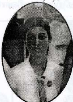
உருத்திரமூர்த்தியர் விஸ்னுகா 4A,3B,2C