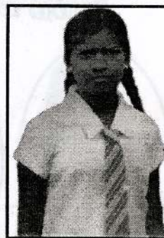
நவரட்ணசிங்கம் ஜீவரோகினி B,2C (நுண்கலை)