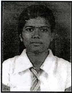
வேதாரணியம் நிதர்சினி 3A (முகாமைத்துவம்)