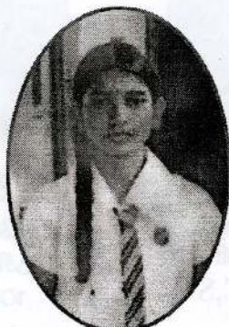
குணரட்ணம் நிசாளினி 7A,B,S