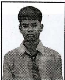
கனகசபை கட்சன் 2B,C (நுண்கலை)