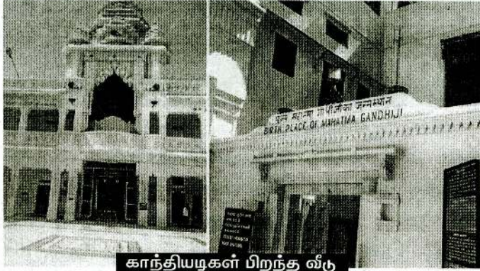
காந்தியடிகள் பிறந்த வீடு