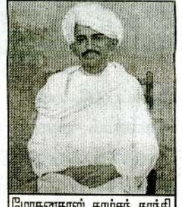
மோகன்தாஸ் கரம்சந் காந்தி

இந்தியாவின் குஜாராத்திலுள்ள போர்பந்தின் கத்திவார் சமஸ்தானப் பகுதியில் 02.10.1869 ஆம் திகதி கரம்சந்காந்திக்கும் புத்தலி பாய்க்கும் நான்காவது (கடைசி) பிள்ளையாக பிறந்தார். இவரது பிறப்பு அக்காலத்தில் பல்வேறு பிரச்சனை களும், அமைதி யின்மையும் நிலவிய போது ஒரு அவசிய தேவையாக விருந்தபடியால் இதை ஒரு அவதாரமாகக் கூட எண்ண முடிகிறது. பெற்றோரின் அரவணைப்பில் நல்ல சிந்தனைகள் ஊட்டப்பட்டன. சிறந்த செயற்பாடுகளுக்கு வழிகாட்டப்பட்டன. தாயார் மிகுந்த இறைபக்தி கொண்டவர்.